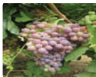
شکل ۶-۵ انگور دیم (اول)