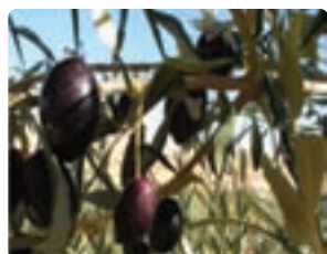
شکل ۶-۱۱ زیتون (اول)