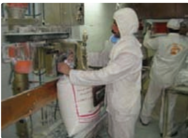
شکل ۳۴- صنایع غذایی بیضا