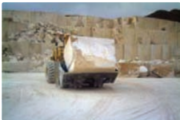
شکل ۳۶-۶- کانی غیرفلزی