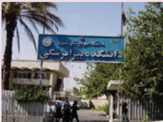
شکل ۳۹-۶ دانشگاه شیراز