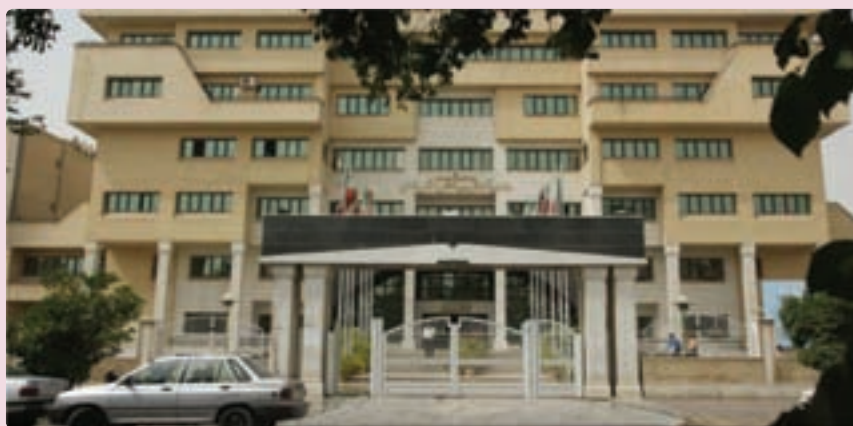
شکل ۴۰-۶ اداره کل آموزش و پرورش استان فارس

از نظر مراکز آموزش عالی نیز تعداد دانشجویان استان در سال ۱۳۵۷ تنها ۶۴۷۰ نفر بوده است که این تعداد در سال ۸۷-۱۳۸۶ به ۱۷۴,۰۰۰ دانشجوی دانشگاه دولتی و آزاد اسلامی افزایش یافته است. تأسیس دانشگاه صنعتی شیراز و تبدیل آن به دو بخش دانشگاه شیراز و دانشگاه علوم پزشکی، تأسیس دانشگاه دولتی در فسا، جهرم و ... تأسیس ۱۳ آموزشکده فنی در نقاط مختلف استان، تأسیس دانشگاه مجازی شیراز و تأسیس دوره دکتری در رشته‌های مختلف در دانشگاه شیراز، بخشی از اهداف علمی استان بوده است.