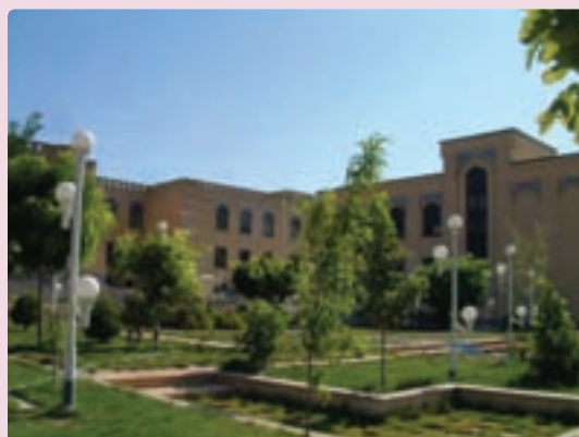
شکل ۳۸-۶ دانشگاه آزاد شیراز

علمی و آموزشی: یکی از ابعاد توسعه همه‌جانبه استان علاوه بر گسترش سوادآموزی، رشد فعالیت علمی و آموزشی در دانشگاه‌ها و توسعه مراکز آموزشی در مقاطع گوناگون تحصیلی در استان فارس بوده است. میزان باسوادی در استان فارس از ۴۹/۵ درصد سال ۱۳۵۵ به ۸۷ درصد در سال ۱۳۸۵ افزایش یافته که بیانگر تحول قابل ملاحظه‌ای در سوادآموزی است.