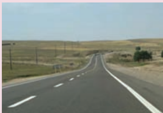
شکل ۴۶-۶ راه‌های بین شهری

در بخش انرژی کارهای بزرگی در استان فارس شروع شده که علاوه بر گسترش واحدهای تولیدی مجتمع پتروشیمی شیراز پالایشگاه گاز پارسیان که از آن به عنوان نقطه اتکا از کشور یاد می‌شود، کشف منابع جدید نیز در زمینه نفت در مناطق مختلف استان صورت گرفته است و امید می‌رود در زمینه صنعت نفت استان فارس قدم‌های بزرگی در آینده برداشته شود.