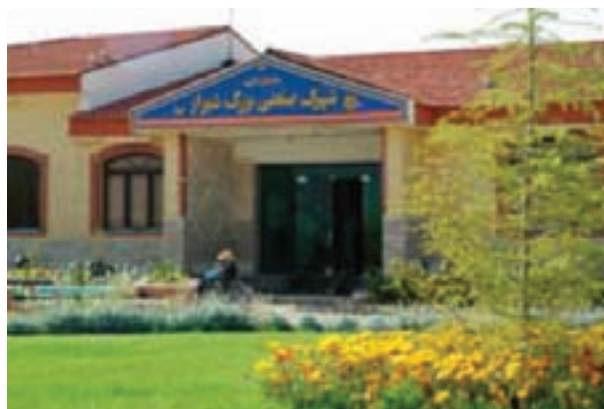
شکل ۳۵-۶- شهرک صنعتی

یکی از طرح‌هایی که پس از پیروزی انقلاب اسلامی به‌منظور گسترش و توسعه کارگاه‌های صنعتی در سطح استان اجرا شد تأسیس شهرک‌های صنعتی در اکثر شهرهای استان است. در حال حاضر ۲۲ شهرک صنعتی و ۱۱ ناحیه صنعتی در سطح استان توسط کارآفرینان و صنعتگران به‌وجود آمده است، که با سرمایه‌گذاری و تأسیس واحدهای صنعتی در آنها سهم عمده‌ای از اشتغال جوانان را برعهده داشته است.