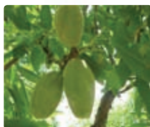
شکل ۶-۷ بادام (اول)