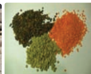
شکل ۶-۱۲ حبوبات آبی (اول)