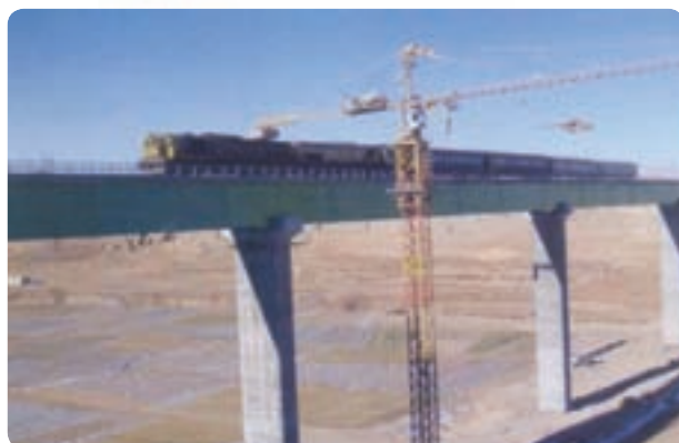
شکل ۴۴-۶ پل ایزده خواست