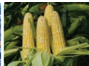
شکل ۶-۸ ذرت دانه‌ای (اول)