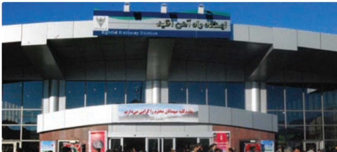
شکل ۲۸-۶- ایستگاه راه آهن اقلید

اگر بخواهیم پرافتخارترین طرح عمرانی استان فارس را در سال‌های اخیر نام ببریم، بی شک راه‌اندازی قطار شیراز - اصفهان است که کلیه مراحل مطالعه - برنامه‌ریزی و اجرای آن در زمان جمهوری اسلامی انجام شده است.