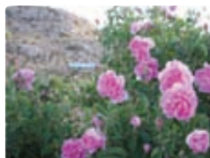
شکل ۶-۱۰ گل محمدی (اول)