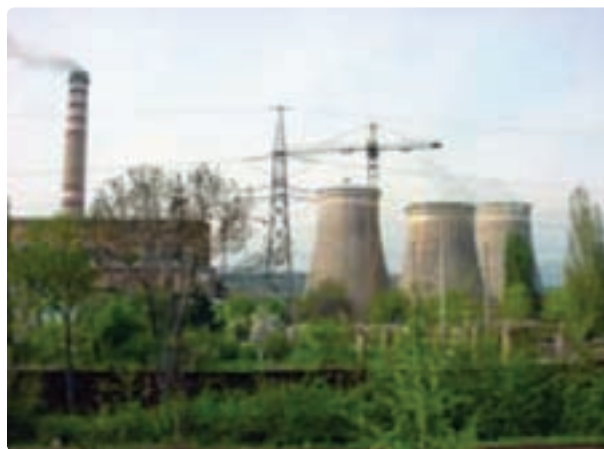
شکل ۳۳- سیکل ترکیبی