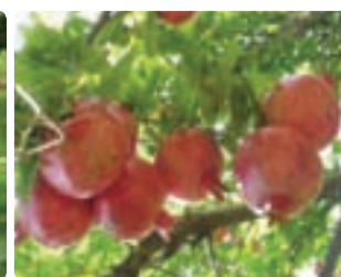
شکل ۶-۴ انار (اول)