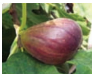
شکل ۶-۶ انجیر (اول)