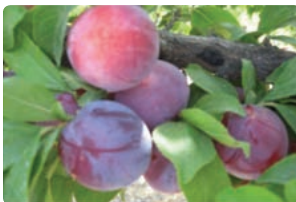
شکل ۴۳-۶ باغداری