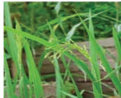
شکل ۶-۱۶ شلتوک (دوم)