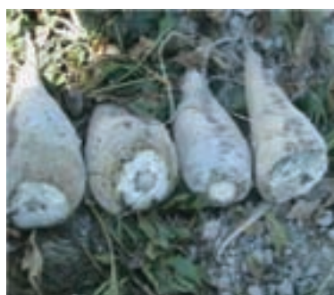
شکل ۶-۱۸ چغندر قند (سوم)