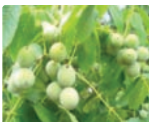
شکل ۶-۱۴ گردو (دوم)