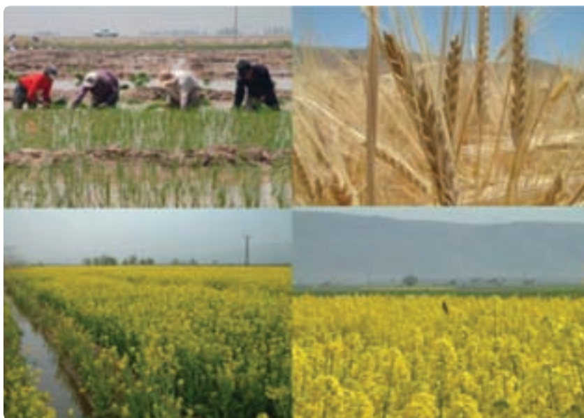
شکل ۲-۶- توسعه کشاورزی