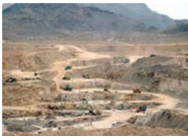
شکل ۳۱- کانی غیرفلزی