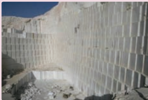
شکل ۳۷-۶- کانی غیرفلزی

در فصل گذشته با توانمندی‌های استان در زمینه معادن فلزی و غیرفلزی آشنا شدید. استان فارس از لحاظ تولید سنگ‌های تزئینی و خاک نسوز در کشور حائز رتبه اول است. این استان با داشتن ۲۸۴ معدن در رتبه ششم کشور قرار دارد.