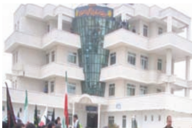
شکل ۲۷-۶- فرودگاه لار

براساس آمارهای موجود طول شبکه راه‌های اصلی استان که در سال ۱۳۵۷ برابر ۱۲۲۱ کیلومتر بوده که در سال ۱۳۸۶ به حدود ۲۲۲۹ کیلومتر افزایش یافته که ۵۶۹ کیلومتر آن بزرگراه است. تعداد فرودگاه‌های کشور نیز که پیش از انقلاب اسلامی تنها به فرودگاه شیراز محدود می‌شد، امروز به شش فرودگاه فعال افزایش یافته است. (آیا اسامی این فرودگاه‌ها را می‌دانید؟)