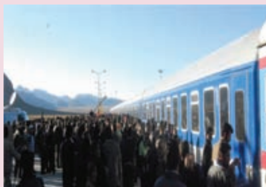
شکل ۴۵-۶ ایستگاه راه آهن