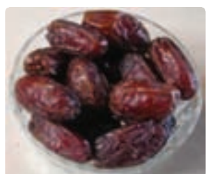
شکل ۶-۱۵ خرما (دوم)