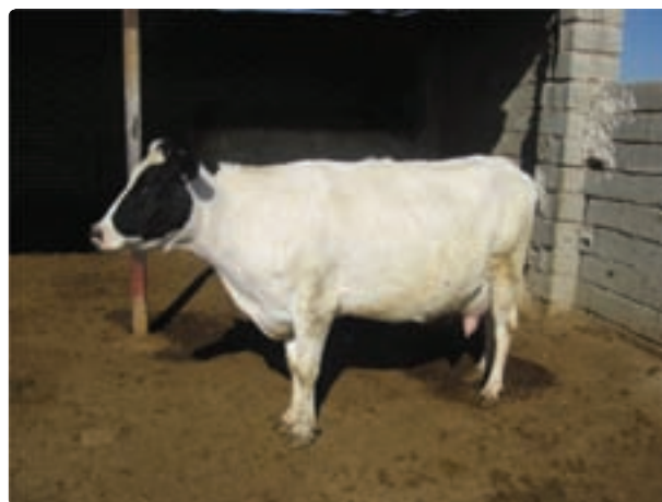
شکل ۱۹-۶- گاوداری صنعتی

علاوه بر فعالیتهای زراعی و باغی در زمینه دامپروری و تولیدات دامی و پرورش آبزیان و ماهیان پرورشی روستائیان و عشایر فارس توانسته اند سهم عمده ای از تولید گوشت قرمز و سفید کشور را به خود اختصاص دهند. جدول ۲-۶ بخشی از فعالیتهای دامپروری و تولیدات آن را در سال ۱۳۸۶ نشان می دهد.