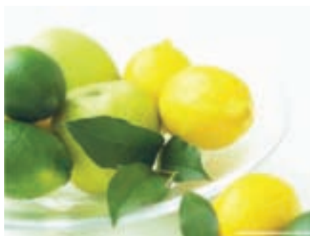
شکل ۶-۱۷ مرکبات (دوم)