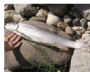
شکل ۶-۱۳ ماهی سرد آبی (اول)