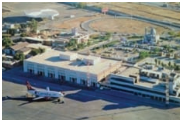
شکل ۹-۶- فرودگاه بین‌المللی اهواز