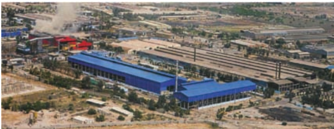
شکل ۲-۶- فولاد کویان - اهواز

چرا صادرات مشتقات پتروشیمی بر صادرات نفت خام اولویت دارد؟