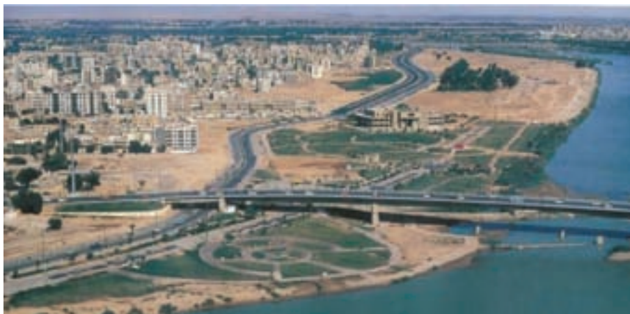
شکل ۱۰-۶- جاده ساحلی در حاشیه کارون - اهواز