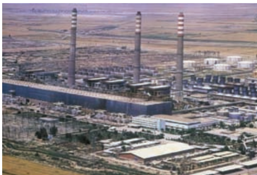
شکل ۵-۶- نمایی از توسعه نیروگاه حرارتی رامین اهواز