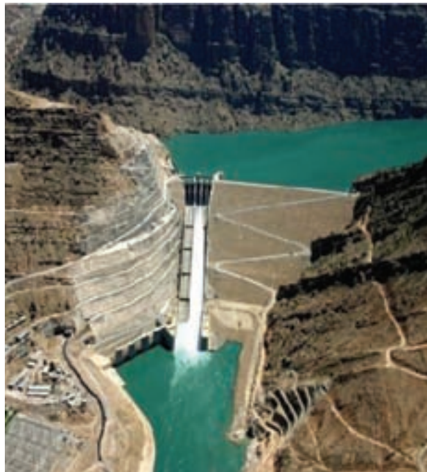
شکل ۳-۶- سد مسجد سلیمان (گدارلندر) بلندترین سد خاکی کشور

بیش از ۹۵ درصد ظرفیت نیروگاه‌های برق آبی کشور متعلق به خوزستان است و بدین ترتیب مقام اول کشور را در زمینه تولید برق به خود اختصاص می‌دهد. این استان به علت وجود سوخت‌های فسیلی، نیروگاه‌های حرارتی متعددی دارد که با توجه به صنایع متعدد، تراکم زیاد جمعیت و گرمی هوا، دومین مصرف‌کننده برق کشور محسوب می‌شود.