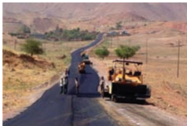
شکل ۸-۶- توسعه و احداث جاده‌های روستایی