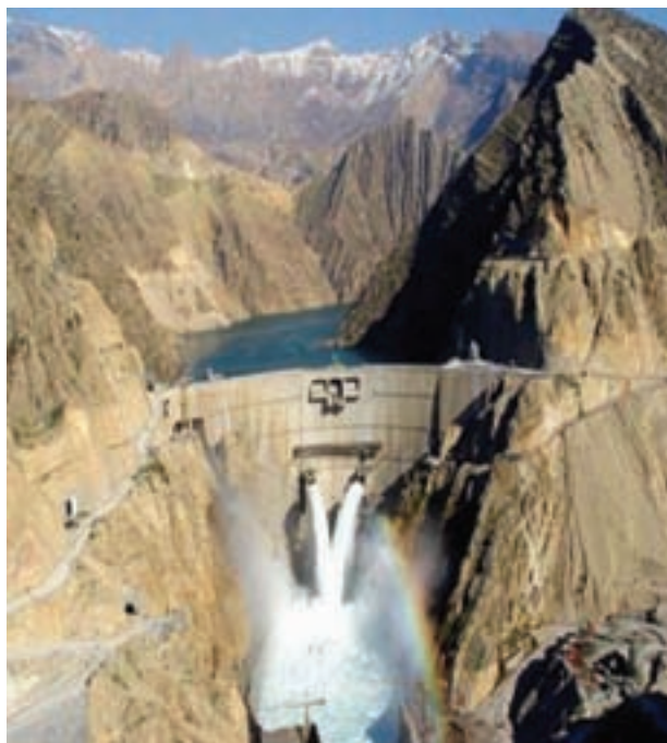
شکل ۴-۶- سد کارون ۳ بلندترین سد بتنی کشور

سایر طرح‌های در دست مطالعه مرتبط با بخش صنایع فلزی استان عبارت‌اند از: مجتمع ذوب و نورد خرمشهر، شرکت نورد و لوله کارون، فولاد شادگان و طرح فولاد اروند. در بخش تولید سیمان سه کارخانه با ظرفیت تولید ۸۳۰۰ تن در روز فعال‌اند. در زمینه آب و برق قبل از پیروزی انقلاب اسلامی تنها دو سد مخزنی دز و شهید عباسپور با مجموع ۶/۶ میلیارد متر مکعب آب وجود داشت، ولی امروزه تعداد این سدها به شش مورد و گنجایش حجم آنها به حدود ۱۸ میلیارد متر مکعب افزایش یافت. ۶ سد مخزنی در مرحله ساخت و ۱۸ سد در دست مطالعه است. کرخه بزرگترین سد خاکی خاورمیانه، کارون ۳ مرتفع‌ترین سد بتنی و سد مسجد سلیمان (گدارلندر) مرتفع‌ترین سد خاکی کشور در استان قرار دارند. این سدها علاوه بر تولید برق کشور نقش مهمی در تأمین آب زمین‌های کشاورزی پایین دست سدها دارند.