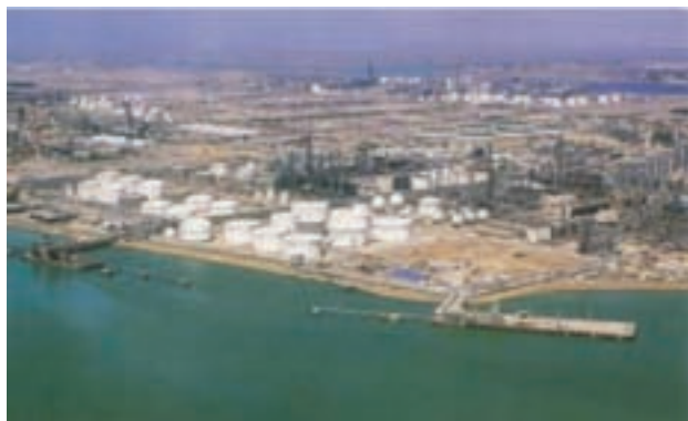
شکل ۱-۶- منطقه ویژه پتروشیمی ماهشهر