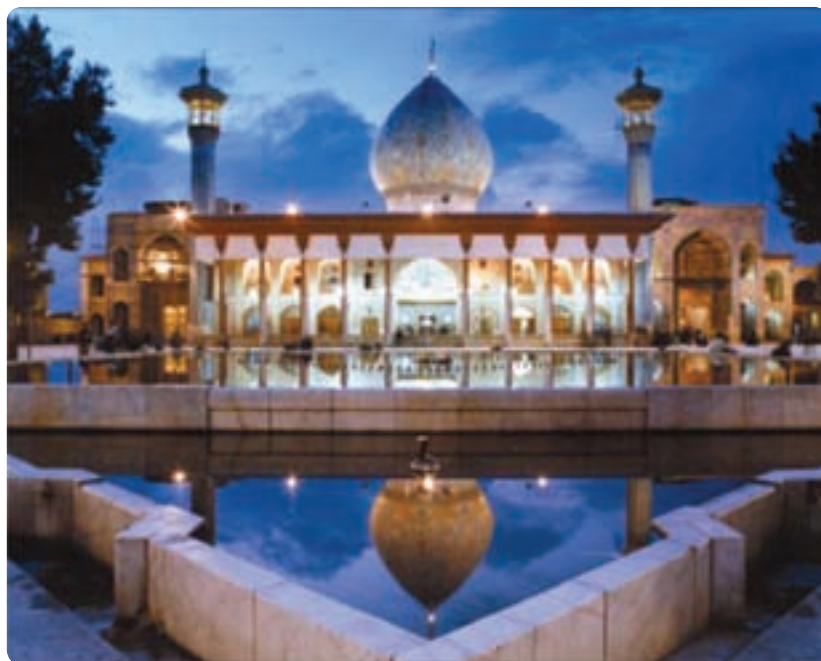
شکل ۴-۵- حرم متبرک حضرت احمدین موسی (ع) معروف به شاهچراغ- شیراز

جالب است بدانیم که از این سه اصل، اولین و مهم‌ترین عنصر را گردشگری به حساب آورده‌اند. استان فارس در این زمینه توانمندی‌های زیادی دارد. (با دو مورد دیگر در فصل‌های بعد آشنا می‌شوید)