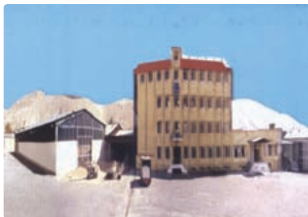
شکل ۴۰- کارخانه آرد، جهرم