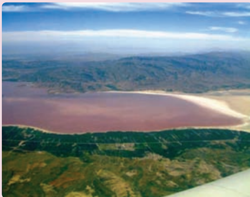
شکل ۱۸-۵- دریاچه بختگان - نیریز

— گردشگری طبیعی — علمی (ژئوتوریسم) : دشت ارژن در ۶۰ کیلومتری غرب شیراز یکی از زیباترین پدیده‌های زمین‌شناسی جهان به‌شمار می‌رود، به‌گونه‌ای که اغلب زمین‌شناسان جهان علاقه‌مند بازدید از این مکان هستند.