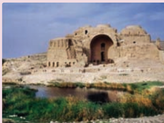
شکل ۲۲-۵- کاخ اردشیر - فیروز آباد