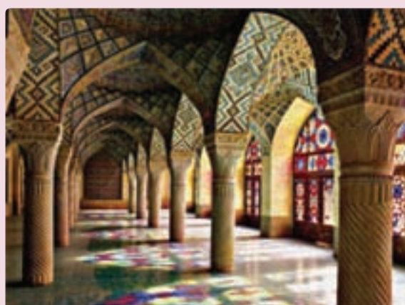
شکل ۲۱-۵- مسجد نصیرالملک - شیراز