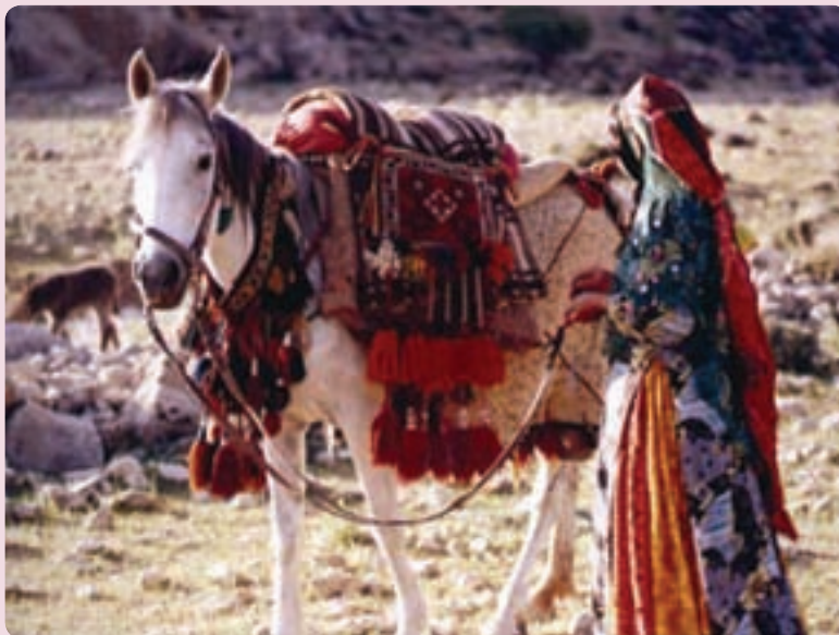
شکل ۱۷-۵- زندگی کوچ‌نشینی