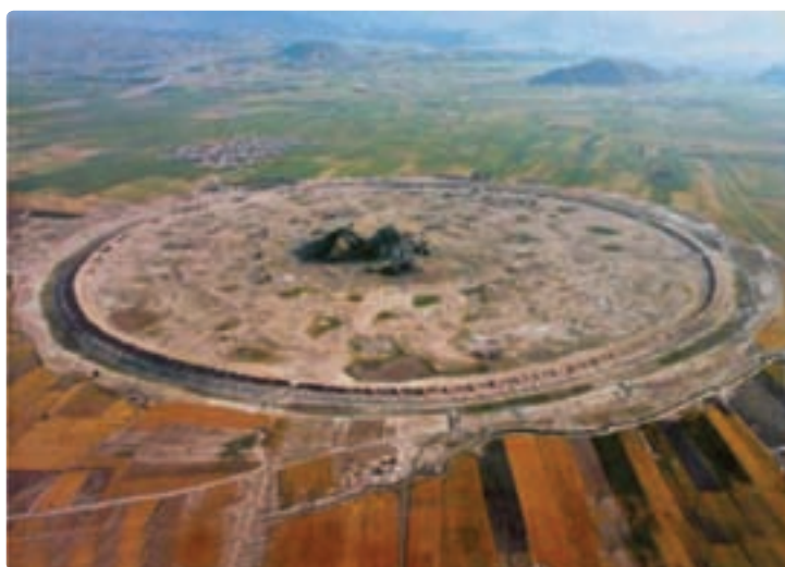
شکل ۱-۵- شهر دارابگرد- داراب

در اهمیت پارسیان و تمدنی که بر جای گذاشته‌اند، می‌توان گفت اولین حکومت مقتدر و امپراطوری ایرانی را در این مرز و بوم بر جای گذاشتند که آوازه آن در فرهنگ جهانی خودنمایی می‌کند. این استان پیشینه‌ای هم‌پایه تاریخ ایران دارد و همواره یکی از مراکز شکل‌گیری و شکوفایی تمدن‌های کهن ایران زمین به‌شمار می‌رود.