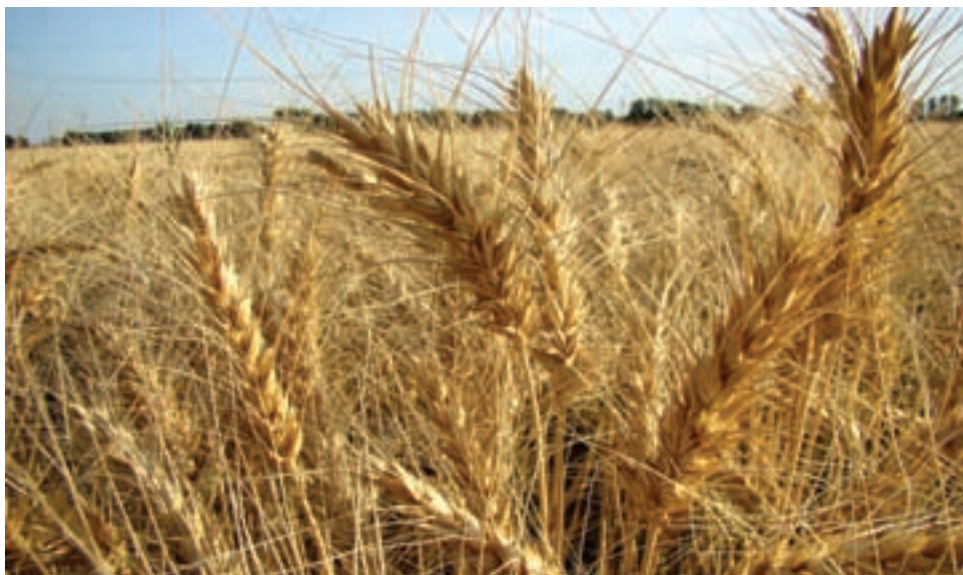
شکل ۳۶-۵ گندم، نماد کشاورزی در فارس