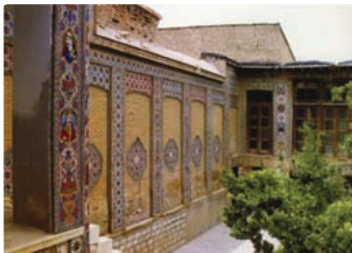
شکل ۱۳-۵- خانه ضیائیان شیراز

— جاذبه‌های تاریخی: همچون مجموعه‌های زندیه، مشیر و قوام در شیراز و فسا و داراب و خانه‌های قدیمی که به‌طور عمده از زمان قاجاریه در این استان به جای مانده‌اند و توسط سازمان میراث فرهنگی به ثبت رسیده‌اند و یا به موزه تبدیل شده‌اند؛ به عنوان نمونه، از خانه ضیائیان در محله سنگ سیاه و در مجاورت آرامگاه سیبویه می‌توان نام برد که مجموعه‌ای زیبا شامل پنجاه تصویر از بزرگان دینی و اجتماعی بر دیوارهای این خانه و بر روی کاشی‌های رنگی منقوش شده است.