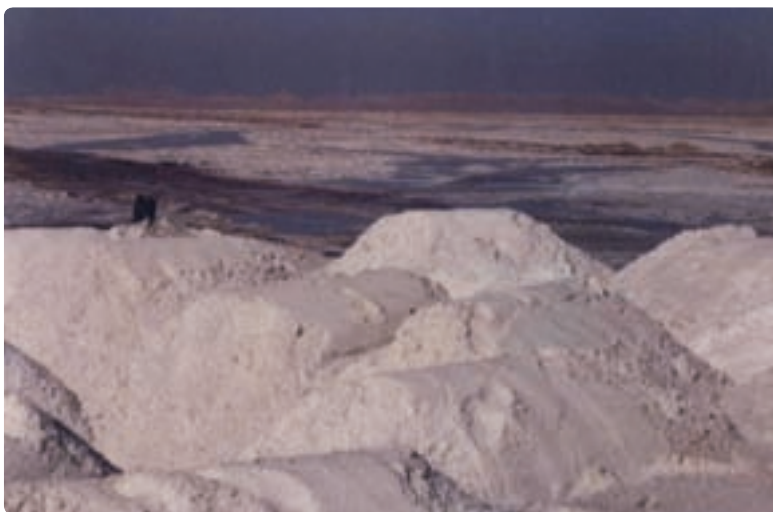
شکل ۳۷–۵ استخراج نمک صنعتی از دریاچه مهارلو، شیراز

۳– همچنین وضعیت اقلیمی استان، زمینه رونق پرورش زنبور عسل را فراهم آورده است.