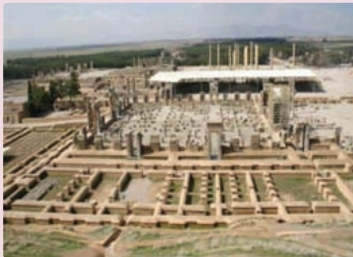
شکل ۵-۶- تخت جمشید مرو دشت

سال‌هاست که بر تارک سازمان ملل می‌درخشد.