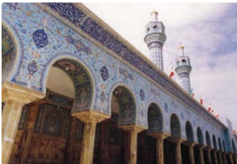
شکل ۹-۵- مسجد اعظم گراش

— هنرمندان و معماران این استان با ذوق و سلیقه خود آثاری را بر جای گذاشته‌اند که هر کدام در نوع خود بی نظیر و یا کم نظیر است و آوازه هنر این هنرمندان در خارج از مرزهای ایران هم شنیده می‌شود شما حتماً در مورد ساخت بنای تاج محل یکی از بناهای تاریخی مشهور هندوستان توسط یک معمار شیرازی شنیده‌اید.