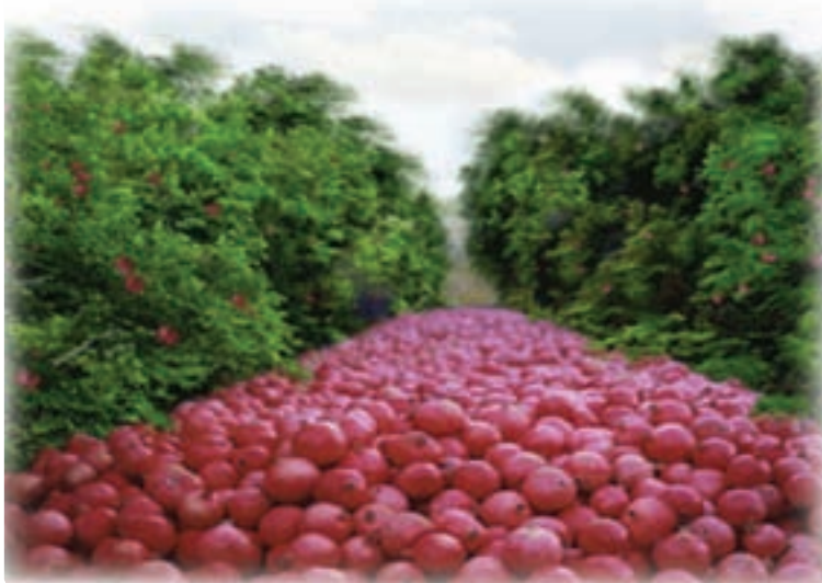
شکل ۳۵-۵ محصول انار در نیریز

بخش کشاورزی در این استان به‌گونه‌ای است که بعضی از فراورده‌ها جنبه صادراتی و ارزآوری به خود گرفته‌اند؛ همچون گندم و انار و مرکبات. تعدادی از محصولات کشاورزی استان در کشور، رتبه‌های اول تا سوم را به خود اختصاص داده‌اند، حتی تولید و صادرات انجیر فارس در جهان رتبه اول را به خود اختصاص داده است.