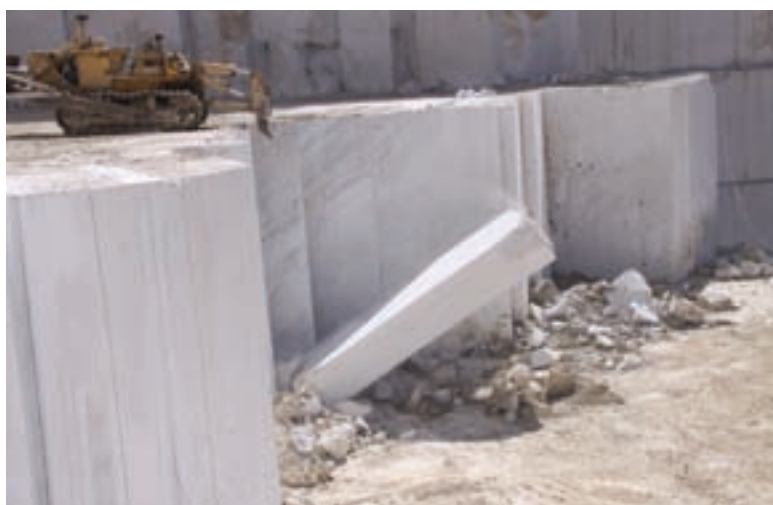
شکل ۳۸–۵ معدن سنگ در نیریز