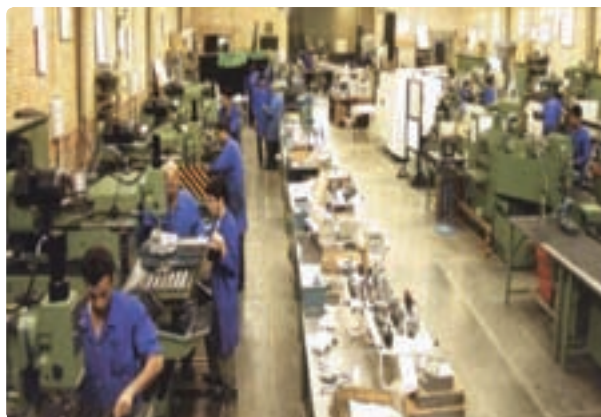
شکل ۳۹- کارخانه ابزارسازی در شیراز

به لحاظ چنین اهمیتی است که استان فارس به ایجاد و تقویت بنیان‌ها و زیربنای صنعتی و رشد این بخش پرداخته است. این زیربنایها عبارت‌اند از :