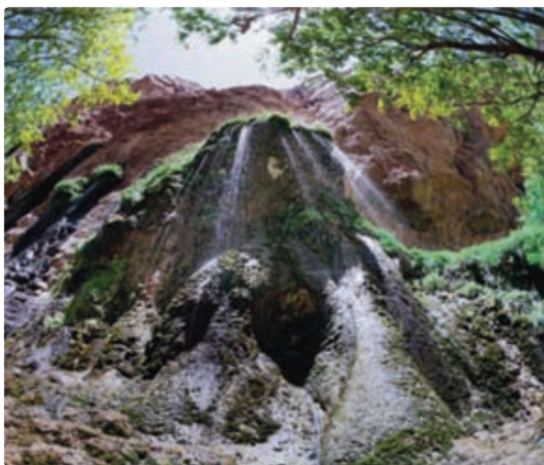
شکل ۱۱-۵- تنگ براق اقلید