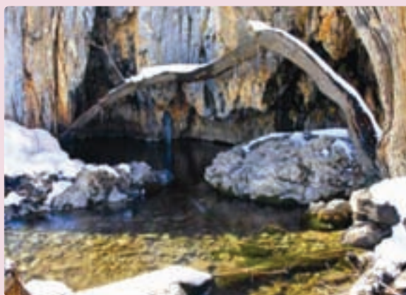
شکل ۱۹-۵- سرچشمه رودخانه شش پیر - سپیدان