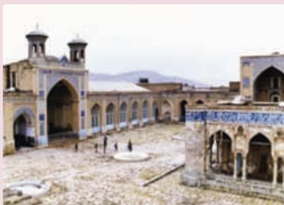
شکل ۲۰-۵- مسجد جامع عتیق - شیراز