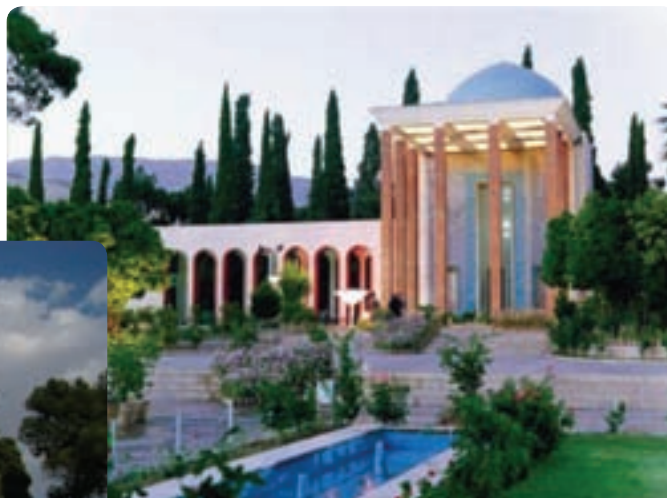
شکل ۱۵-۵- سعدیه - شیراز