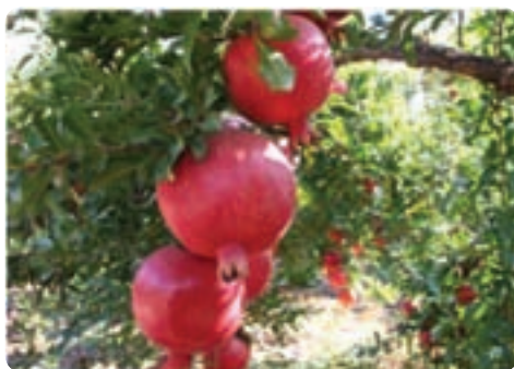
تولید انار - تفت - مهریز