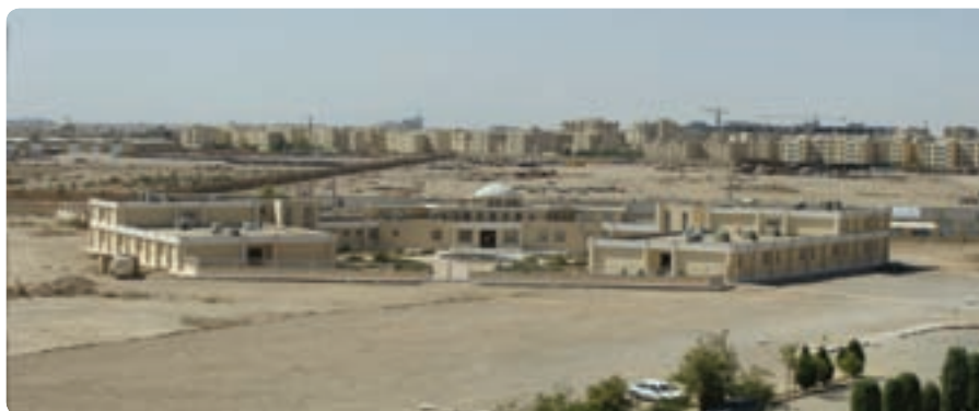
شکل ۲۲-۶- احداث درمانگاه تخصصی و فوق تخصصی بیمارستان شهید صدوقی

ایجاد مراکز مشاوره خدمات پیشگیری آسیب های اجتماعی و سلامت