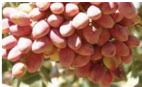
تولید پسته - اردکان