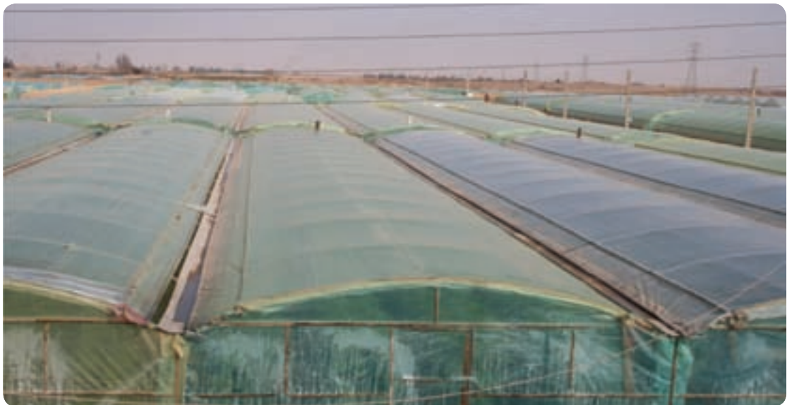
شکل ۱۸-۶- کشت گلخانه‌ای در مهریز