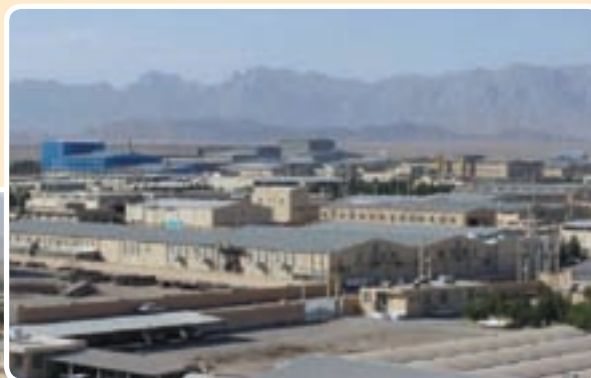
شکل ۴-۶- شهرک صنعتی خضرآباد یزد