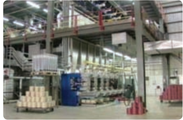
شکل ۸-۶- کابل‌های نوری شهید قندی در یزد