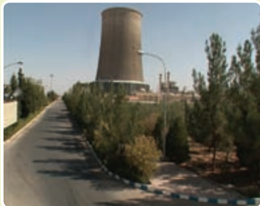
شکل ۱۰-۶- نیروگاه سیکل ترکیبی

۶- ثبت ۳۹ اختراع از سال ۱۳۸۴ تاکنون توسط واحدها و شرکت‌های مستقر در پارک یزد ۷- کسب ۷ مقام کشوری در حوزه رباتیک توسط تیم رباتیک پارک علم و فناوری یزد انرژی: بررسی شاخص‌های صنعت برق نشان می‌دهد، بیشترین سهم مصرف برق استان به ترتیب متعلق به بخش صنعت با ۵۷ درصد و بخش خانگی با ۱۸ درصد است.