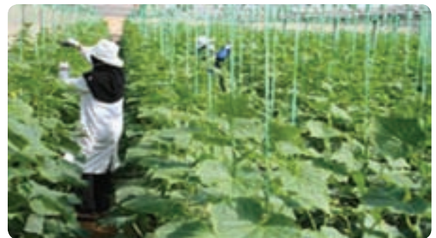
گلخانه تولید خیار