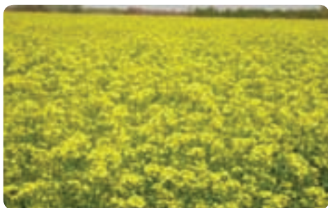
تولید کلزا - ابرکوه