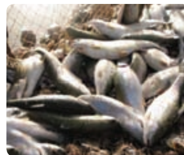
شکل ۱-۶- نمونه‌ای از تولیدات در زمینه کشاورزی استان یزد