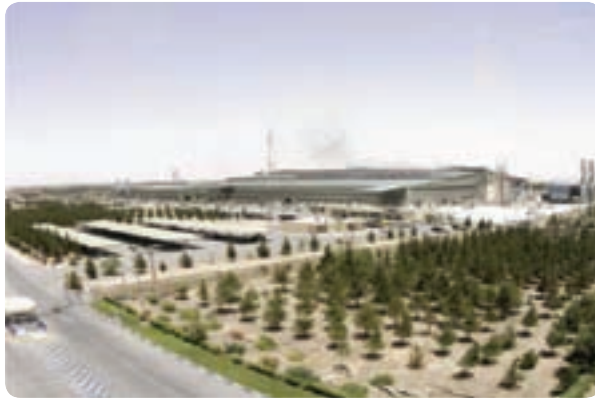
شکل ۹-۶- شرکت فولاد آلیاژی