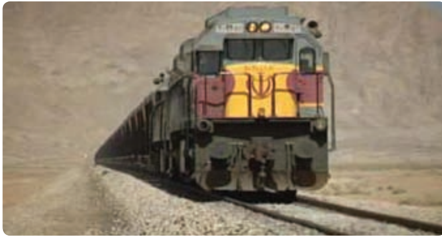
شکل ۲۱-۶- راه آهن استان

عمده ترین موارد چشم انداز استان در بخش حمل و نقل عبارت است از :