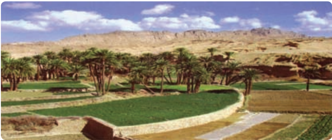
شکل ۱۷-۶- روستای از میغان طبس