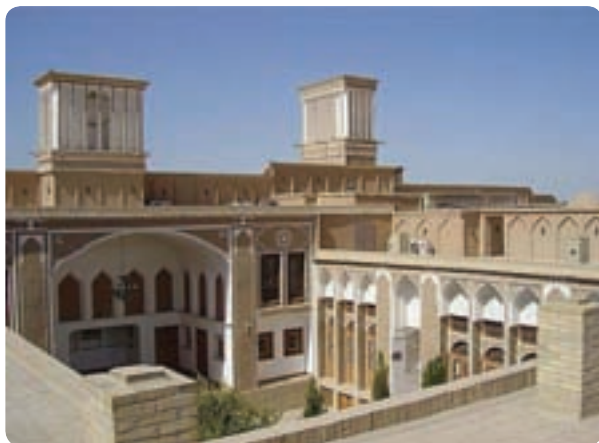
شکل ۲۰-۶ هتل به سبک سنتی در یزد

محورهای اصلی توسعه بخش بازرگانی احداث پایانه صادراتی و مرکز تجارت بین‌الملل استان احداث نمایشگاه بین‌المللی استان احداث مراکز و میادین عرضه میوه و تره‌بار ایجاد مرکز تخلیه و توزیع کالای کشور در استان ارتقای گمرک استان ایجاد بورس منطقه‌ای مصالح ساختمانی، کاشی و سرامیک محورهای اصلی توسعه بخش گردشگری تکمیل و بهره‌برداری از مناطق نمونه گردشگری در استان مرمت و بازسازی بناهای مهم تاریخی ایجاد شهرک و بازارچه صنایع دستی، طلا و جواهر ایجاد واحدهای اقامتی سنتی و پذیرایی در بافت قدیمی شهرها