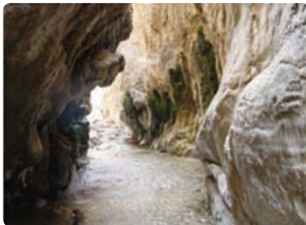
شکل ۱۹-۶ چشمه مرتضی علی طبس