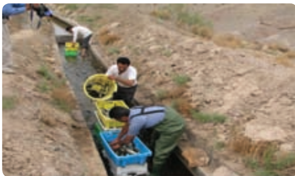
شکل ۲-۶- پرورش ماهی در مظهر قنات

توانمندی‌های شیلات : وجود آب‌های زیرزمینی شور و غیر قابل مصرف در امر کشاورزی، محیط‌های مناسب برای پرورش ماهی از قبیل استخرهای خاکی، استخرهای ذخیره آب کشاورزی و مظاهر قنات فراهم می‌کند. با توجه به شرایط فوق و وجود افراد علاقه‌مند در همه مناطق و شهرستان‌های استان، ماهی پرورش داده می‌شود.