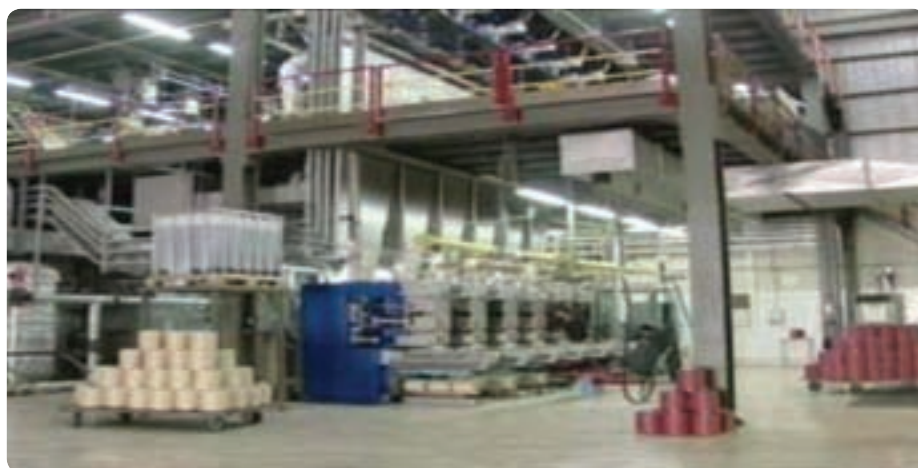
شکل ۱۵-۶- کارخانه کابل نوری یزد