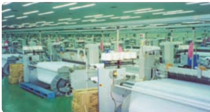
شکل ۶-۷ نمونه ای از صنایع نساجی استان

خوشه صنعتی نساجی استان یزد: از سال ۱۳۸۴ خوشه صنعتی نساجی یزد به عنوان یک خوشه ملی در زمینه نساجی شناسایی و تحت پشتیبانی سازمان توسعه صنعتی ملل متحد قرار گرفته است. تنوع محصولات صنعتی: در حال حاضر یزد متنوع ترین منسوجات را در کل ایران دارد. انواع تولیدات موجود را می توان به شکل زیر دسته بندی کرد: تولید انواع پارچه های مبلی (تولید بیش از ۸۰٪ سهم تولید رو مبلی در ایران) تولید انواع پارچه های پرده ای تولید انواع پارچه های پیراهنی، ملحفه ای، متقال و ... محصولات سنتی و بومی (روفرفشی، دستمال ابریشمی، چادر شب، انواع شال، روسری، ترمه و ...). به موارد فوق می توان محصولات نوین در حال ظهور دارای تکنولوژی بالا با ترکیبات نانو را افزود.