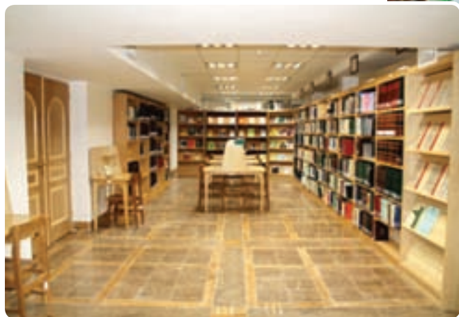
شکل ۱۳-۶- سالن کتابخانه وزیری یزد