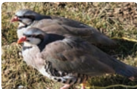
پرورش کبک - میبد