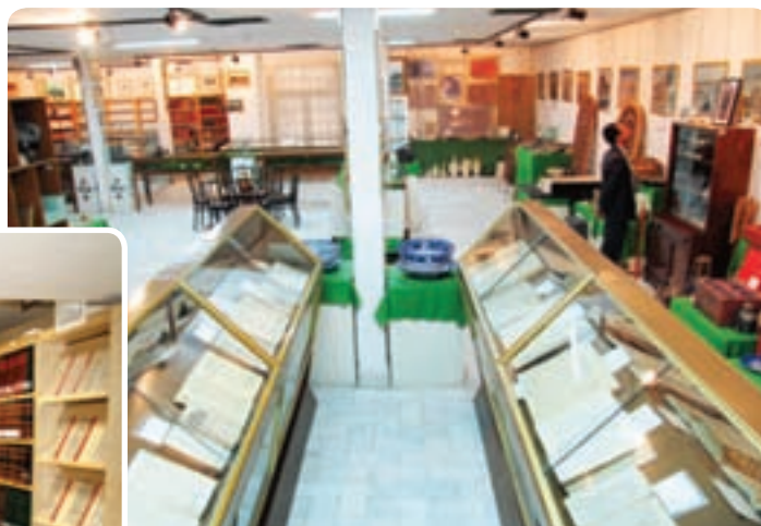
شکل ۱۲-۶- موزه کتابخانه وزیری یزد

فرهنگ و هنر: در سال‌های ۱۳۸۵-۱۳۵۷ تعداد کتابخانه‌های عمومی استان نزدیک به پنج برابر و تعداد کتاب‌های موجود در این کتابخانه بیش از ۹ برابر افزایش داشته است. تعداد سالن‌های سینما از سه سالن به پنج سالن افزایش یافته است. تعداد چاپخانه‌ها نیز چهار برابر و نشریات محلی از سه عنوان به ۶۲ عنوان رسیده است. توسعه و گسترش کانون‌های پرورش فکری کودکان و نوجوانان و کانون‌های فرهنگی و هنری از جمله دیگر فعالیت‌های فرهنگی انجام گرفته بعد از پیروزی انقلاب است. همزمان با گسترش شبکه‌های سراسری صدا و سیما شبکه استانی صدا و سیما نیز افتتاح گردیده است.