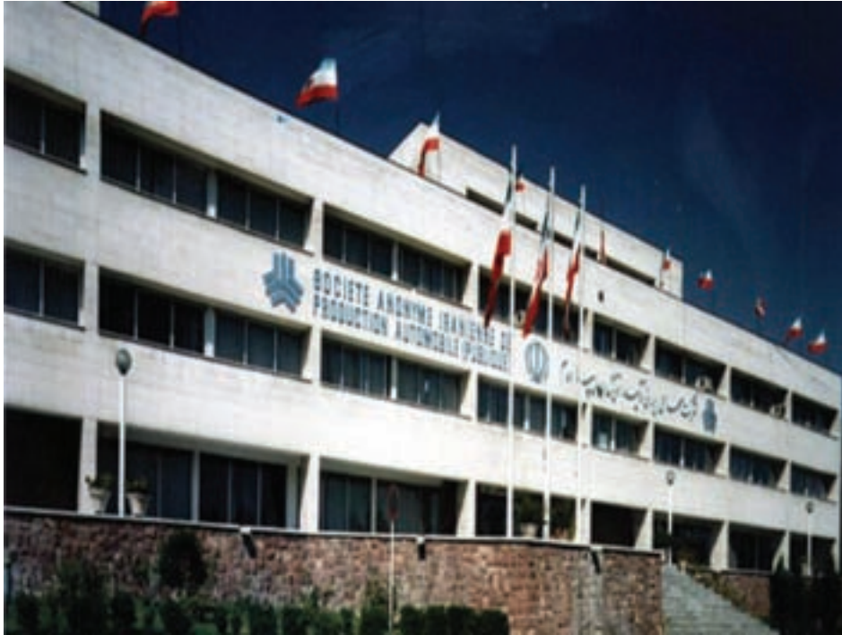
شکل ۲۵-۵- شرکت خودروسازی سایپا