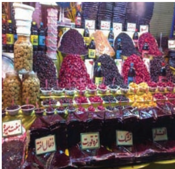
شکل ۲۸-۵- فروشگاه‌های در منطقه دربند