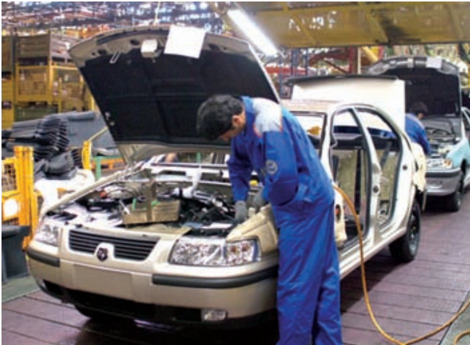
شکل ۲۶-۵- تولید اتومبیل در کارخانه ایران خودرو