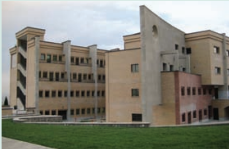
شکل ۶-۷- دانشگاه آزاد اسلامی واحد تهران

اماکن مذهبی در استان تهران براساس آمار سال ۱۳۸۶، به تعداد ۳۹۹ مکان متبرکه بوده است. در این استان، ۳۵۶۵ مسجد و ۶۰۱ حسینیه برای انجام فرایض دینی و مذهبی وجود دارد. همچنین، تعداد ۱۹ مکان مذهبی مربوط به اقلیت‌های مذهبی در شهر تهران وجود دارد.