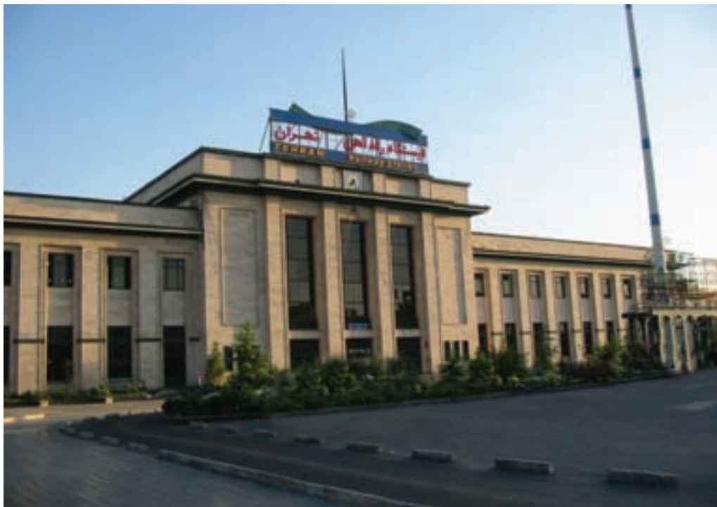
شکل ۲-۶- ایستگاه راه آهن تهران

آغاز به کار متروی تهران در سال ۱۳۷۸ نقطه عطفی در توسعه شبکه ریلی استان محسوب می شود که روزانه هزاران مسافر را جابه جا می کند.