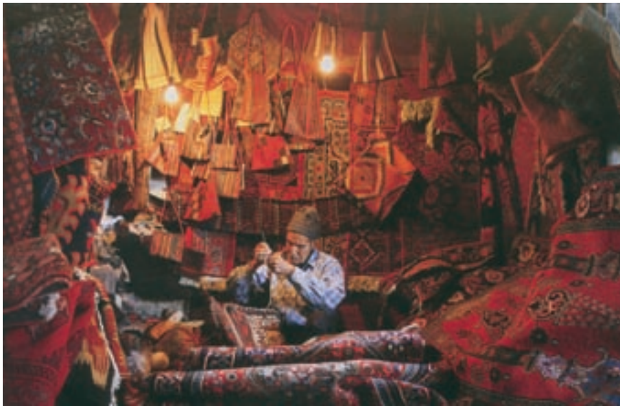
شکل ۲۷-۵- نمونه‌ای از بازار صنایع دستی تهران

۳- صنایع دستی عشایری: قدیمی‌ترین نوع صنایع دستی استان است که تولید آن عموماً به‌طور خانگی و فصلی انجام می‌پذیرد. این نوع از صنایع دستی، با توجه به ترکیب قومی منطقه، در میان صنایع دستی استان جایگاهی ویژه دارد و هم‌اکنون یکی از نقاط برجسته و مثبت صنایع دستی استان محسوب می‌شود. دست‌اندرکاران این بخش از دست‌ساخته‌های ایرانی که بافت انواع قالی و قالیچه، جاجیم و گلیم، چننه ۱ ، رویه پستی، جوال ۲ ، خورجین ۳ و نیز رنگرزی و ریسندگی پشم را در انحصار خود دارند، گروهی از عشایر لر، قشقایی، شاهسون و... هستند که در دهه‌های اخیر از زادگاه خود به تهران، ری، ورامین و کرج مهاجرت کرده‌اند.