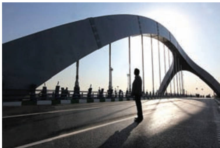
شکل ۳-۶- پل جوادیه

آغاز به کار متروی تهران در سال ۱۳۷۸ نقطه عطفی در توسعه شبکه ریلی استان محسوب می شود که روزانه هزاران مسافر را جابه جا می کند.