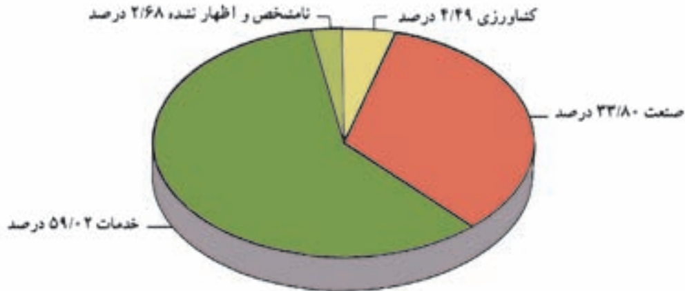
شکل ۲۰-۵. نمودار درصد شاغلان در بخش‌های مختلف اقتصادی استان

استان تهران یکی از قطب‌های اقتصادی کشور است. تجمع کانون‌های اقتصادی در این استان و موقعیت سیاسی و اداری و نیز مرکزیت آن باعث شده است که بخش عمده امکانات در محدوده آن متمرکز شود. نمودار زیر، شاغلان را در سه بخش کشاورزی، صنعت و خدمات در استان تهران نمایش می‌دهد.