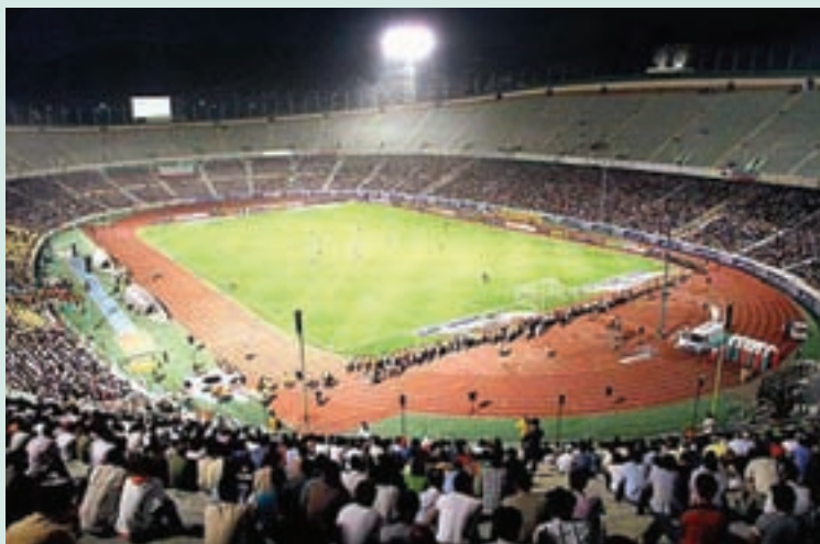
شکل ۶-۸- استادیوم آزادی تهران

استان تهران طی سی سال گذشته به خصوص از دهه ۱۳۷۰، شاهد رونق فعالیت‌های ورزشی بوده است. تعداد فضاهای ورزشی روباز و سرپوشیده استان از ۲۷۶ مورد در سال ۱۳۶۸ به ۲۷۶۸ مورد در سال ۱۳۸۷ رسیده است، اما به علت افزایش جمعیت، رشد سرانه فضای ورزشی برای هر نفر ۲۳/۰ در سال ۱۳۸۷ بوده است.