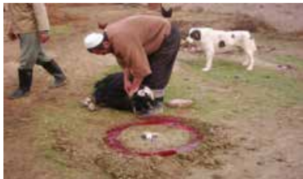
شکل ۳-۳- رسم قربانی کردن در جرجلان بجنورد

عید قربان : یکی از بزرگ‌ترین اعیاد مسلمانان و ترکمن‌ها عید قربان است که سه روز به طول می‌انجامد. روز اول را «کرگون» می‌گویند و به نظافت و خانه‌تکانی می‌پردازند. روز دوم را «قوقن» می‌نامند که به پخش شیرینی می‌پردازند. شب قبل از عید قربان حمام مخصوص می‌گیرند که به آن «قربان شورا» می‌گویند که هنگام استحمام اشعار خاصی را زمزمه می‌کنند. روز عید در نماز جماعت شرکت می‌کنند و پس از مراسم نماز قربانی می‌کنند. معمولاً ترکمن‌های ازدواج کرده فراخور حال خود گوسفند، گاو و یا به طور اشتراکی گاوی را قربانی می‌کنند.