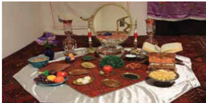
شکل ۱-۳- سفره هفت‌سین

شب چله (یلدا): یلدا به معنای ولادت خورشید است. ایرانیان قدیم بر این باور بودند که در شب یلدا تسلط تاریکی بر زمین بیشتر است و چون فردای آن شب، روشنایی بر ظلمت غالب و روز طولانی‌تری می‌شود، پس تولد دوباره خورشید را که مظهر روشنایی است جشن می‌گرفتند. در این شب افراد خانوار دور هم جمع می‌شوند، کوچک‌ترها به دیدن بزرگ‌ترها می‌روند. گفت و شنود خانوادگی، بازگویی خاطرات و قصه‌گویی پدر بزرگ‌ها و مادر بزرگ‌ها از مواردی هستند که یلدا را برای خانواده‌ها دلپذیرتر می‌کند. هندوانه به عنوان نمادی کروی که بروش سبز و دروش قرمز و سبیل خورشید است، مهم‌ترین میوه بر سر سفره چله است. علاوه بر این، خوردن میوه‌هایی مانند انار سرخ، سیب سرخ، انگور و بیان قصه‌هایی از رستم و سهراب و خواندن اشعار زیبا و دلنشین از رسوم این شب محسوب می‌شود. همچنین در این شب خانواده داماد هدایایی را به رسم شب چلگی برای نوعروس پیشکش می‌برند.