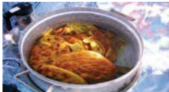
شکل ۱۱-۳- غذای محلی فتیر مسکه

غذا : در غذاهای محلی استان حیوانات زیادی مصرف می‌شود. تعدادی از غذاهای محلی استان عبارتند از اُجز، کاجی، سِمْ، سِمْه، فُروتو، زیره تُو، کِشِته تُو، آش بَلکه، آش یارمه، آش رَشته، آش مَسْتووه، شوْلَه ماش، هُولوه شوروه، قابلی، دیمه دَنی، سِقرَدَنی، قلیه آش و آب مُجی (عدسی). از نان‌های محلی می‌توان به قَتَلَمَه، کوماچ، سیتله فتیر، چوزمه، چریش و جزلاغ نان، فتیر مسکه و قُتاب و از ماست‌های محلی می‌توان به سوزمه، کمه (خورش)، دوراق و چکیده اشاره کرد. بازی‌ها : در بین بازی‌های محلی می‌توان به هفت سنگ، چلی آقاج، اُستا زنجیر باف، گرگم بهوا، تریس، لَپر، پادشاه - وزیر و کچه کچه (گل بازی) اشاره نمود.