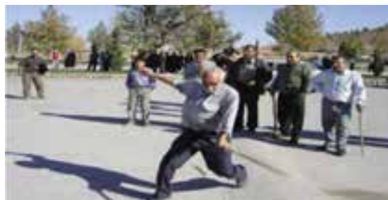
شکل ۱۲-۳- بازی محلی چلی آقاج