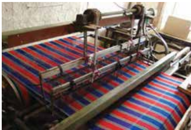
شکل ۱۴-۳- چادرشب بافی در روستای روئین