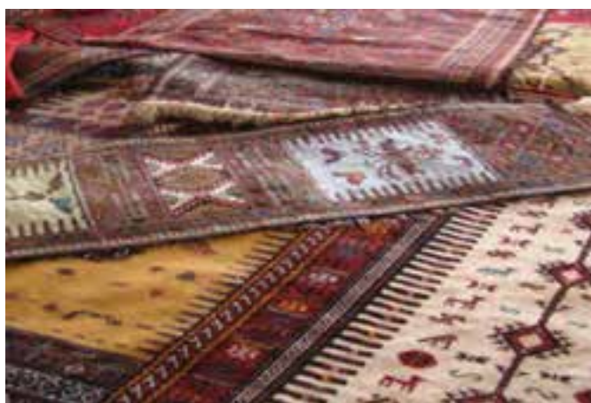
شکل ۱۳-۳- جاجیم و سفره کردی

در بین هنرها و صنایع دستی استان، بافته‌های داری مانند فرش، قالیچه و پستی ترکمنی به دلیل نقوش بسیار زیبا، تنوع رنگ، شکل هندسی و شکستگی خطوط، اصالت طرح و کیفیت مناسب از جایگاه ویژه‌ای در سطح ملی و بین‌المللی برخوردارند.