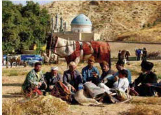
شکل ۳-۶- مراسم اسپدوانی در بوستان بش قارداش بجنورد