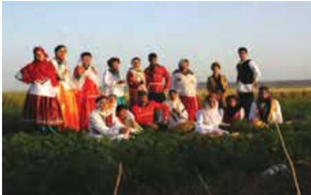
شکل ۱۰-۳- پوشش قوم تات در استان