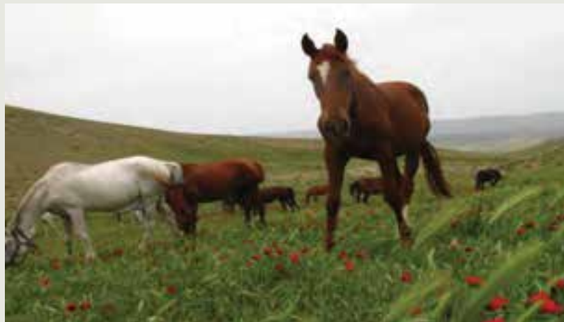
شکل ۳-۷- نژاد اسب اصیل ترکمن

اندام‌های حرکتی بلند و قوی، ران کشیده، سر عمود، سینه عمیق، نداشتن چربی اضافی، سرعت فوق العاده، استقامت مثال زدنی در شرایط سخت بیابانی، هوش و ذکاوت بالا از مشخصات با ارزش نژاد اسب ترکمن است. در سپاه داریوش هخامنشی سی هزار اسب ترکمن موجود بوده است. استان خراسان شمالی دارای بیش از ۱۰۰۰ رأس اسب اصیل ترکمن می‌باشد که بیش از نیمی از آنها دارای شناسنامه ژنتیکی می‌باشند و می‌تواند به عنوان یکی از استان‌های صادر کننده اسب مطرح باشد.