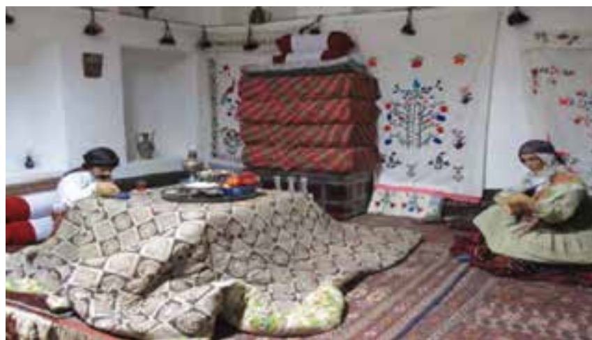
شکل ۲-۳- نمایی از مراسم شب یلدا

شب چله (یلدا): یلدا به معنای ولادت خورشید است. ایرانیان قدیم بر این باور بودند که در شب یلدا تسلط تاریکی بر زمین بیشتر است و چون فردای آن شب، روشنایی بر ظلمت غالب و روز طولانی‌تری می‌شود، پس تولد دوباره خورشید را که مظهر روشنایی است جشن می‌گرفتند. در این شب افراد خانوار دور هم جمع می‌شوند، کوچک‌ترها به دیدن بزرگ‌ترها می‌روند. گفت و شنود خانوادگی، بازگویی خاطرات و قصه‌گویی پدر بزرگ‌ها و مادر بزرگ‌ها از مواردی هستند که یلدا را برای خانواده‌ها دلپذیرتر می‌کند. هندوانه به عنوان نمادی کروی که بروش سبز و دروش قرمز و سبیل خورشید است، مهم‌ترین میوه بر سر سفره چله است. علاوه بر این، خوردن میوه‌هایی مانند انار سرخ، سیب سرخ، انگور و بیان قصه‌هایی از رستم و سهراب و خواندن اشعار زیبا و دلنشین از رسوم این شب محسوب می‌شود. همچنین در این شب خانواده داماد هدایایی را به رسم شب چلگی برای نوعروس پیشکش می‌برند.