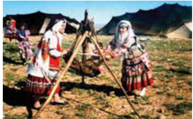
شکل ۹-۳- لباس زنان کرد شادلو و قراچولو

غذا : در غذاهای محلی استان حیوانات زیادی مصرف می‌شود. تعدادی از غذاهای محلی استان عبارتند از اُجز، کاجی، سِمْ، سِمْه، فُروتو، زیره تُو، کِشِته تُو، آش بَلکه، آش یارمه، آش رَشته، آش مَسْتووه، شوْلَه ماش، هُولوه شوروه، قابلی، دیمه دَنی، سِقرَدَنی، قلیه آش و آب مُجی (عدسی). از نان‌های محلی می‌توان به قَتَلَمَه، کوماچ، سیتله فتیر، چوزمه، چریش و جزلاغ نان، فتیر مسکه و قُتاب و از ماست‌های محلی می‌توان به سوزمه، کمه (خورش)، دوراق و چکیده اشاره کرد. بازی‌ها : در بین بازی‌های محلی می‌توان به هفت سنگ، چلی آقاج، اُستا زنجیر باف، گرگم بهوا، تریس، لَپر، پادشاه - وزیر و کچه کچه (گل بازی) اشاره نمود.