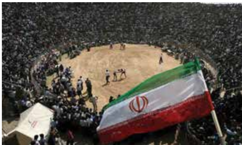
شکل ۳-۵- مراسم کشتی باچوخه در گود زینل خان اسفراین

کشتی باچوخه: این ورزش در استان پیشینه‌ای ۲۵۰۰ ساله دارد. علاقه مردم استان به ورزش پهلوانی کشتی باچوخه را می‌توان در زندگی قرون گذشته آنها مورد بررسی قرار داد. حکومت‌های ملوک‌الطوایفی ساکن در این خطه متکی بر قدرت ایلات و عشایر بود و بقای هر ایل متکی به قدرت جوانان و پهلوانان بود. در جشن‌ها، اعیاد مذهبی و ملی مانند عید فطر، عید نوروز و عروسی‌ها یکی از مراسم اصلی و مهم جشن، برگزاری کشتی باچوخه است.