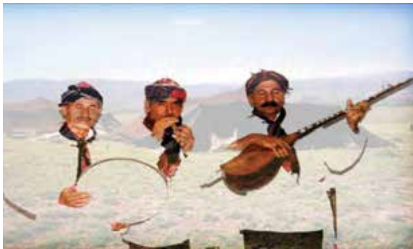
شکل ۸-۳- بخشی‌های کرمانج