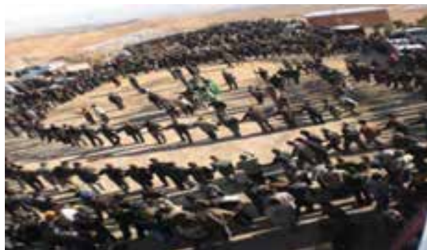
شکل ۳-۴- مراسم عزاداری امام حسین (ع) در استان

مراسم عزاداری در محرم و صفر : در دهه اول محرم در اکثر تکایا و حسینیه‌ها با حلیم اطعام می‌کنند و غذای فقیر و غنی در این ماه یکسان می‌باشد. انجام مراسم سوگواری سید الشهداء (ع) به قدری حائز اهمیت است که آن را به صورت دینی بر گردن خود می‌دانند و خود را ملزم به برپایی این آیین در نهایت شکوه و عظمت می‌دانند. هیئت‌های زنجیرزنی و سینه‌زنی با نظم و ترتیب در صفوف فشرده با شرکت همه اقشار مردم در سنین مختلف به گردش در می‌آیند. در شب اربعین اکثر هیئت‌ها مراسم اطعام و پذیرایی دارند. پرچم سیاه به علامت عزاداری سالار شهیدان در تمام مدت ماه محرم و صفر بر بالای بام تکایا، حسینیه‌ها و مساجد در اهتزاز است. شیعیان این خطه با پوشیدن لباس سیاه در ایام ماه‌های محرم و صفر ابراز سوگواری می‌نمایند و از انجام هر نوع مراسم شادی، حنا بستن و استفاده از زیورآلات به شدت می‌پرهیزند. در روزهای ۲۶، ۲۷ و ۲۸ ماه صفر جهت عزاداری رحلت پیامبر (ص)، امام حسن مجتبی (ع) و امام رضا (ع) هیئت‌های مختلف طی برنامه‌ریزی دقیق عازم مشهد می‌شوند.