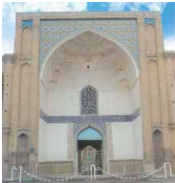
شکل ۳-۴- سردر عالی قابو از بناهای دوران صفویه

ورود سپاهیان مغول به ایران موجب ویرانی‌های بسیاری شد. با ورود آنان به شهر قزوین مردم شهر، تا سه روز با رشادت و شجاعت در مقابل مغولان مقاومت کردند، اما در نهایت سپاه مهاجم وارد شهر شد و خسارات فراوانی بر آن وارد کرد. پس از پایان حکومت مغولان و نبود حکومت قوی، صفویان توانستند دولتی نیرومند در ایران تأسیس نمایند و ثبات و نظم را به کشور بازگردانند. در زمان شاه تهماسب اول (۹۸۴-۹۳۰ ه.ق) قزوین به‌عنوان پایتخت ایران برگزیده شد و این موجب رونق و توسعه شهر گردید و واحدهای تجارتی جدیدی چون: کاروانسراها، بازارها و قیصریه‌ها در آن بنا شد. کالاها از نواحی مختلف به سوی آن سرازیر شد و راه‌های تجارتی توسعه و رونق یافت.