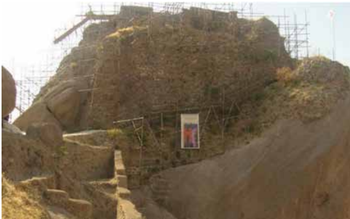
شکل ۲-۴- قلعه حسن صباح الموت، در حال مرمت