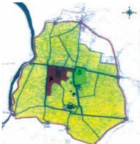
شکل ۴-۴- شهر قزوین در دوره قاجاریه

هـ. ق) پس از پیروزی بر افغان‌ها عازم قزوین شد. او به هنگام اقامت در قزوین تاجی را که بزرگان محلی در اختیارش نهاده بودند به سر نهاد و در داخل ارگ قزوین کوشکی بنا نهاد و تالاری برای پذیرایی پی افکند که به نام تالار نادری معروف شد. با مرگ نادر و درهم ریختگی اوضاع کشور، کریم خان زند (۱۱۹۳-۱۱۶۳ هـ. ق) بر تخت پادشاهی ایران نشست. قزوین در این دوره جزئی از حاکمیت این سلسله به‌شمار می‌رفت. با تأسیس سلسله قاجاریه، قزوین توسط حکام منصوب دربار قاجار یا نمایان آنان که بیشتر از شاهزادگان و وابستگان دربار بودند اداره می‌شد.