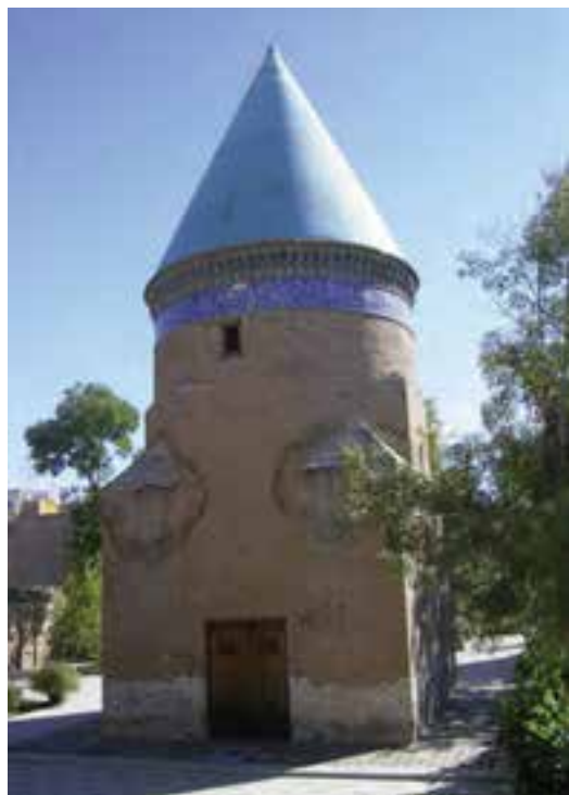
شکل ۶-۴- آرامگاه حمدالله مستوفی

حمدالله مستوفی : او نویسنده و مورخ و جغرافیدان معروف سده هشتم (تولد ۶۸۰هـ. و وفات ۷۵۰هـ.ق) و مؤلف تاریخ گزیده تزه القلوب و ظفرنامه، در دوره ایلخانان مغول می‌باشد. مستوفی در کارهای دیوانی و محاسباتی سرآمد بود. مزار او در محله ملک‌آباد قزوین واقع است.