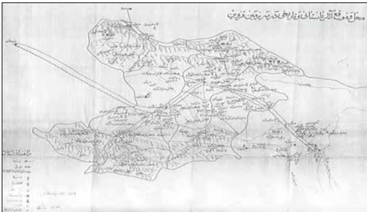
شکل ۱-۴- محل و موقع آثار باستانی و تاریخی در سرزمین قزوین