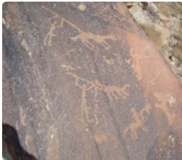
شکل ۱-۴- نقش سنگ نگاره‌های کوه ارنان

قبرهای خورشیدی در ارتفاعات کوه‌های بوهروک و نواحی جنوب غربی یزد که مربوط به دوران خورشید پرستی است و مربوط به سه تا شش هزار سال پیش است، نمونه‌های دیگری است. زراعت و مدنیت یزد، از مناطق مهریز و فهرج، یزد، رستاق، میبد، اردکان و ابرکوه شروع شد اما کشاورزی در مهریز، فهرج و یزد در ابتدا وابسته به آب‌های سطحی ولی بعداً به دلیل کمبود ریزش‌های جوی و در کنار آن گرم شدن هوا مانند دیگر مناطق وابسته به آب‌های زیرزمینی، قنات (کاریز) شد.