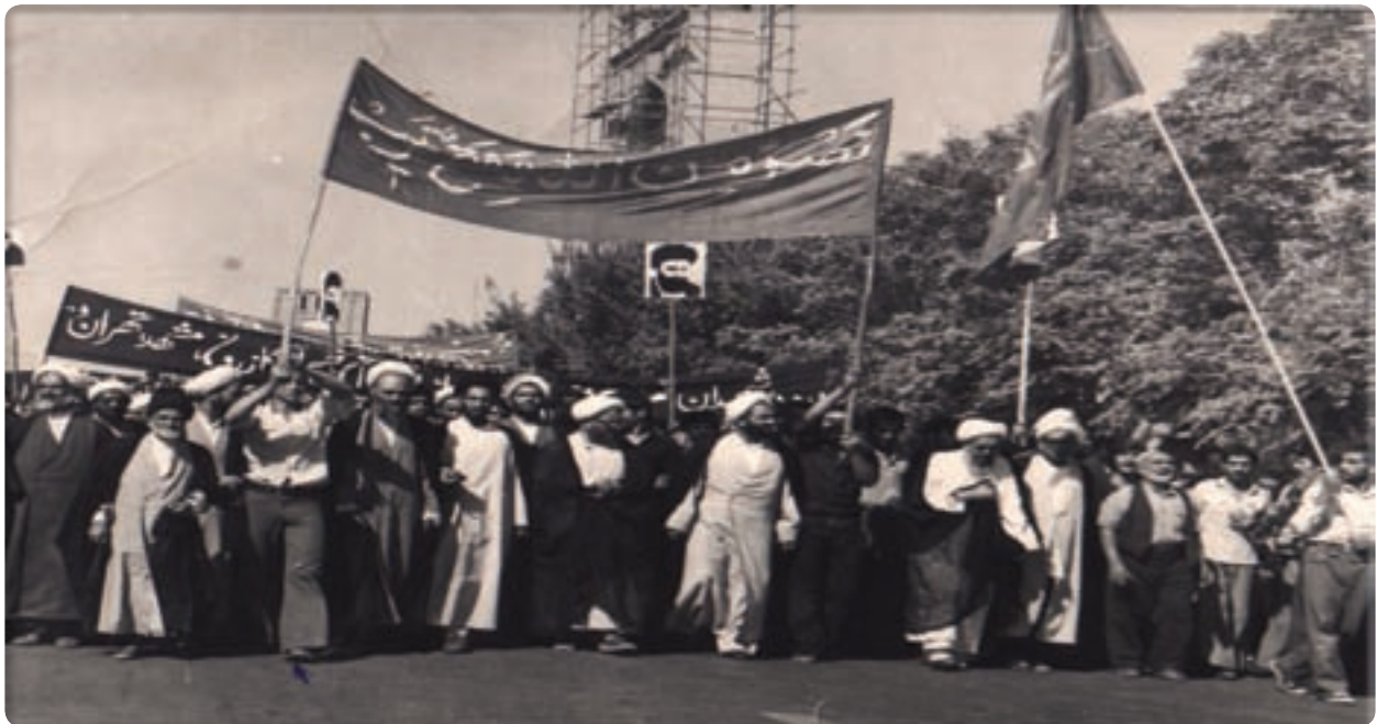
شکل ۳-۴- راهپیمایی مردم یزد علیه حکومت پهلوی به رهبری آیت الله شهید صدوقی