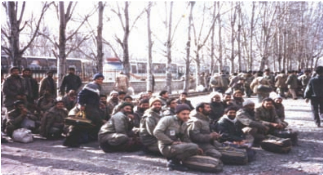
شکل ۴-۴- اعزام رزمندگان اسلام به جبهه‌های نبرد حق علیه باطل