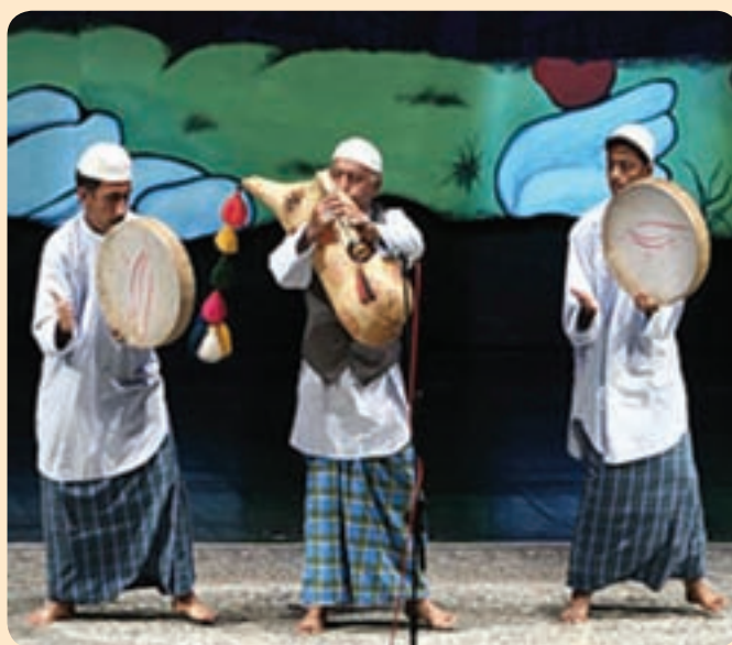
شکل ۱۶-۳- اجرای ساز نی امبان

البته موسیقی استان متقابلاً بر موسیقی ملی ایران تأثیر گذار بوده است، از جمله در ردیف موسیقی سنتی ایران، بسیاری از گوشه‌های آواز دشتی در ردیف سنتی متأثر از شروه و آوازهای رایج در منطقه دشتی، دشتستان و تنگستان ... است.