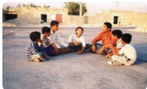
شکل ۱۳-۳ نمونه‌هایی از بازی‌های محلی در استان بوشهر