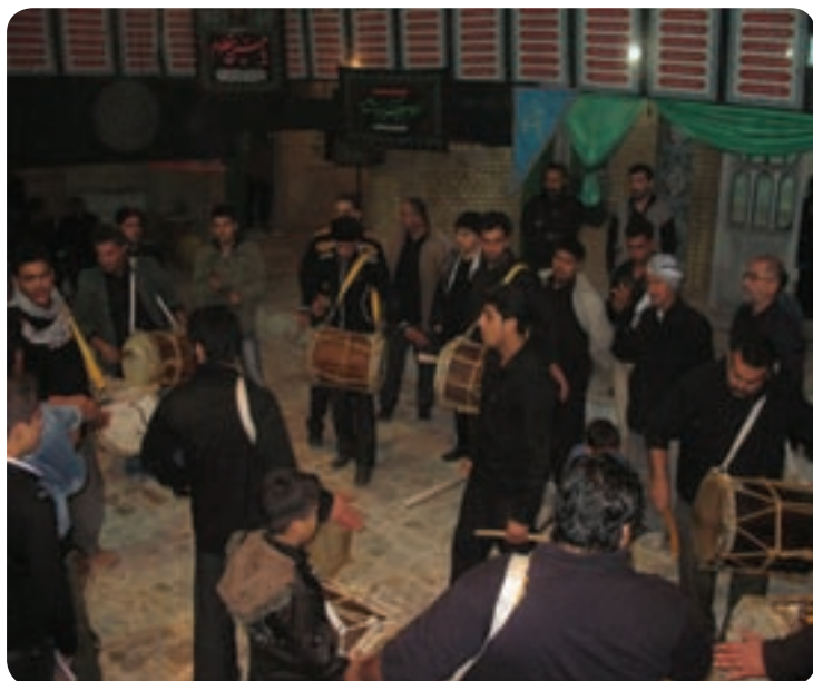
شکل ۳-۹- مراسم دمام زنی

جشن ها و آیین های استان بوشهر به جشن های مذهبی و ملی تقسیم می شوند. جشن های بزرگ مذهبی شامل جشن میلاد حضرت محمد (ص)، میلاد حضرت علی (ع)، میلاد حضرت امام زمان (عج)، عید فطر، عید قربان از جمله اعیاد مذهبی هستند که باشکوه خاصی برگزار می شوند. مراسم عید نوروز به عنوان جشن ملی مانند دیگر استان های کشور در استان بوشهر اجرا می شود. مراسم سنج و دمام زنی: استفاده از سنج، دمام و بوق که هم زمان در مراسم عزاداری نواخته می شود، ابتدا برای خبر کردن از آن استفاده می شد که بعدها جزئی از مراسم عزاداری شده است.