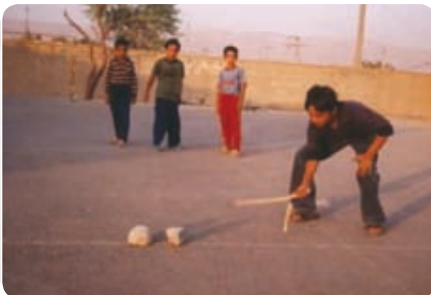
شکل ۱۵-۳ بازی چوکیلی