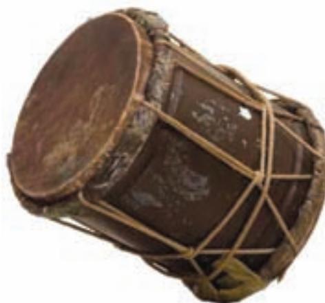
شکل ۳-۸- دمام

مراسم سینه زنی: این مراسم مذهبی با نوحه خوانی شخصی که به عنوان پیش خوان یا سرخوان شناخته شده آغاز می شود. در ابتدای مراسم، نوجوانان، جوانان و دست اندرکاران مسجد، گرد پیش خوان حلقه ای دایره ای شکل تشکیل می دهند که به آن «بر» (Bor) می گویند. سینه زنی در تعزیت پیشوایان دینی و مذهبی در شهرها و روستاهای استان برگزار می شود.