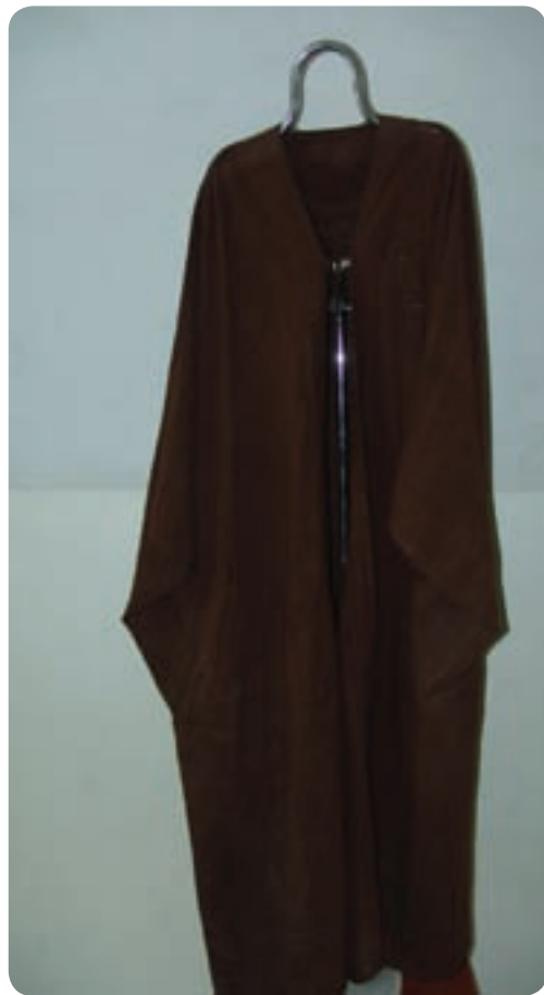
شکل ۳-۴. چند نمونه از صنایع دستی استان بوشهر