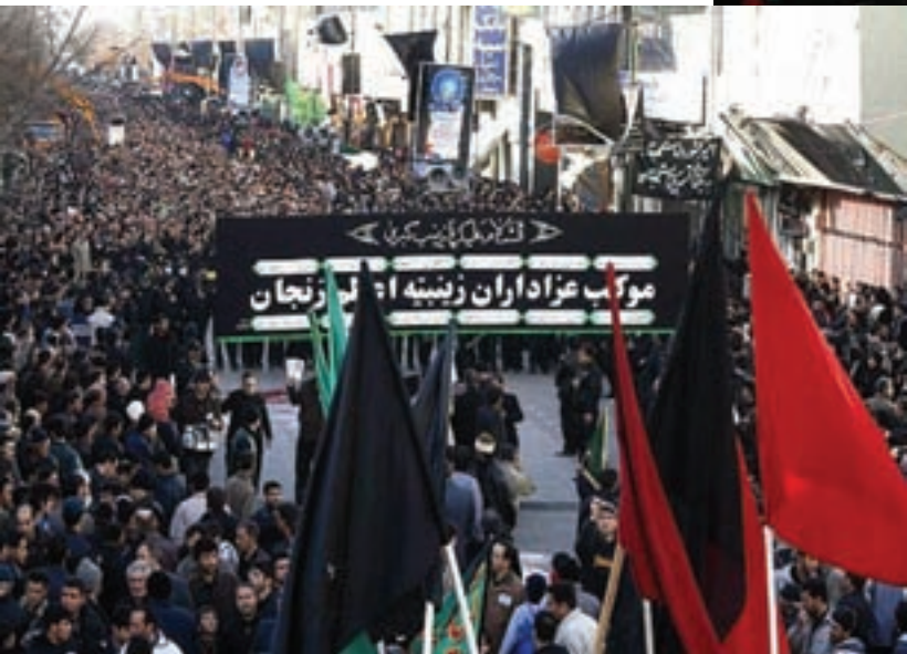
شکل ۳-۸- عزاداری زینبیه اعظم زنجان