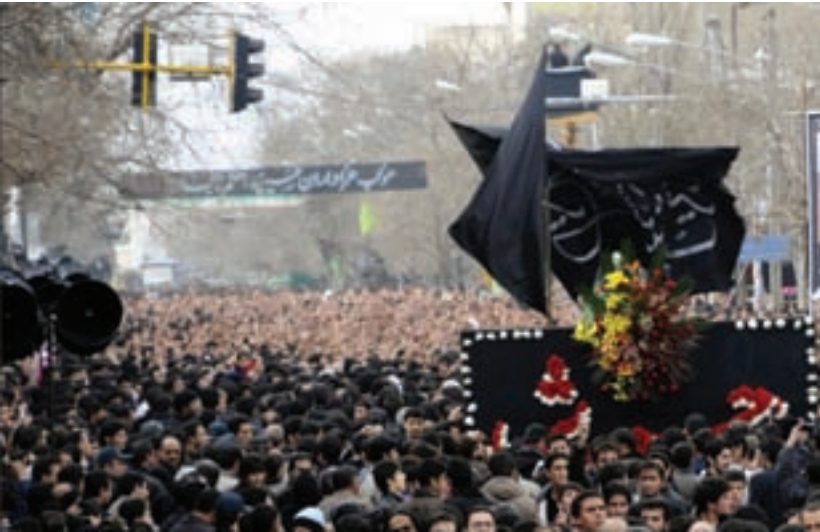
شکل ۳-۶- مراسم عزاداری حسینیه اعظم زنجان

شبیه‌خوانی یا تعزیه: نوع دیگری از عزاداری‌های رایج در استان است که مردم استان در شهرها و خصوصاً در اکثر روستاها با اجرای آن به عزاداری ائمه اطهار علیهم السلام می‌پردازند. شهر ارمغان‌خانه در اجرای تعزیه در استان شهرت خاصی دارد.