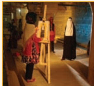
شکل ۴-۳- نمونه ای از لباس های محلی استان