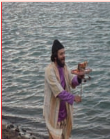
شکل ۲-۳- نمایش تکم گردانی

نمایش عروسی تکم گردانی : تکم گردانی یکی از نمایش های آیینی و سنتی ویژه نوروز در این استان است و به نام تکم اویونی و تکمچی اویونی نیز معروف است. که از ۱۵ الی ۲۰ روز قبل از نوروز شروع می شود. تکم، بزى است که از چوب و انواع پارچه های رنگی و مخمل قرمز و پولک و آئینه و زنگوله، سکه و منجوق تزئین می شود و چوب باریکی به صورت پایه به طول حدود ۵۰ سانتی متر به زیر شکم آن متصل می شود و تکم چی با حرکاتی بسیار هماهنگ آن را به رقص در می آورد و شعرهای دلنشین در وصف عید نوروز و بهار می خواند.