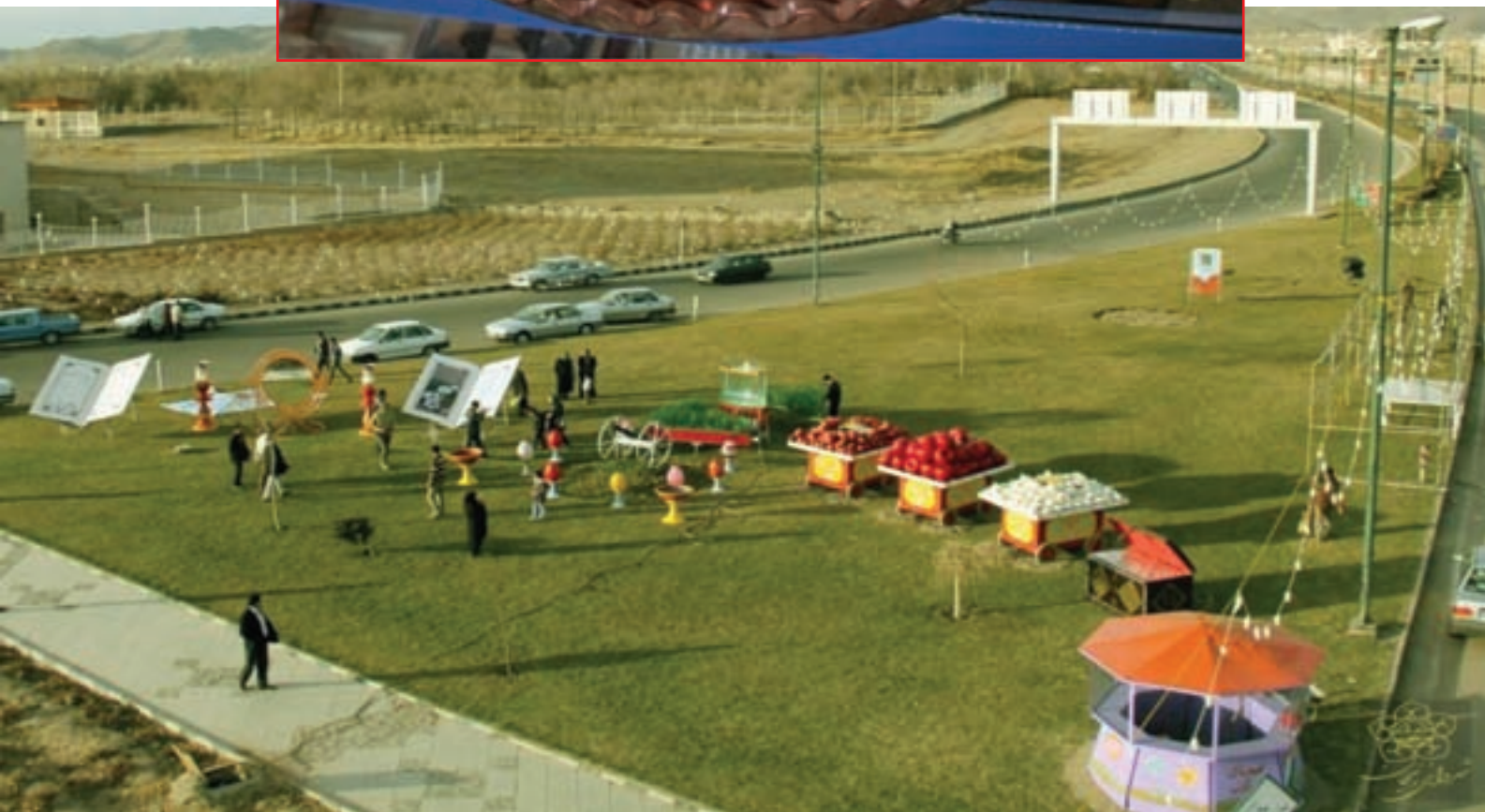
شکل ۱-۳- سفره هفت سین همراه با صنایع دستی بومی استان