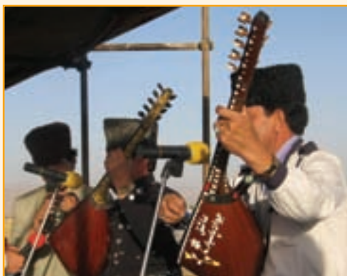
شکل ۵-۳- موسیقی محلی استان

موسیقی بومی استان زنجان از گنجینه موسیقی فولکلوریک و کلاسیک آذری تأثیر پذیرفته است و در حال حاضر نیز وجه غالب ترکیب موسیقی بومی، به‌ویژه مناطق روستایی استان را تشکیل می‌دهد. پیوستگی فرهنگی و قومی مردم استان با مردم آذری زبان از یک‌سو و ارتباط آن با منطقه‌هایی، غیر از زبان آذری از سوی دیگر، زمینه شکل‌گیری نوعی از موسیقی محلی ویژه را فراهم آورده است، که به موسیقی زنجانی معروف