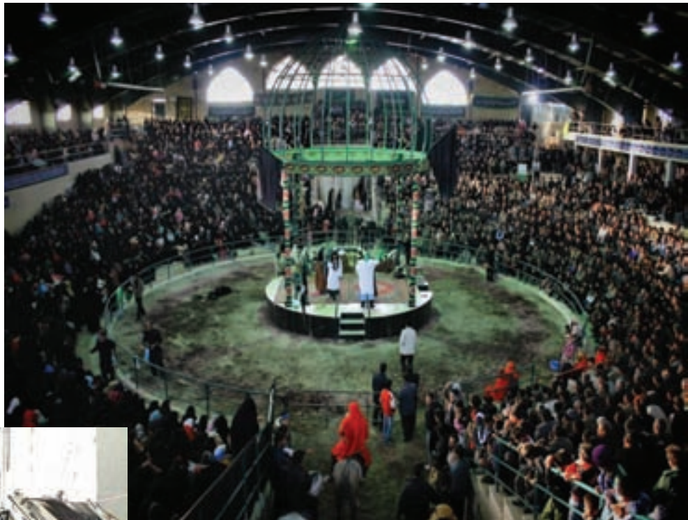
شکل ۳-۷- مراسم تعزیه در شهر ارمغان‌خانه