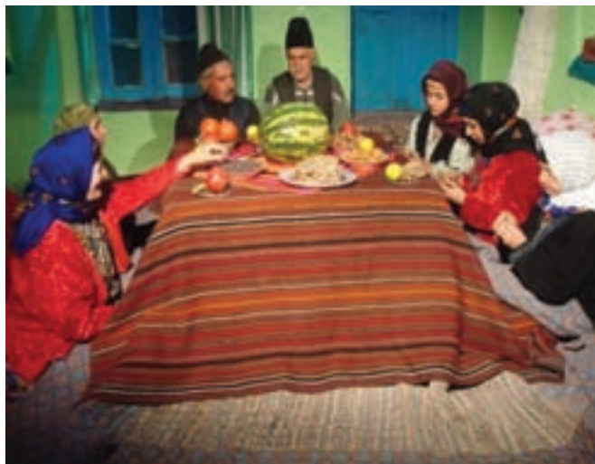
شکل ۳-۳- نمونه ای از مراسم شب چله در روستا

یلدا به عنوان طولانی ترین شب سال که به چله نیز معروف است، در استان زنجان هم مانند سایر استان ها از حال و هوای ویژه ای برخوردار است. به طوری که اهالی استان، برای پذیرایی و برگزاری مراسم خاص آن با خرید آجیل، هندوانه، و میوه های مختلف و شیرینی به استقبال این شب طولانی می روند. همچنین خانواده داماد برای عروس، با تهیه هدایایی همراه با خوراکی های این شب که در مجموعه ای به نام «خونچا» گردآوری کرده اند به دیدار خانواده عروس می روند. در این شب بزرگترها با شاهنامه خوانی و قصه های شیرین ایرانی اعضای خانواده را سرگرم کرده و این شب را گرمی می دارند.