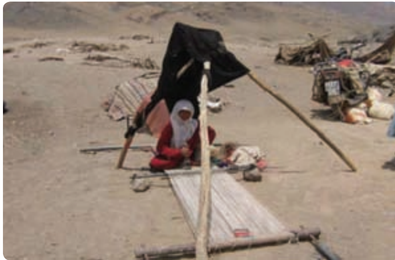
شکل ۶-۲- عشایر منطقه دستگردان طبس

ج) زندگی کوچ نشینی: در استان یزد زندگی کوچ نشینی محدودی در مناطقی از جنوب و شمال استان مانند شهرستان خاتم و منطقه دستگردان طبس دیده می‌شود. کوچ نشین‌های شهرستان خاتم از استان فارس در بعضی از فصول سال، به این منطقه کوچ و همچنین در دستگردان طبس کوچ نشین‌های دامدار در مواقعی از سال به این منطقه کوچ می‌کنند.