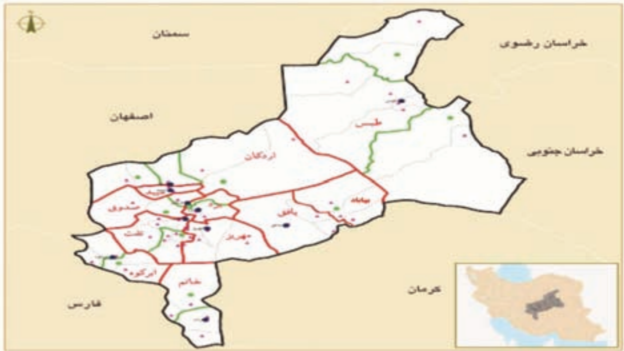
شکل ۴-۲- نقشه پراکندگی شهرها و روستاهای استان

هنری دارای شهرت جهانی بوده و هنوز هم به طور نسبی از کیفیت خوبی برخوردار است. شهر یزد دارای صنایع مدرن و پیشرفته، بیمارستان‌های مجهز و متعدد و نیروی انسانی متعهد و متخصص، دارای سرمایه‌های مادی و معنوی است که ضمن حفظ سنت گذشته این شهر را آباد و توانمند در مسیر توسعه، حفظ می‌کند.