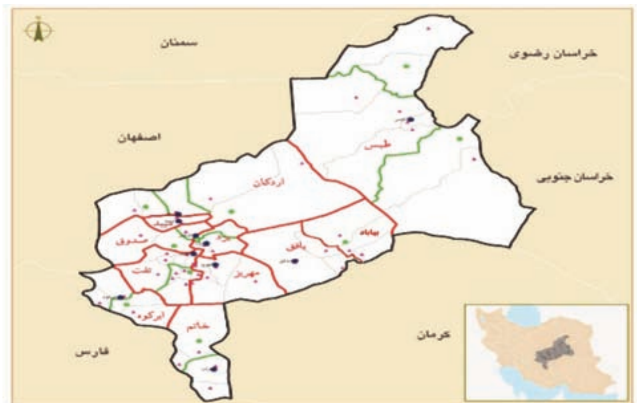
شکل ۱-۲- نقشه تقسیمات سیاسی استان

در اولین دوره قانون گذاری در سال ۱۲۸۵ هجری شمسی پس از نهضت مشروطیت قانون تشکیل ایالات و ولایات به تصویب رسید. در این دوره ایران به چهار ایالت و ۱۲ ولایت تقسیم شد که یزد یکی از ولایات بوده است. در تقسیمات کشوری سال ۱۳۱۶ هجری شمسی ایران به ۱۰ استان تقسیم شد که اصفهان و یزد شامل استان دهم بودند. در سال ۱۳۴۸ یزد به فرمانداری کل و در سال ۱۳۵۲ به استان تبدیل شد. با توجه به شکل ۱-۲ استان یزد در حال حاضر دارای ۱۱ شهرستان، ۲۳ شهر، ۲۱ بخش و ۵۳ دهستان می باشد.