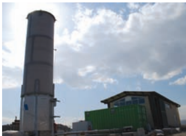
شکل ۶۴-۱- نیروگاه بیوگاز مشهد با تولید ۶۰۰ کیلو وات ساعت برق

مؤثرترین راه کاهش مضرات و هزینه‌های دفع زباله، جداسازی در مبدأ است که از آلودگی ناشی از مخلوط شدن و فعل و انفعالات شیمیایی پیشگیری می‌نماید و تبدیل آن به محصولات جدید و قابل استفاده را در بر دارد. البته این امر نیازمند مشارکت وسیع شهروندان است. تولید روزانه 180^{\circ} تن زباله در شهر مشهد و هزینه‌های سنگین مالی و زیست محیطی برای دفن و یا سوزاندن آن باعث شده است که بازیافت، تولید کود (کمپوست) و احداث کارخانه‌های بیو گاز و... در استان مورد توجه قرار گیرد.