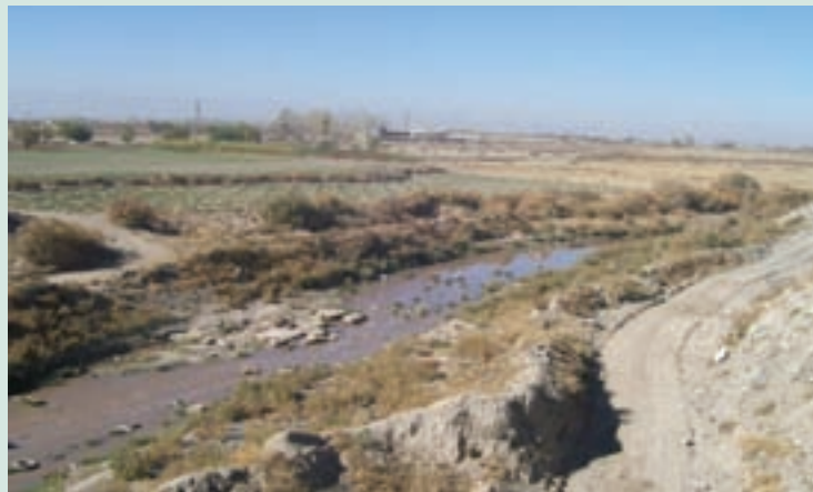
شکل ۶۲-۱- بخشی از مسیر کشف رود در حاشیه شهر مشهد

رودخانه کشف رود که در گذشته مظهر پاکي و به دریا معروف بود، اکنون با ورود فاضلاب‌های انسانی و صنعتی حاشیه شهر مشهد به این رودخانه، تبدیل به یکی از مهم‌ترین مظاهر آلودگی زیست محیطی منطقه شده است. فاضلاب‌های صنعتی حاصل بخشی از فعالیت‌های شهرک صنعتی، واحدهای آبکاری، صنایع پوست و چرم، واحدهای قالب‌سویی و فاضلاب‌های خانگی مسیر رودخانه هستند که به‌طور غیر قانونی به بستر آن وارد شده و باعث آلودگی شدید آب شده‌اند. متأسفانه برخی کشاورزان منطقه در حاشیه این رودخانه آلوده برای آبیاری زمین‌های کشاورزی به ویژه صیفی‌کاری استفاده می‌کنند و محصولات حاصل از این شیوه نادرست آبیاری در نهایت وارد بازار مصرف و به خصوص شهر مشهد می‌شود.