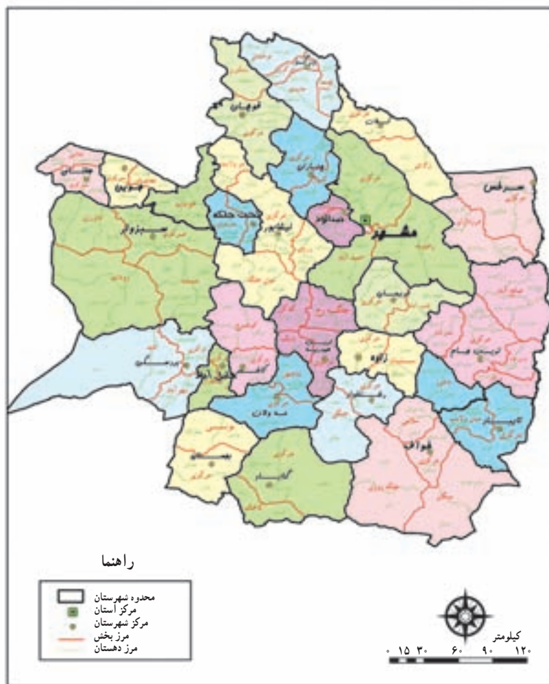
شکل ۱-۲- نقشه تقسیمات سیاسی استان خراسان رضوی

خراسان که عظمت آن در تاریخ این مرز و بوم از سابقه‌ای دیرینه برخوردار است، به سبب موقعیت جغرافیایی، تاریخی و فرهنگی خود همواره در ادوار تاریخی از بخش‌های اصلی ایران زمین محسوب و به‌عنوان بزرگترین استان شرقی از آن نام برده شده است. امروزه استان خراسان رضوی بخش اصلی خراسان بزرگ را شامل می‌شود که وجود نگین ولایت و امامت به آن تقدسی خاص بخشیده است. بر اساس آخرین تقسیمات سیاسی استان خراسان رضوی شامل ۲۷ شهرستان، ۶۹ بخش، ۱۶۳ دهستان و ۷۲ شهر می‌باشد.