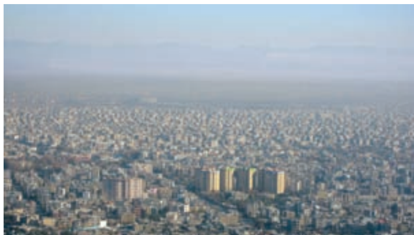
شکل ۶۰-۱- نمای از آلودگی هوا در شهر مشهد

آلودگی هوا بیشتر در شهرها و به ویژه مشهد مطرح است. زیرا بیش از ۵۰ درصد جمعیت استان را در خود جای داده است. منابع آلودگی هوای شهرها عبارتند از: الف) منابع ایستا: واحدهای صنعتی، کارگاه‌ها، مناطق مسکونی و تجاری.