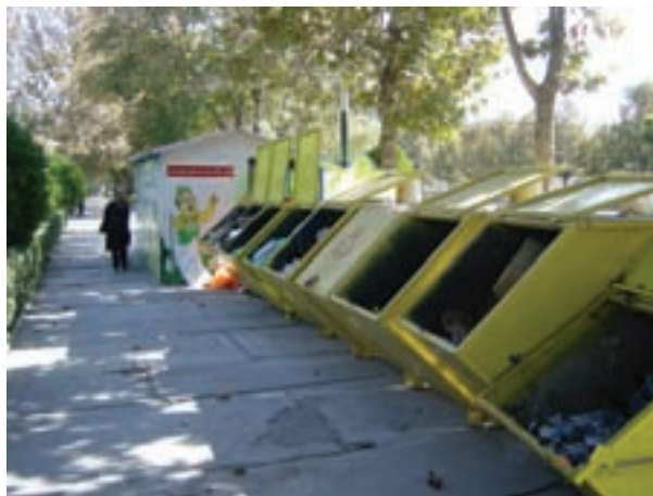
شکل ۶۳-۱- ایستگاه‌های ثابت جمع‌آوری زباله مشهد

بازیافت زباله باعث کاهش آلودگی‌های زیست محیطی، حفظ منابع و ذخایر زیرزمینی، کاهش وابستگی به خارج در زمینه کالا و مواد اولیه و به‌طور کلی جلوگیری از اتلاف منابع و سرمایه‌های ملی می‌شود.