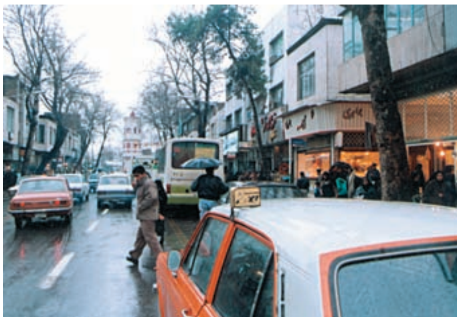
شکل ۱۰-۲- خیابان جمهوری اسلامی شهر ساری

به نظر شما اثرات مثبت و منفی مهاجرت به استان مازندران چیست؟