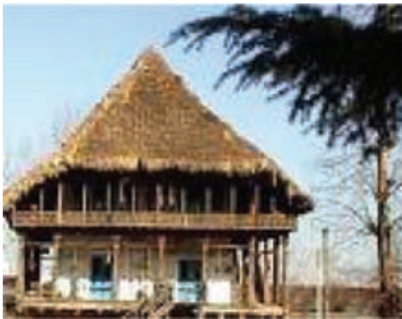
شکل ۴-۲- مسکن روستایی مربوط به زمان گذشته

مسکن روستایی مازندران: مسکن روستایی در مازندران با وجود تشابهات ظاهری، از تنوع زیادی برخوردار است. دلایل این تنوع عبارت‌اند از: شرایط آب و هوایی، وضعیت توپوگرافی، نوع مصالح در دسترس، نوع معیشت و کارکرد اقتصادی خانوار. معمولاً سقف مسکن روستایی با توجه به محیط اطراف آن تعیین می‌شود که با توجه به آب و هوای استان مازندران که مرطوب و بارانی است از نوع شیروانی است.