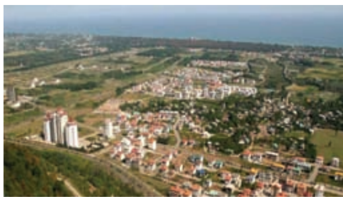
شکل ۶-۲- مسکن شهری

منابع درآمد روستاییان مازندران: اقتصاد استان مبتنی بر سه بخش کشاورزی، صنعت و خدمات است. مهم‌ترین فعالیت روستاییان در مازندران در بخش کشاورزی است. البته یکی از بخش‌هایی که در سال‌های اخیر رواج پیدا کرده، بخش خدمات است.