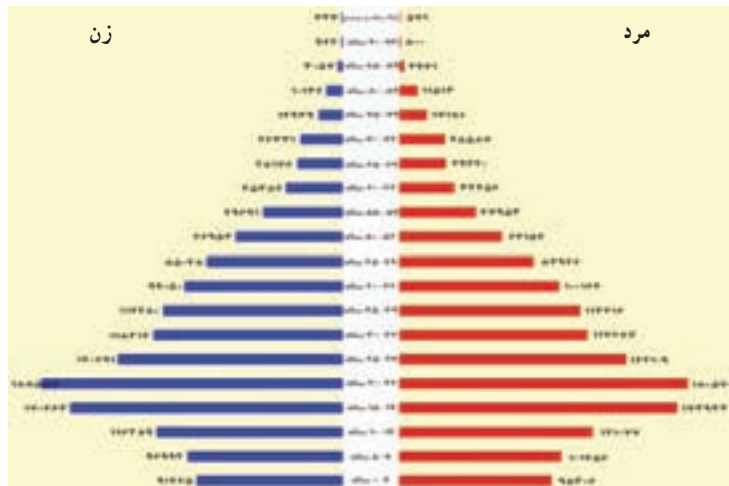
شکل ۲-۹- هرم سنی جمعیت ۱۳۸۵