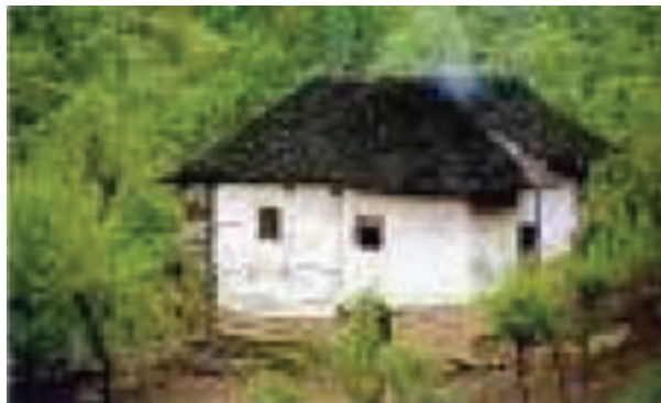
شکل ۵-۲- مسکن روستایی

شکل و نوع ساخت مسکن در روستاهای مازندران در طی دهه‌های اخیر تغییرات زیادی کرده است. مواد و مصالح ساختمانی این خانه‌ها تا حد زیادی به محیط اطراف آن بستگی دارد. به عنوان مثال، اغلب در مناطق کوهستانی و سرد از سنگ و در مناطق جنگلی، از چوب استفاده می‌شود.