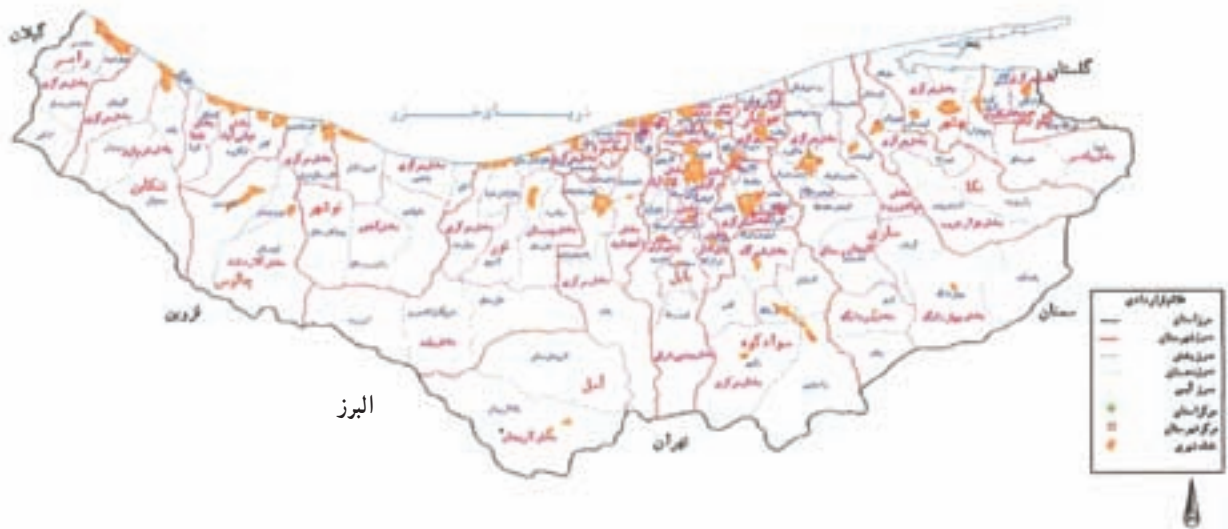
شکل ۱-۲- نقشه تقسیمات سیاسی استان مازندران سال ۱۳۸۷

استان مازندران بر اساس آخرین تقسیمات کشوری دارای ۱۹ شهرستان به نام‌های آمل، بابل، بابلسر، بهشهر، تنکابن، عباس‌آباد، جویبار، چالوس، رامسر، ساری، سوادکوه، قائم‌شهر، گلوگاه، محمودآباد، نکا، نور، نوشهر، فریدونکنار و میاندورود، ۵۲ شهر، ۴۶ بخش و ۱۱۷ دهستان می‌باشد.