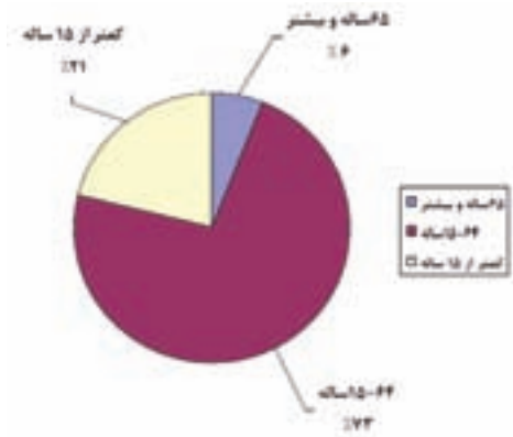
شکل ۲-۷- توزیع نسبی جمعیت بر حسب گروه‌های عمده سنی (فقط «مرد و زن» درصدی - دایره‌ای)