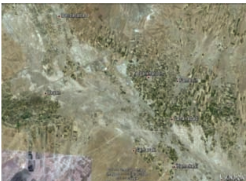
شکل ۸۴-۱- تصویر ماهواره‌ای از پدیده شوری خاک در فامنین و قهاوند