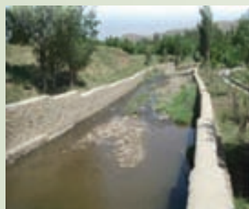
شکل ۱-۶۴- دیوار حاشیة رودخانه