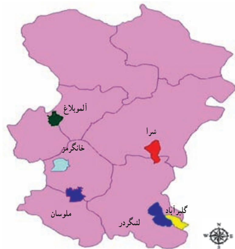
شکل ۱-۷۰- نقشه مناطق حفاظت شده استان

استان ما در حال حاضر، دارای ۶ منطقه مهم حفاظت شده است که عبارت‌اند از: گلپرایاد، خان‌گرمز، لشگردر، شرا، الموبلاغ، ملوسان و دو منطقه شکار ممنوع شیرین سو و و آق‌گل. (نقشه ۱-۷۰)