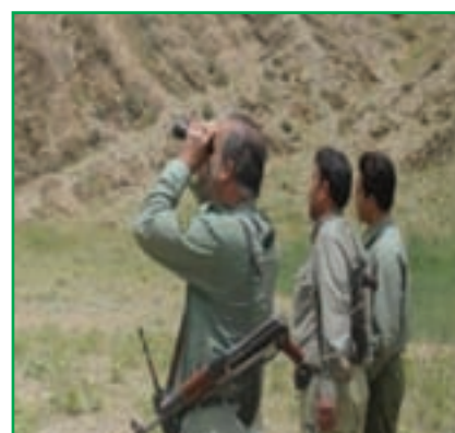
شکل ۱-۷۲- محیط بانان سازمان حفاظت از محیط زیست

بررسی کنید که در سال‌های اخیر کدام یک از گونه‌های گیاهی و جانوری محل زندگی شما از بین رفته است؟ نتیجه را به کلاس ارائه دهید.