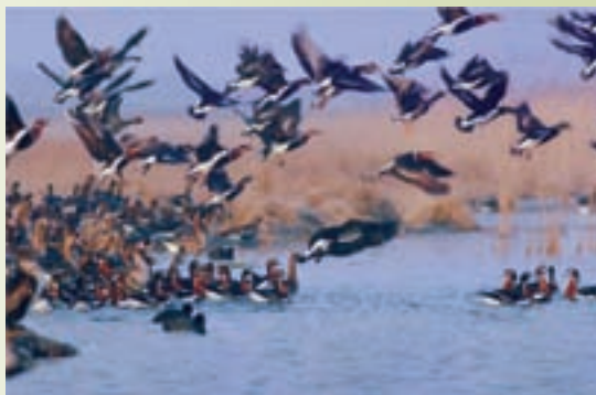
شکل ۷۵-۱- منطقه شکار ممنوع - شیرین سو

منطقه شکار ممنوع: منطقه شکار ممنوع نیز همچون مناطق حفاظت شده دارای شرایط مناسب جهت حفظ و تکثیر گونه‌های مختلف گیاهی و جانوری‌اند و با نظارت سازمان حفاظت محیط زیست دارای ممنوعیت شکار و صید، قطع درختان و آسیب‌رساندن به محیط است.