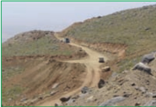
شکل ۵۹-۱ احداث راه در مراتع