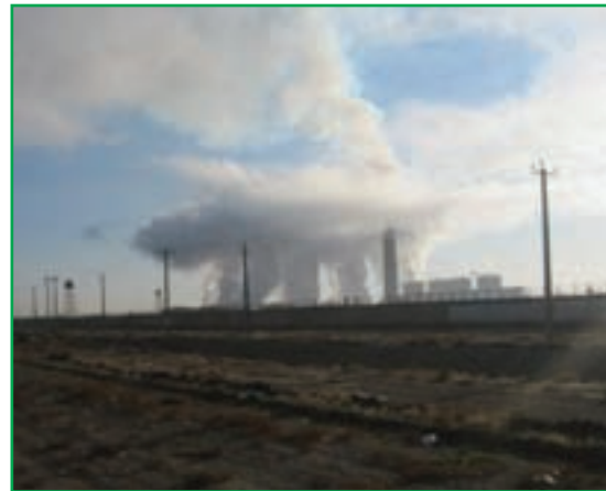
شکل ۲۸-۱- آلودگی هوا - صنایع