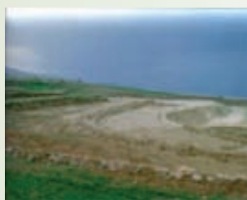
شکل ۱-۶۵- تراس بندی