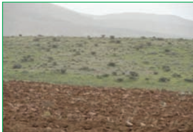
شکل ۶۰-۱ تبدیل مراتع به زمین کشاورزی