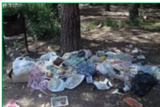
شکل ۸۲-۱- ریختن زباله در محیط

خاک، بستر حیات و زیستگاه بسیاری از موجودات و یکی از مهم‌ترین اجزای محیط طبیعی ماست که زمینه تأمین مواد غذایی مورد نیاز انسان و سایر جانوران را فراهم می‌کند. استان ما از توان بسیار بالایی در زمینه کشاورزی برخوردار است و بیشتر فعالیت‌ها در بخش کشت و زرع، باغداری و پرورش دام صورت می‌گیرد. امروزه توسعه این فعالیت‌ها موجب به‌کارگیری انواع کودهای شیمیایی و سموم دفع آفات نباتی در این بخش شده و استفاده گسترده از این مواد، موجبات آلودگی خاک را فراهم کرده است. از طرفی اقداماتی نظیر آبیاری با فاضلاب‌های شهری، ریختن زباله‌ها در محیط و آتش‌زدن بقایای محصولات کشاورزی، موجب آلودگی و تضعیف خاک‌های استان شده است.