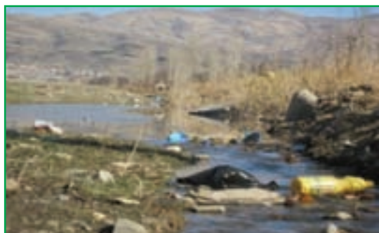
شکل ۸۱-۱- فاضلاب‌های شهری در بستر رودخانه‌ها

و به چرخه آب برمی‌گردند که باعث آلودگی آب و خاک می‌شوند. در اثر فعالیت‌های تولیدی و صنعتی در کارخانجات و واحدهای صنعتی استان نیز فاضلاب صنعتی تولید می‌شوند و در نتیجه مقدار قابل توجهی از مواد شیمیایی خطرناک را وارد آب‌های سطحی و زیرزمینی می‌کنند.