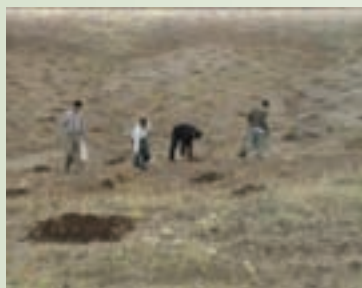
شکل ۱-۶۲- کپه کاری