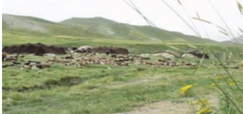
شکل ۵۷-۱ تغذیه دام عشایر