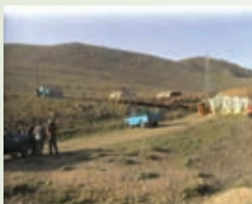
شکل ۱-۶۷- مدیریت و نظارت بر چرا