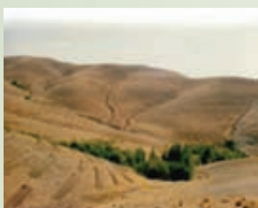
شکل ۱-۶۶- احداث بانکت بندی