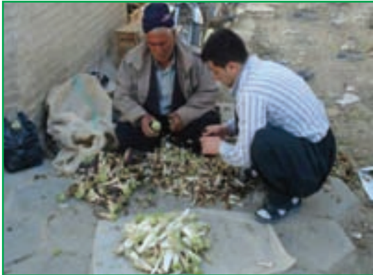
شکل ۵۸-۱ برداشت کنگر از مراتع