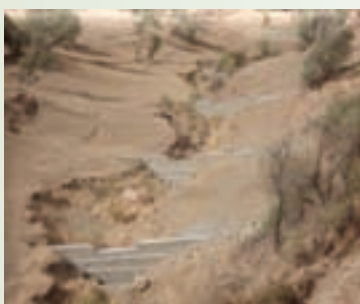
شکل ۱-۶۳- بند گابیونی (سنگ ها در تور سیمی)