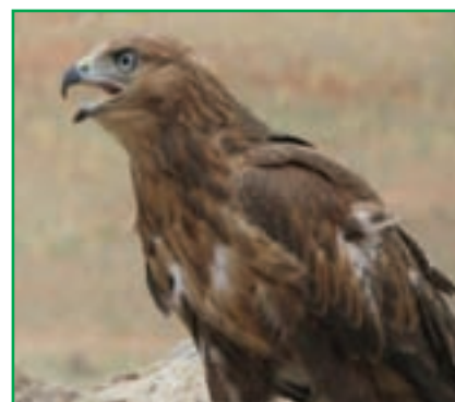
شکل ۱-۷۱- عقاب طلایی