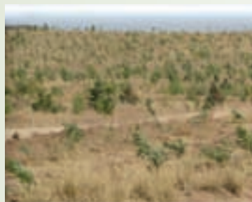
شکل ۱-۶۱- نهال کاری