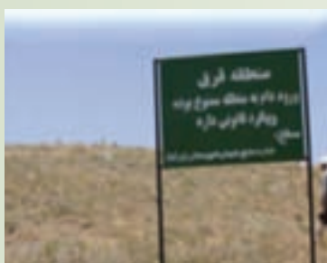
شکل ۱-۶۸- حفاظت و قرق مراتع - کبودرآهنگ