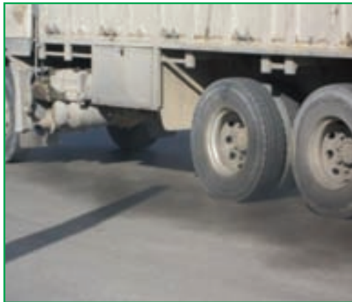
شکل ۲۹-۱- آلودگی هوا - خودروها

سهم وسایل نقلیه در آلودگی هوا بیشتر از دیگر منابع آلاینده است. از دیگر منابع آلوده کننده هوای استان می توان به صنایع آسفالت، ریخته گری، سیمان، کوره های آجرپزی و ... اشاره کرد.