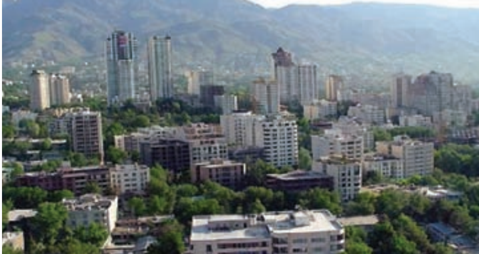
شکل ۲۶-۱- چشم اندازی از تهران در هوای پاک - یک روز دارای هوای پاک