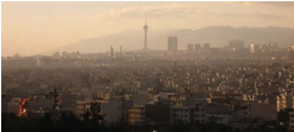
شکل ۲۷-۱- چشم اندازی از شهر تهران در هنگام آلودگی هوا

اقداماتی که تاکنون در جهت کنترل و کاهش آلودگی هوا صورت گرفته است عبارت اند از :