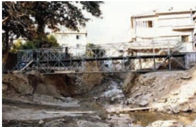
شکل ۲۴-۱- تخریب ساختمان‌ها و مسیر رود تجریش بر اثر سیلاب گلابدره تهران، مرداد ماه ۱۳۶۶