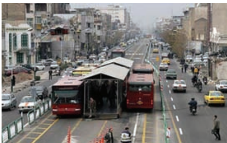
شکل ۲۹-۱- ایستگاه اتوبوس‌های تندرو (BRT)

آلودگی منابع آب در استان تهران : استان تهران با جمعیتی بیش از ۱۲ میلیون نفر و دارا بودن بزرگ‌ترین مناطق شهری، فاقد سیستم فاضلاب شهری است و دفع فاضلاب عمدتاً از طریق تخلیه در چاه‌های نفوذی انجام می‌گیرد که از طریق جذب به منابع آب زیرزمینی منتقل می‌شود.