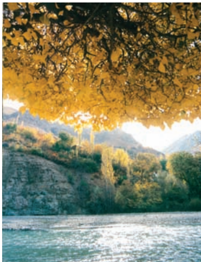
شکل ۱۹-۱- چشم اندازی از رودخانه جاجرود

منابع آب استان به دو دسته تقسیم می‌شوند :