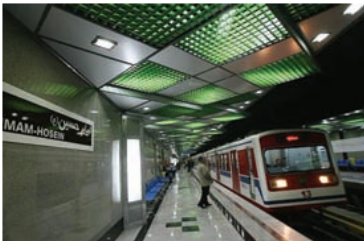
شکل ۲۸-۱- مترو راه حلی برای کاهش آلودگی هوای تهران

۷- انتقال کارخانه‌های آلاینده هوا به خارج از شهر تهران و حتی تعطیلی برخی از کارخانه‌های آلوده کننده هوا