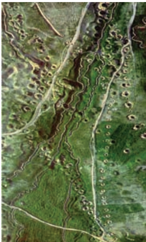
شکل ۲۲-۱- تصویر هوایی از قنات ورامین

قنات‌ها: از دیرباز یکی از روش‌های به دست آوردن آب در استان تهران، استفاده از قنات بوده است؛ از این رو، حدود ۵۰۰ رشته قنات در منطقهٔ شهری تهران، شهرری و سایر مناطق استان احداث شده است. به علت گسترش مناطق شهری و نبود متولی برای ساماندهی به این قنات‌ها، اغلب آن‌ها به حالت مسدود و غیر قابل استفاده درآمده است. بازسازی و به کارگیری دوبارهٔ این قنات‌ها می‌تواند به عنوان یکی از راه‌های مناسب حل کمبود آب استان تهران مورد توجه قرار گیرد.