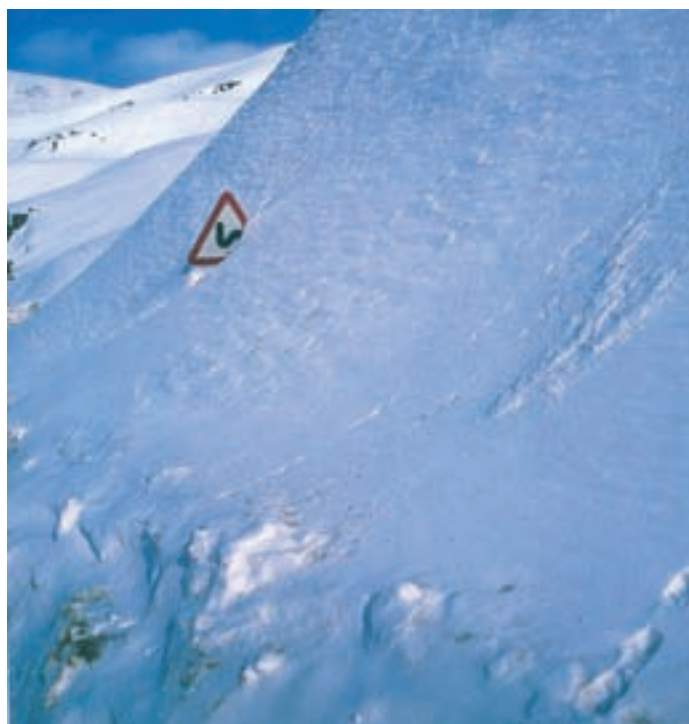
شکل ۲۵-۱- سقوط بهمن در یکی از جاده های استان تهران

پ — بهمن : استان تهران به واسطه قرار گرفتن در یک منطقه کوهستانی از نقاط بهمن خیز کشور محسوب می شود، سقوط بهمن در گذرگاه های شرقی و غربی استان که عمده ترین جاده های مواصلاتی به نواحی شمالی ایران است، در فصل زمستان مشکلاتی را برای مسافران ایجاد می کند. دو محور دیزین و فیروزکوه مهم ترین نقاط بهمن خیز استان تهران اند.