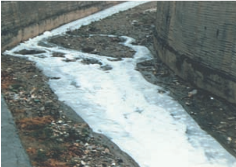
شکل ۳۰-۱- جریان فاضلاب به صورت روباز در شهر تهران

در این زمینه سازمان آب و فاضلاب استان تهران وابسته به وزارت نیرو در حال احداث شبکه فاضلاب (اگوسازی) در اکثر مناطق استان تهران است تا بدین وسیله از آلودگی هوا، خاک، پوشش گیاهی و حیات جانوری کاسته شود. آلودگی خاک: از دیگر انواع آلودگی‌های زیست محیطی استان تهران می‌توان از آلودگی خاک نام برد که دفن غیر علمی زباله، نشت لوله‌های انتقال نفت و استفاده بی‌رویه از کودها و سموم کشاورزی از عوامل این نوع آلودگی‌اند. آلودگی صوتی: تردد زیاد خودروها، ساخت و سازها و تخلیه مصالح ساختمانی از عوامل عمده آلودگی صوتی‌اند.