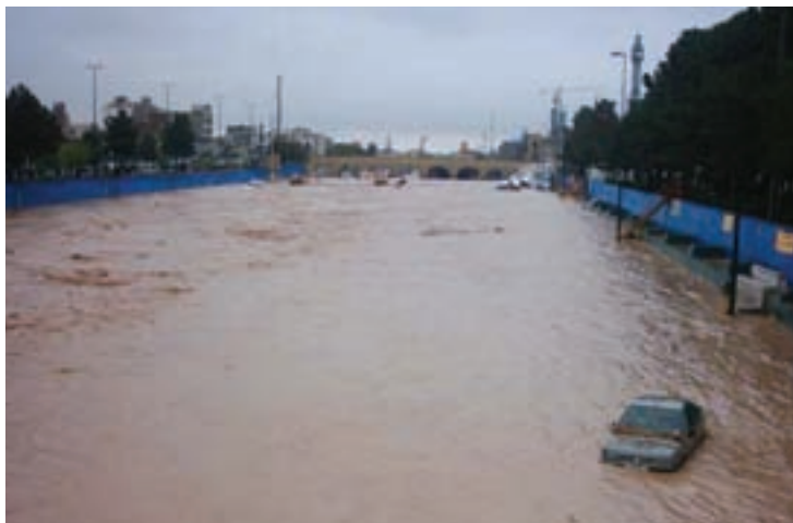
شکل ۲۹-۱- وقوع سیل در روز ۱۱ فروردین ۱۳۸۸

– برای کاهش خسارات خشک‌سالی در استان چه راهکارهایی را مناسب می‌دانید؟