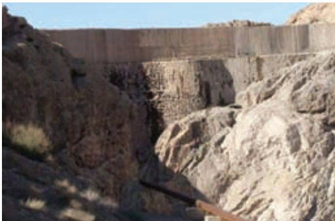
شکل ۱۶-۱- سد کبار

سد کبار در ۲۸ کیلومتری جنوب قم روی رود بیرقان احداث شده و با قدمتی حدود ۷۰۰ سال، قدیمی‌ترین سد قوسی جهان است (شکل ۱۶-۱).