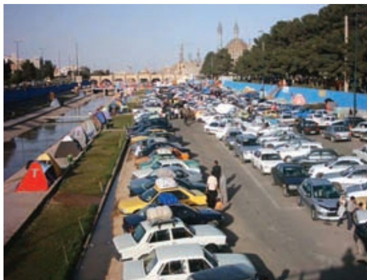
شکل ۳۰-۱- روز ۹ فروردین ۱۳۸۸

پ) سیل: به دلیل تخریب حوزه‌های آبخیز استان خسارات ناشی از سیل در استان در چند دهه اخیر در حال افزایش است به طوری که مردم بیشتر نواحی استان از سهم اندک خود از بارش‌های استان حداکثر خسارت را متحمل شده‌اند. قابل ذکر است بعد از سال ۱۳۷۰ انجام فعالیت‌های آبخیزداری و سایر اقدامات امنیتی نقش مؤثری در کاهش خسارات ناشی از سیل داشته است. شکل ۳۰-۱ وقوع سیل در شهر قم و طغیان آب رودخانه قمرود در فروردین ۱۳۸۸ را نشان می‌دهد.