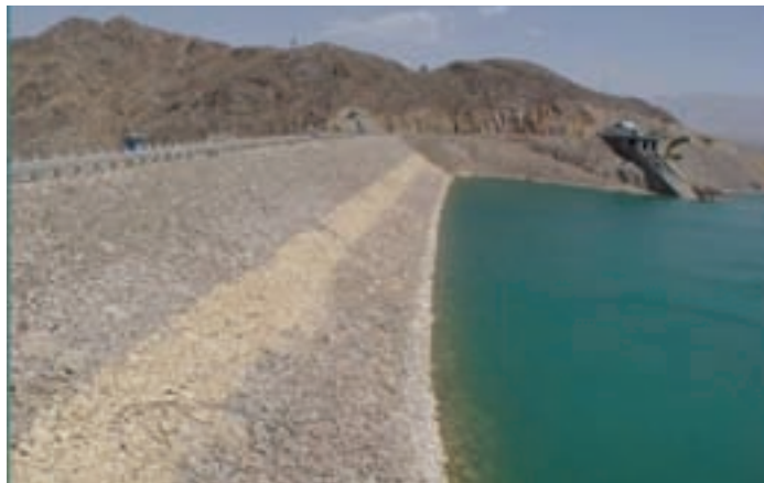
شکل ۱۵-۱- سد ۱۵ خرداد

سد ۱۵ خرداد: این سد در فاصله ۶۵ کیلومتری جنوب غربی شهر قم و در خارج از محدوده سیاسی استان قم روی قمرود ساخته شده است. هدف از ساخت این سد، تأمین آب آشامیدنی شهر قم، تأمین آب مورد نیاز زمین‌های کشاورزی و نیز مهار سیلاب است. این سد از دو قسمت، سد اصلی و بازوی خاکی تشکیل شده است. آب دریاچه سد به دلیل ورود برخی رودهای فرعی شور به قمرود و تبخیر زیاد سد، تا حدودی شور است (شکل ۱۵-۱).