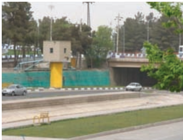
شکل ۱۸-۱- تصویر یکی از چاه‌های آب داخل رودخانه

۳- چاه‌های علی‌آباد: در حدود ۱۳ حلقه چاه در دشت علی‌آباد واقع در شمال غرب استان حفر شده است که بخشی از آب