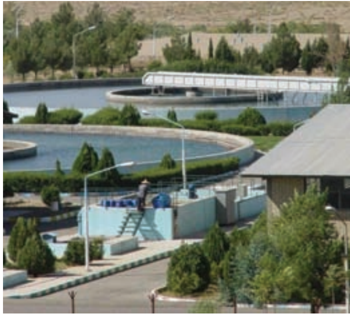
شکل ۳۲-۱- تصفیه‌خانه سد ۱۵ خرداد

«دودهک» احداث شده است. آب تصفیه‌خانه قم از سد ۱۵ خرداد تأمین و توسط لوله به تصفیه‌خانه منتقل می‌شود. در این تصفیه‌خانه، سالانه حدود ۷۰ میلیون مترمکعب آب تصفیه شده به شهر قم منتقل می‌شود (شکل ۳۲-۱).