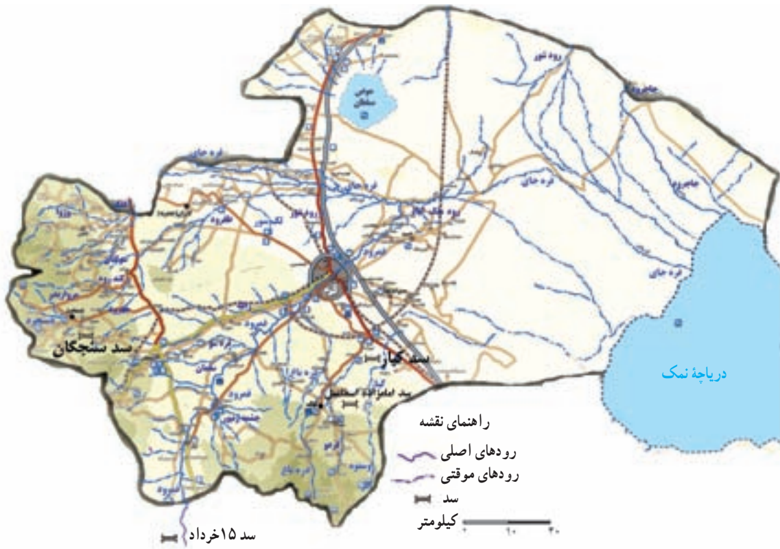
شکل ۱۴-۱- نقشه پراکندگی دریاچه‌ها، سدها و رودهای استان قم