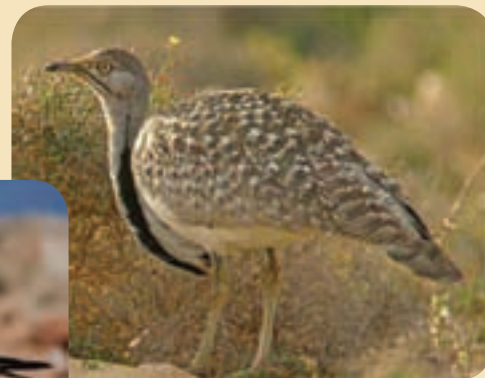
شکل ۲۶-۱- هوبره پرندۀ ای در منطقه مسیله