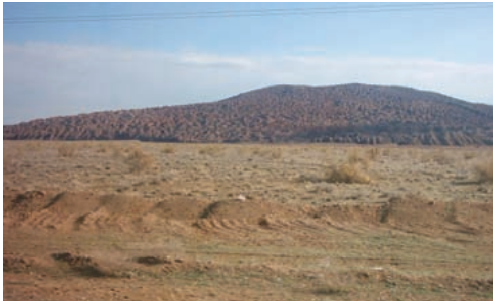
شکل ۳۵-۱- منطقه بیابانی کوه نمک

روش‌های مبارزه با بیابان‌زایی در استان قم