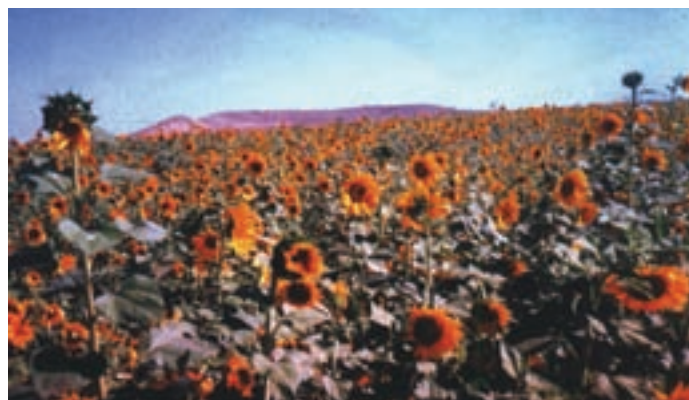
شکل ۳۳-۱- کشت آفتابگردان با استفاده از پساب فاضلاب در منطقه حصار سرخ