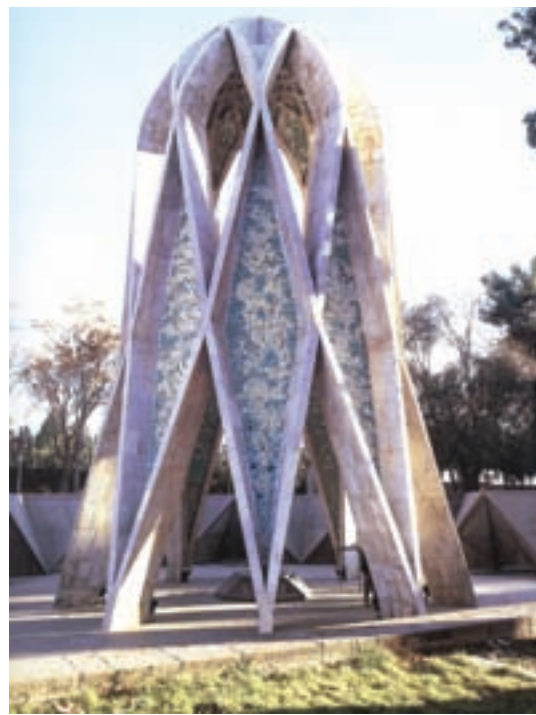
▲ شکل ۹-۱۴ الف- آرامگاه خیام، نیشابور، هوشنگ سیحون