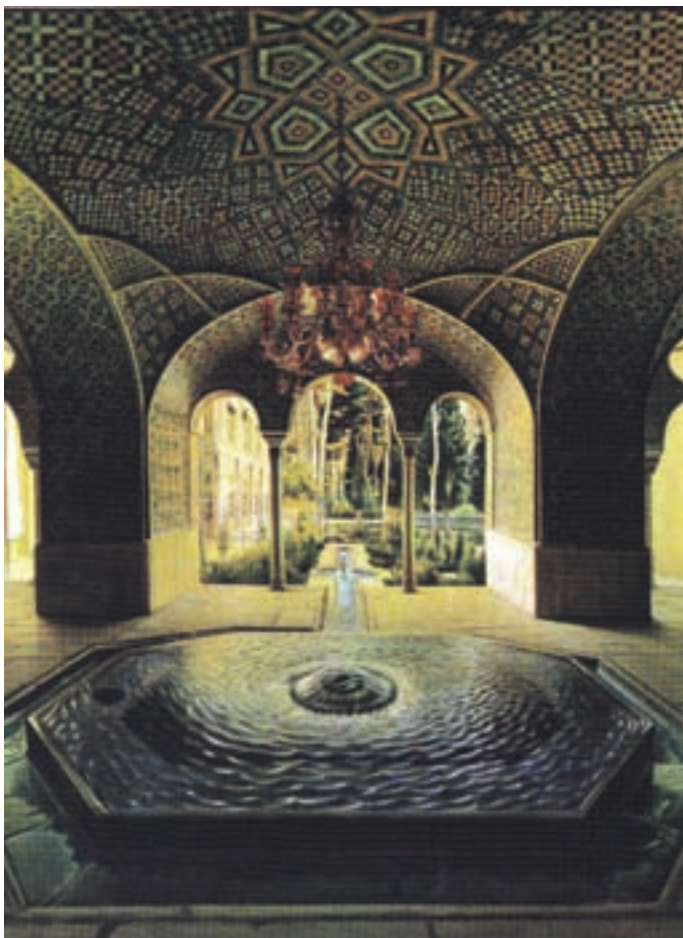
▲ شکل ۱۶-۱۳- حوض خانه، کمال الملک، رنگ و روغن روی بوم