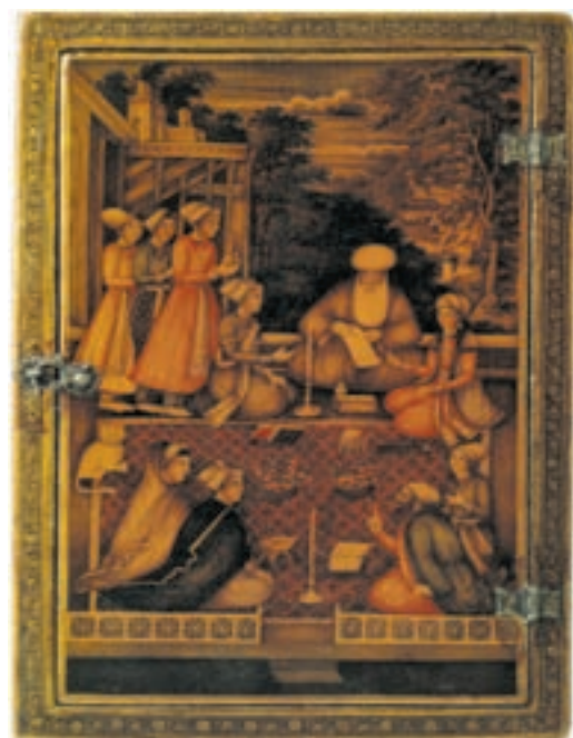
▲ شکل ۵-۱۳- قاب آینه، نقاشی لاکی روغنی

در دوره قاجاریه که دوران نسبتاً طولانی‌تری در این دوره را به خود اختصاص داده در ابتدا نوعی گرایش سنتی همراه با بزرگ‌نمایی ارزش‌های باستانی دیده می‌شود. هنر این دوره برخوردار از سنت انتقالی میراث هنری صفویه از طریق زندیه است. از این رو این هنر را بیشتر به‌عنوان زند و قاجار می‌شناسند. اما به‌طور کلی جریان‌های هنری در دوره قاجاریه با گرایشات متعددی به‌وجود آمد که همان‌طور که اشاره شد ابتدای آن به‌عنوان هنر زند و قاجار می‌شناسند. این گرایش هنری همچنان با حفظ و نگهداری میراث هنری صفویه و زندیه است که به مرور به زوال می‌گراید. این هنر شامل نقاشی‌های دیواری، تک نسخه‌ها، نقاشی‌های لاکی روغنی و پشت شیشه و نقش برجسته‌های سنگی و ساخت بناها و کاخ‌های متعدد است.