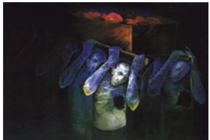
▲ شکل ۱۲-۱۴ ج - نقاشی رنگ و روغن، دوره معاصر