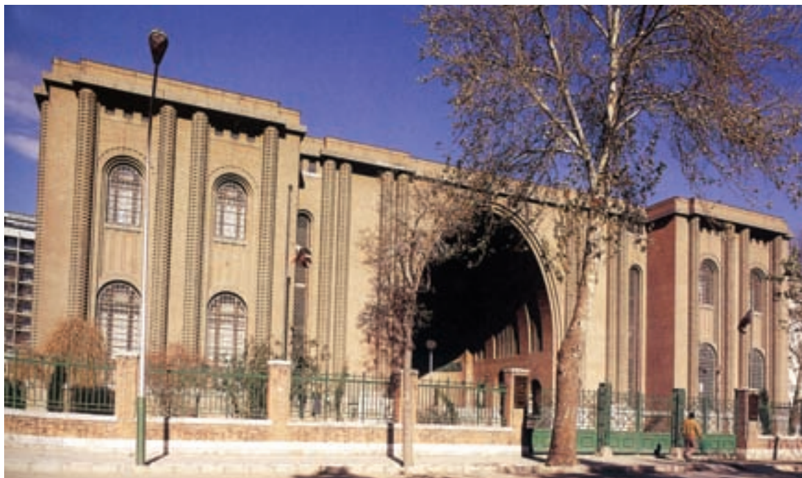
▲ شکل ۱۴-۱- سر در موزه ملی ایران، تهران، آندره گدار

بودند اما به لحاظ رویکرد باستان‌شناسی سعی داشتند تا طرح‌های معماری خود را به شیوه باستانی بسازند (شکل ۱۴-۱).