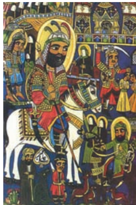
▲ شکل ۱۱-۱۴ نقاشی عامیانه، نقاشی قهوه‌خانه

دوره چهارم نوعی رویکرد هنری از سال ۱۳۶۰ به بعد است که نوعی تداوم هنر سنت‌گرایی دوره سوم است که با تحولاتی در جریان شکل‌گیری انقلاب و دفاع مقدس با گرایشات مذهبی ادامه می‌یابد. حاصل این تحول به گونه‌ای است که ارزش‌های انقلابی به گونه‌ای با ابزار هنری در جریان تحولات اخیر به هویتی کاملاً مشخص تبدیل می‌شود و نوعی انقلاب فرهنگی در عرصه‌های متفاوت ایجاد می‌شود که نتیجه آن به عنوان هنر انقلابی، هنر جنگ، هنر دفاع مقدس