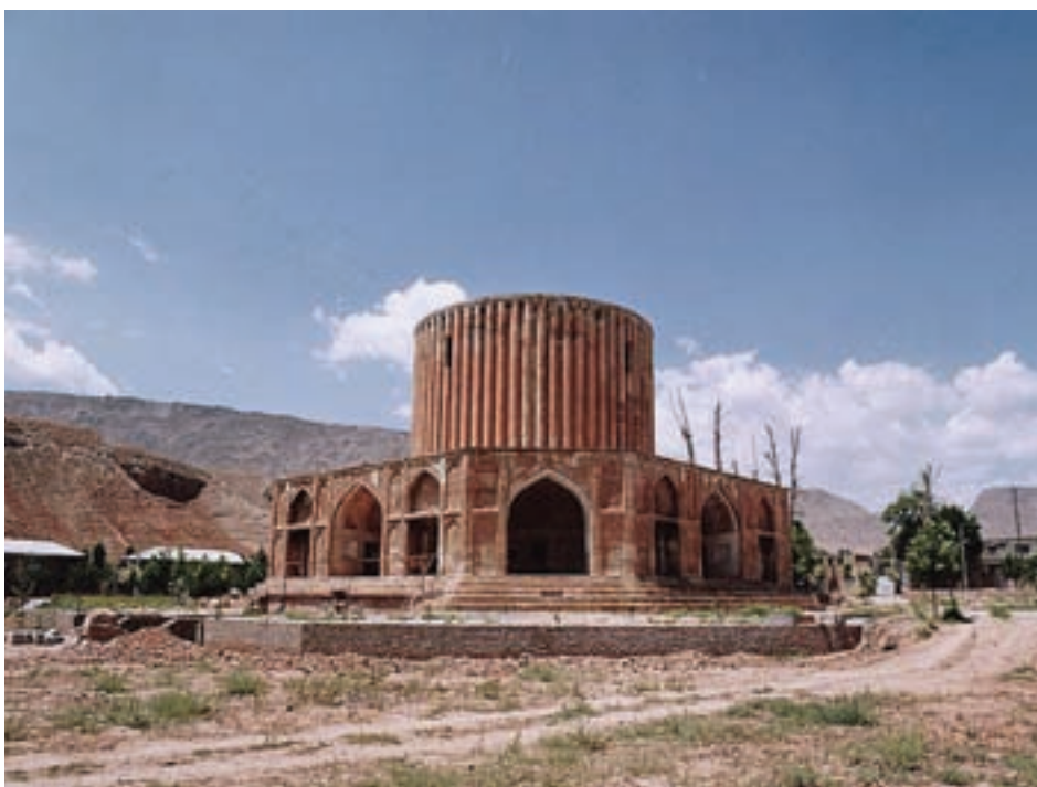
شکل ۲-۱۳ — کلات نادری، دوره افشاریه، خراسان ◀

در دوره زندیه ابتدا آرامش نسبی برقرار شد و نوعی هنر به عنوان «مکتب زند» یا «مکتب گل» در شیراز پدید آمد که بیشترین توجه به نقاشی های گل و مرغ و نقاشی زیرلاکی می شد و میراث این هنر توسط زندیه به عنوان تحولی که از دوران صفویه آغاز و به هنر قاجاریه انتقال یافت شناخته می شود. بنابراین زندیه با حفظ میراث هنری دوره صفویه با وجود اندک زمان حضور این سلسله توانست ویژگی های