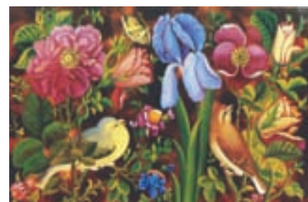
▲ شکل ۱۴-۱۳- نقاشی پشت شیشه، دوره قاجاریه

آخرین گرایش هنری دوره قاجاریه شکل‌گیری هنر آکادمی و رسمی است که با تأسیس مدرسه صنایع مستظرفه به همت کمال‌الملک شکل گرفت. این نوع هنر نوعی نقاشی ایرانی با گرایشات هنر کلاسیک غرب، شبه رماتیک و شاعرانه همراه با چشم‌اندازهایی از مکان‌هایی واقعی است که بیان‌کننده هنر رسمی است (شکل ۱۶-۱۳).