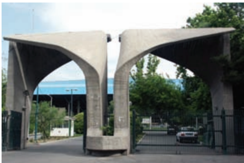
▲ شکل ۱۴-۲- سر در دانشگاه تهران

در این دوره تحولات علمی نیز با رویکرد جدید و تأسیس دانشگاه در ایران صورت می‌پذیرد (شکل ۱۴-۲) و سعی می‌شود تا جلوه‌هایی تازه در معرفی بزرگان ادب فارسی پدید آید و آرامگاه‌های باشکوهی از فردوسی، سعدی و حافظ ساخته شود (شکل ۱۴-۳ الف و ب و ج). در زمینه نقاشی و نگارگری نیز تحول بنیادینی شکل می‌گیرد و مدرسه صنایع مستظرفه به دو بخش هنرستان کمال الملک