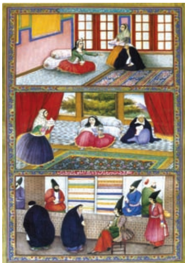
▲ شکل ۱۲-۱۳- الف - برگي از كتاب هزار و يك شب، صنيع الملك، دوره قاجاريه