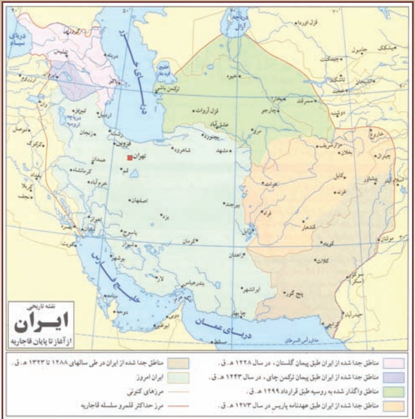
▲ نقشه ایران، دوره قاجاریه تا معاصر