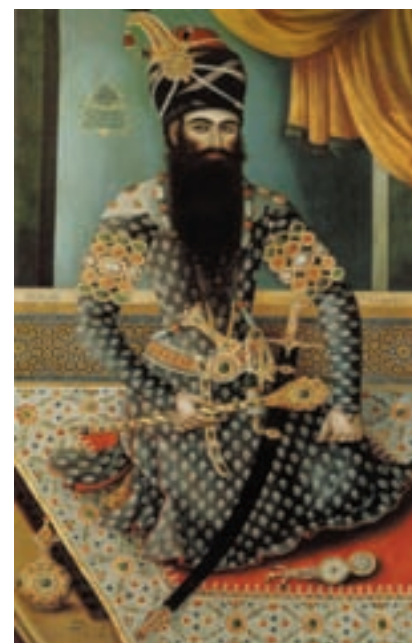
▲ شکل ۶-۱۳ شمایل نگاری (پیکرنگاری) فتحعلی شاه

پس از تأسیس مدرسه دارالفنون و دارالصنائع به عنوان اولین مرکز دولتی آموزشی هنری نوعی گرایش کامل به هنر اروپایی به وجود می آید و تمایل به هنر اشرافی و درباری به اینگونه آثار روز به روز بیشتر می شود و تمایلات هنر اروپایی بیشتر در منظره سازی و صورت سازی و دور شدن از نگارگری ایران دیده می شود (شکل ۸-۱۳). تحولات معماری در این دوره نیز مانند نقاشی با تلفیق عناصر سنتی و شکل ظاهری معماری اروپایی می باشد (شکل ۹-۱۳).