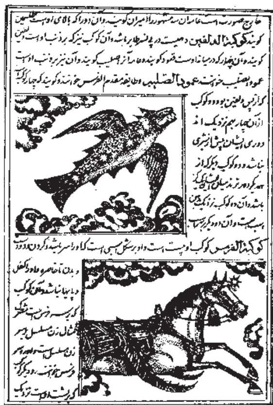
▲ شکل ۱۱-۱۳- چاپ سنگي، كتاب عجائب المخلوقات کرون