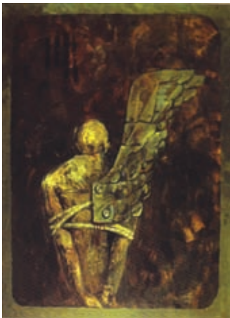
▲ شکل ۱۲-۱۴ د - رنگ اکریک روی بوم، دوره معاصر