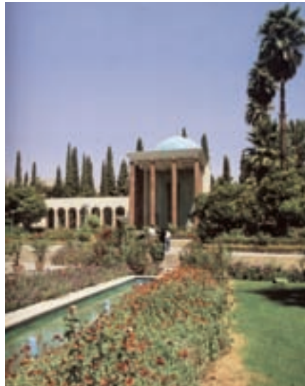
ب — سعدیه، شیراز، آندره گدار