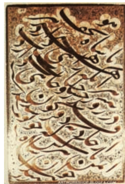
► شکل ۱۰-۱۳ سیاه مشق

خوشنویسی این دوره که بیشتر به شیوه نستعلیق می باشد به دلیل کاربردهای جدید هنری به شکل سیاه مشق (شکل ۱۰-۱۳) و یا نوعی نگارش مناسب برای چاپ سنگی است (شکل ۱۱-۱۳).