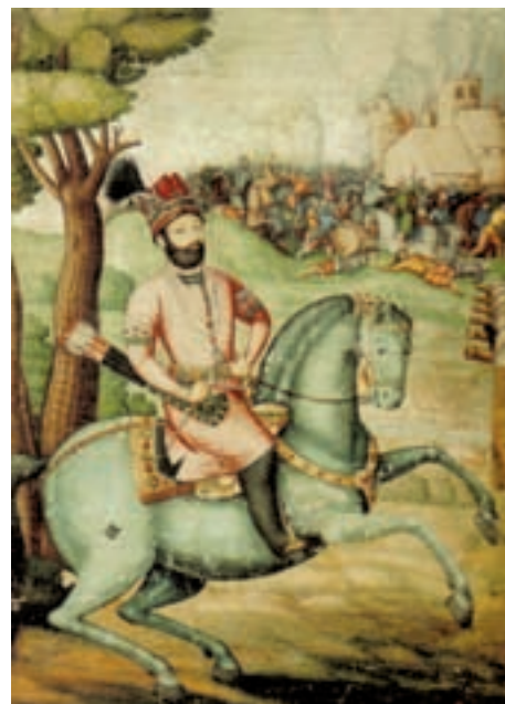
▲ شکل ۱-۱۳ الف — نادرشاه افشار، اثر علی بن عبدالبیگ علی قلی جبه دار