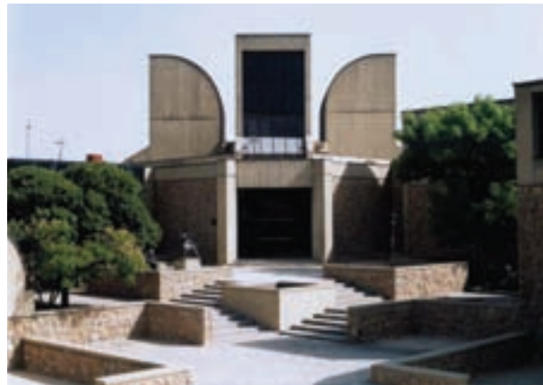
▲ شکل ۹-۱۴ د- موزه هنرهای معاصر، تهران، کامران دیبا