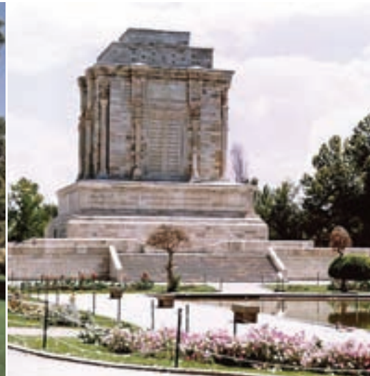
الف — مقبره فردوسی، توس، مشهد، آندره گدار