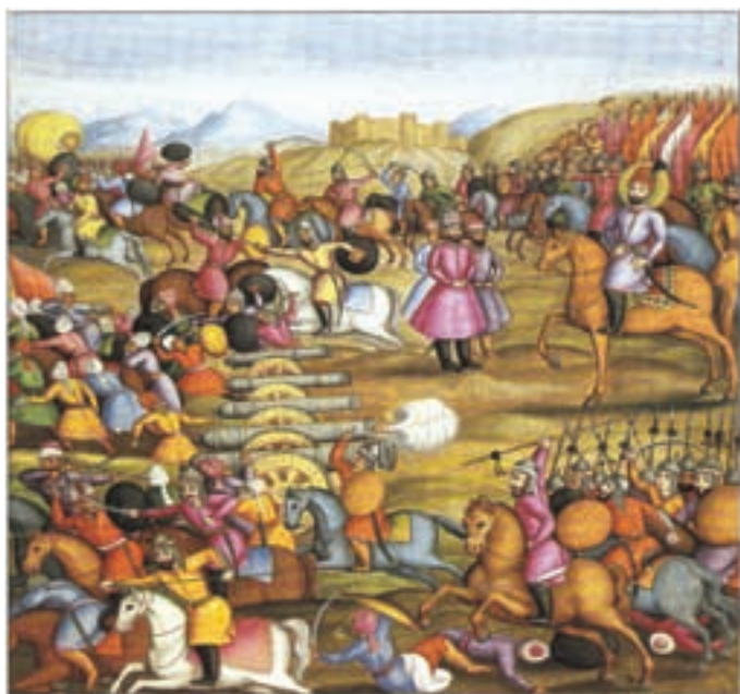
▲ شکل ۱-۱۳ ب — تصویری از کتاب تاریخ جهانگشای نادری (جنگ نادر با اشرف افغان)، ۱۱۷۱ هـ