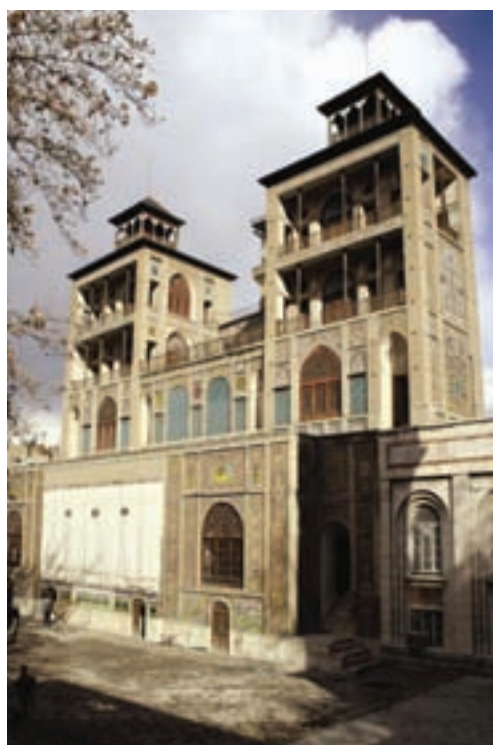
▲ شکل ۹-۱۳ عمارت قاجاری