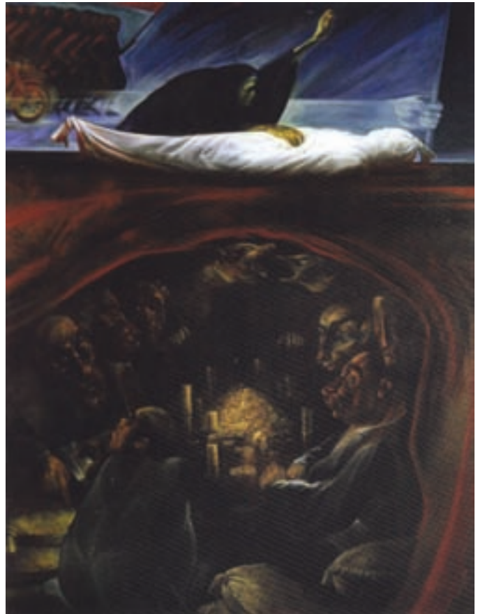
▲ شکل ۱۲-۱۴ الف - نقاشی رنگ و روغن، دوره معاصر