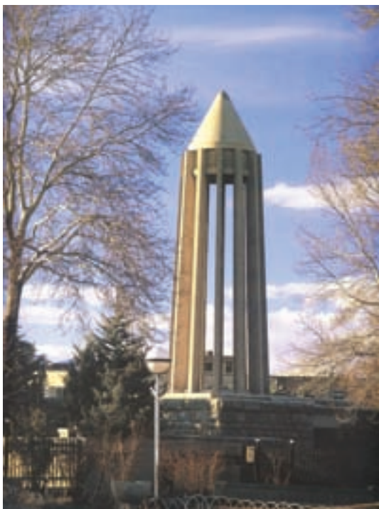
▲ شکل ۹-۱۴ ب- آرامگاه بوعلی سینا، همدان، هوشنگ سیحون