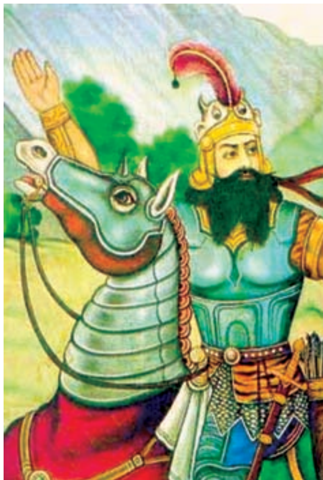
▲ شکل ۱۵-۱۳- نقاشی قهوه خانه ای