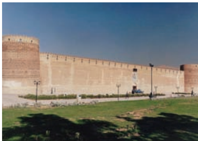
▲ شکل ۳-۱۳- ارگ کریمخان

منحصر به فرد و خاصی را در هنر پدید آورد که در زمینه نقاشی، معماری و دیگر هنرها شاخص باشد (شکل ۳-۱۳). نقاشی‌های دورهٔ زندیه که به «مکتب گل» شهرت یافته در بردارنده جنبه‌های مختلف با موضوعات متنوع و همچنین در بردارنده نقاشی‌های رنگ و روغنی با ابعاد بزرگ، نقاشی‌های لاکی و روغنی و گل و مرغ می‌باشد (شکل ۴-۱۳ الف و ب). تحول اساسی در این دوره را بیشتر می‌توان در شیوه‌های جدید هنری به‌ویژه نقاشی بر اشیاء مختلف از جمله قاب آینه، صندوقچه‌های جواهر و ... دید (شکل ۵-۱۳).