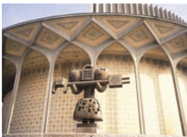
▲ شکل ۹-۱۴ ه- تئاتر شهر، تهران، علی سردار افخمی