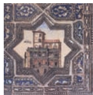
▲ شکل ۷-۱۳ کاشیکاری قاجاری