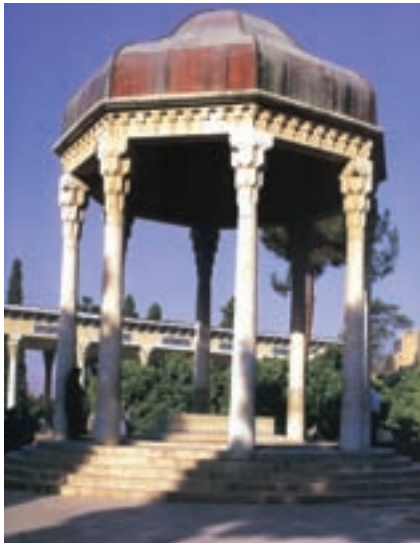
ج — حافظیه، شیراز، آندره گدار