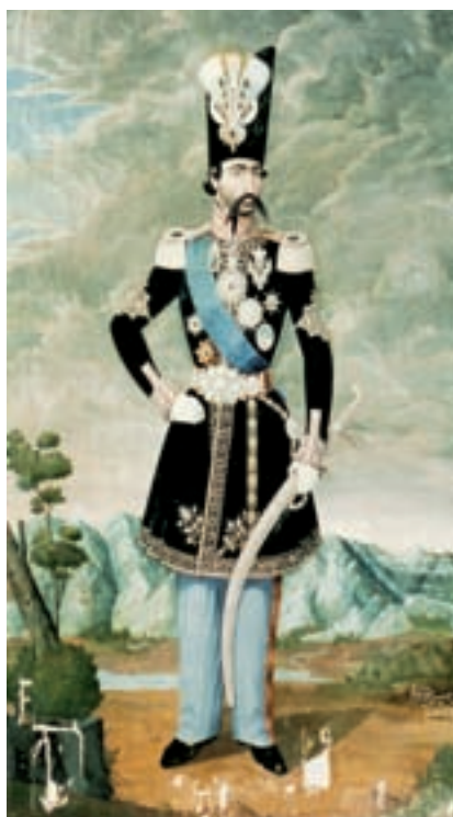
▲ شکل ۸-۱۳ چهره ناصرالدین شاه