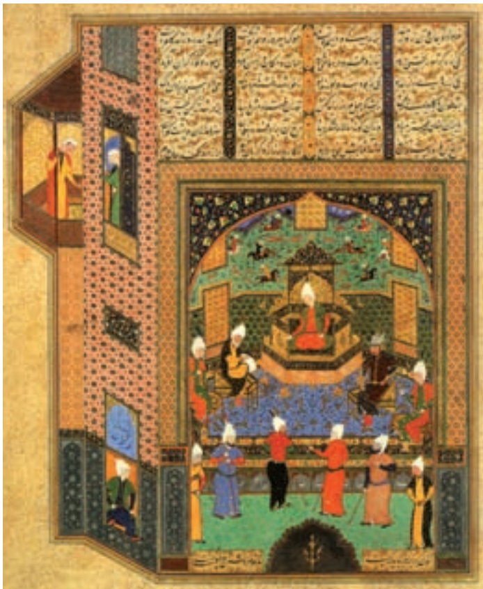
مجلس بحث فقها، اثر کمال الدین بهزاد مکتب هرات ۸۹۴ هجری قاهره، کتابخانه‌ی سلطنتی مهر