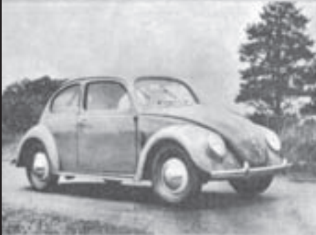
Volkswagen (VW), 1951, 25 PS, 105 km/h, Verbrauch: 7,5 l