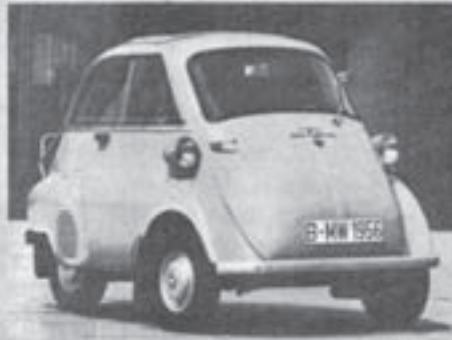
BMW Isetta, 1956, 12 PS, 85 km/h, Verbrauch: 5,5 l