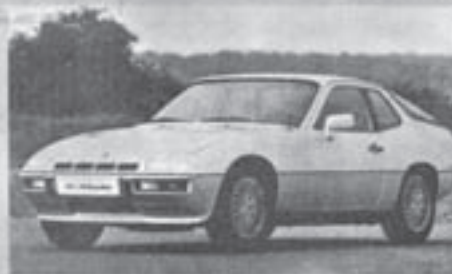
Porsche 924 Turbo, 1979, 170 PS, 230 km/h, Verbrauch: 14 l