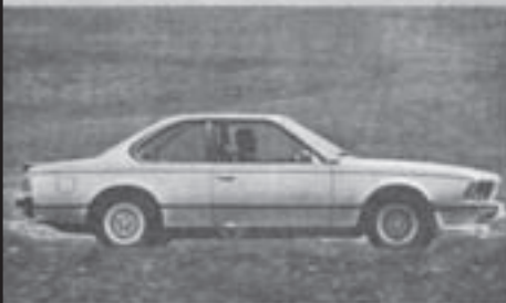
BMW 635 CSi, 1977, 218 PS, 220 km/h, Verbrauch: 10 l