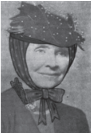
Mme Helen Keller

Elle m'a appris à utiliser l'alphabet manuel. Par exemple, un jour elle m'a donnée de l'eau et, dans ma main, elle a écrit avec son doigt le mot e-a-u; alors j'ai compris que cette chose fraîche, cette chose amie, était e-a-u. J'ai surtout compris que si j'apprenais à écrire sur les mains des autres, je pourrais communiquer avec eux..."