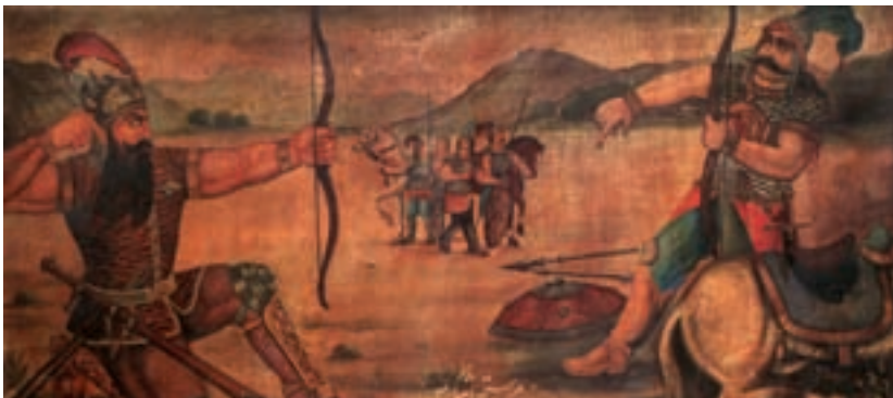
رزم رستم و اشکبوس رنگ و روغن منسوب به حسن اسماعیل زاده