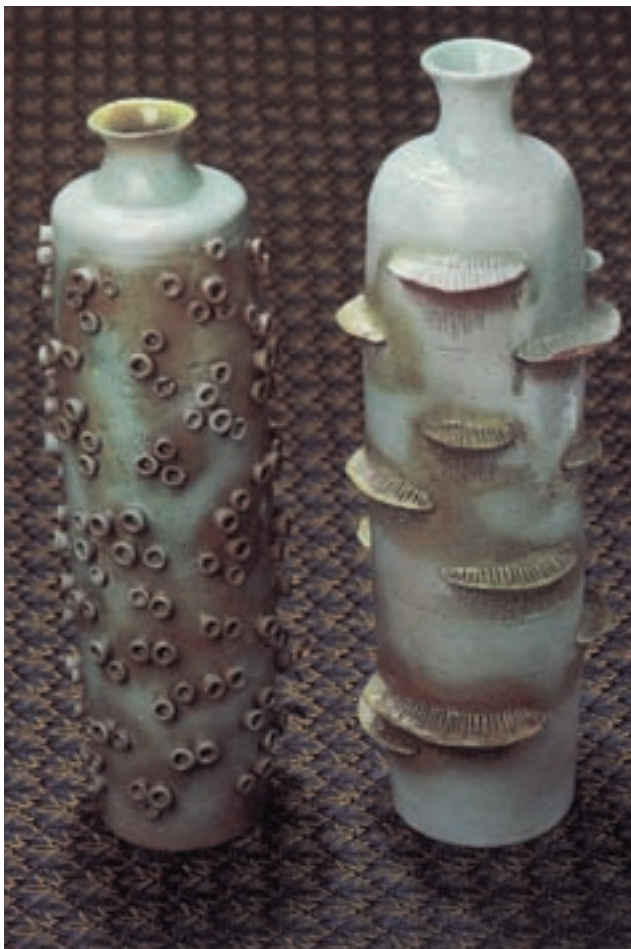
شکل ۱۰-۴ ب - تزیین بدنه‌ی سفالی به روش نقش افزوده

۱-۲- شیوه‌ی نقش‌افزوده: قطعه‌ای از خمیر گل را مطابق طرح روی بدنه‌ی خام (پیش از خشک شدن) می‌افزایند (شکل ۱۰-۴-ب).