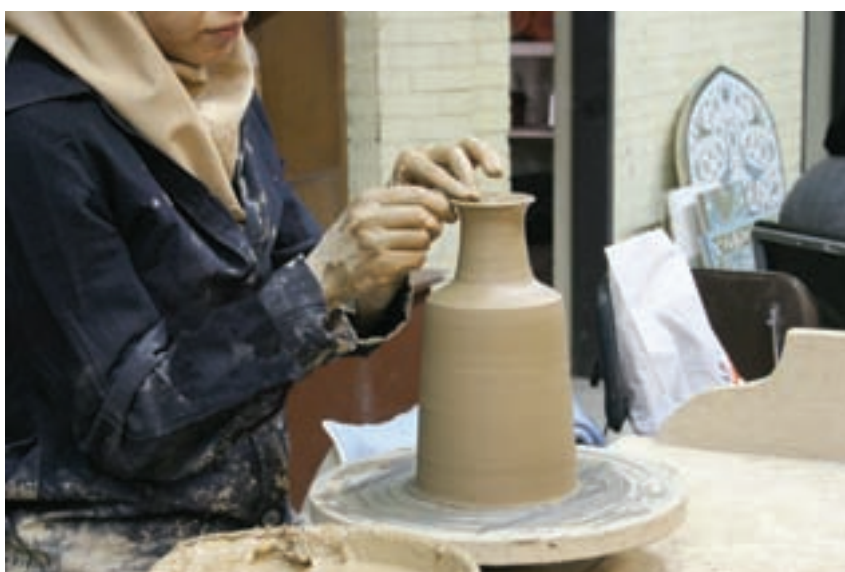
شکل ۸-۴ ز - شکل دادن لبه