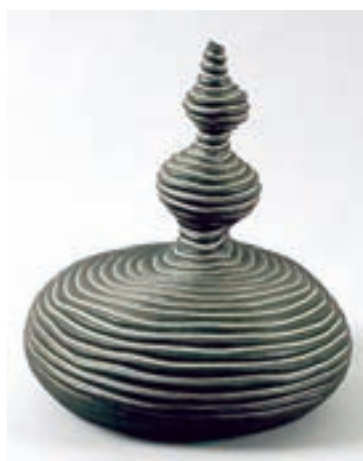
شکل ۷-۴-ج - شیء دست ساز به روش فتیله ای