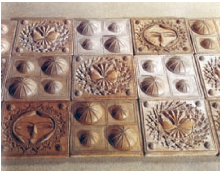
شکل ۴-۲ الف - خشت‌های نقش برجسته سفالی قالبی

هدف و کاربرد: گروهی از آثار سفالینه همواره ظروف مناسبی برای نگهداری مواد خوراکی بوده‌اند و گروهی دیگر به