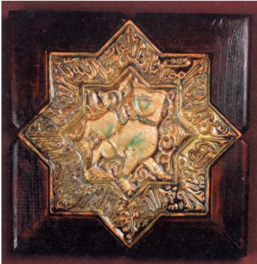
شکل ۹-۴- خشت شکل داده شده به روش فشاری در قالب

یادآوری: برای ساخت برخی از اشیای سفالی می‌توان از یک یا چند روش شکل‌دهی استفاده کرد که به آن «شکل‌دهی ترکیبی» می‌گویند.