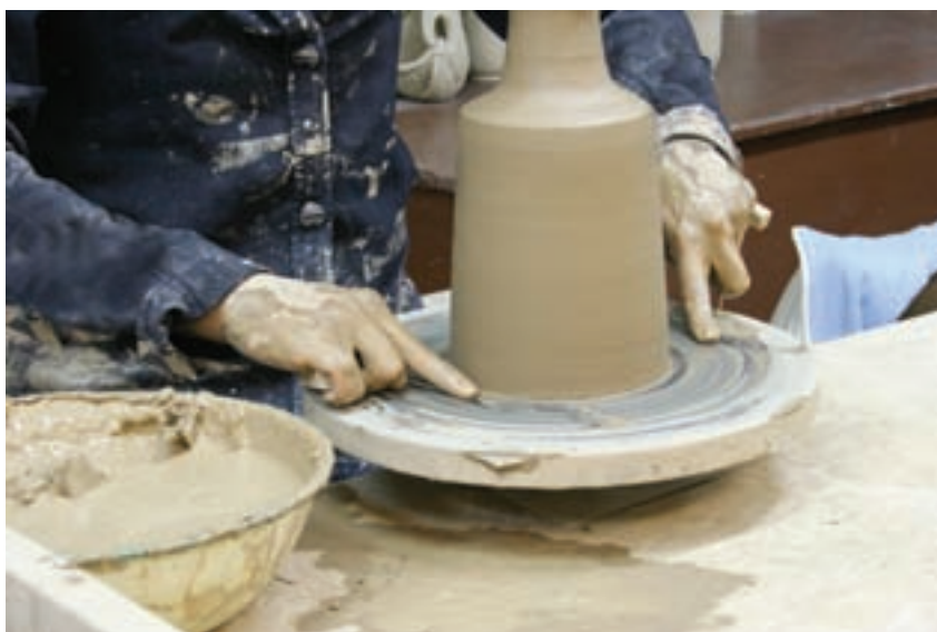
شکل ۸-۴-ط — بریدن ظرف ساخته شده با سیم یا نخ از روی صفحه