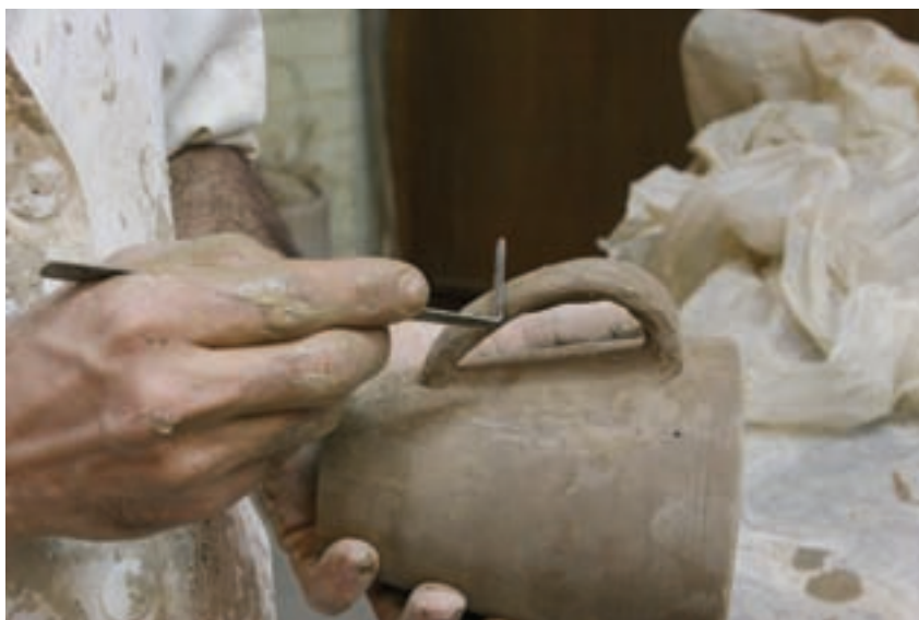
شکل ۸-۴-ک — اضافه کردن اجزای دیگر (لوله، دسته و ...)