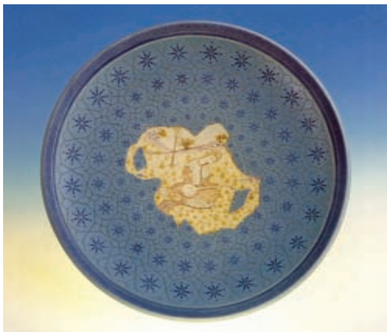
شکل ۱۱-۴-الف - تزئین به روش رو رنگی و زیر رنگی