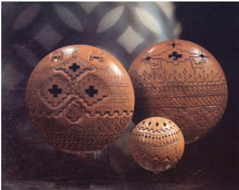
شکل ۱۰-۴-ج - تزئین بدنه ی سفالی به روش نقش بریده

۱-۳ - شیوهی نقش بریده: پیش از خشک شدن بدنه (چرمینه) قسمتی از بدنه را مطابق طرح بریده و جدا می کنند به گونه ای که زمینه ی شیء مشبک شود (شکل ۱۰-۴-ج).