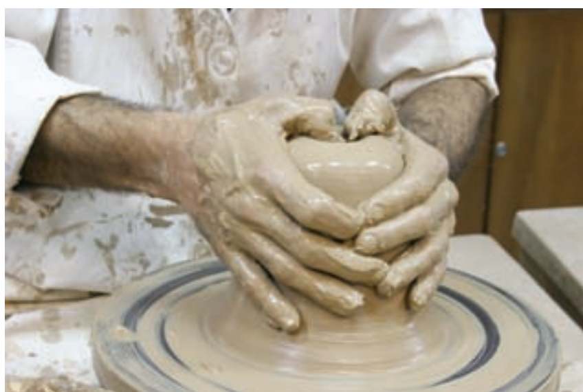
شکل ۸-۴-د - ایجاد حفره اولیه