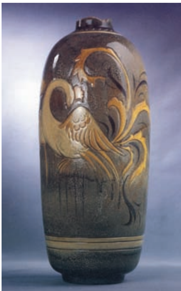
شکل ۱۱-۴ ج- تزیین به روش زیر رنگی

– اگر اطراف طرح و نقش‌ها را بر روی بدنه‌ی سفال با رنگ سیاه قلم‌گیری کنند و سپس با لعاب‌های متفاوت داخل آن‌ها را رنگ آمیزی کرده و در کوره بپزند به این روش تزیین «هفت‌رنگی» می‌گویند (شکل ۱۲-۴).