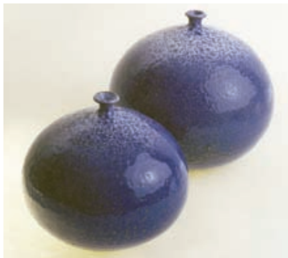
شکل ۳-۴- الف - اشیای سفالی مدور و قرینه (چرخ ساز)

بدنه‌های سفالی به صورت خام و یا پخته، هر کدام دارای ویژگی خاصی برای تزیین هستند. نقوش برجسته (سه بعدی)