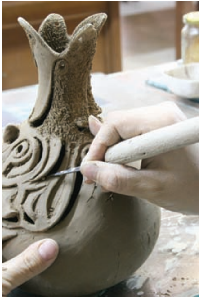
شکل ۱۰-۴ الف - تزیین بدنه‌ی سفالی به روش نقش‌کنده