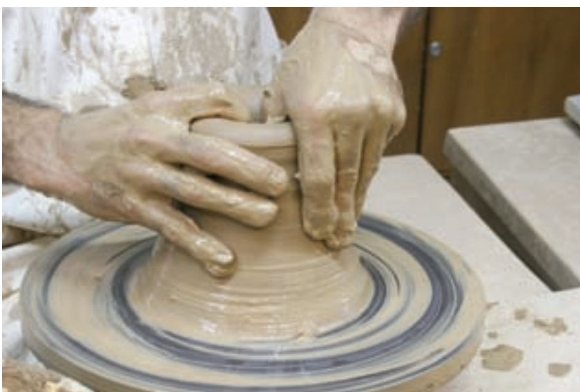
شکل ۸-۴-ه - بزرگ کردن حفره