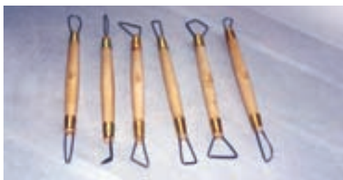
شکل ۴-۶ - برخی از ابزار تزئین بدنه ی گلی - ابزار بردارنده (کاهنده)

۳- ابزار و وسایل تزئین: در مرحله ی تزئین بدنه ها از ابزارهایی مانند صفحه گردان رومیزی، ابزار بردارنده (کاهنده)، تراش دهنده، برش دهنده، کاسه، اسفنج، رنگ پاش، قلم مو، تخته شستی، خط کش، مداد و پرگار، استفاده می شود (شکل ۴-۶).