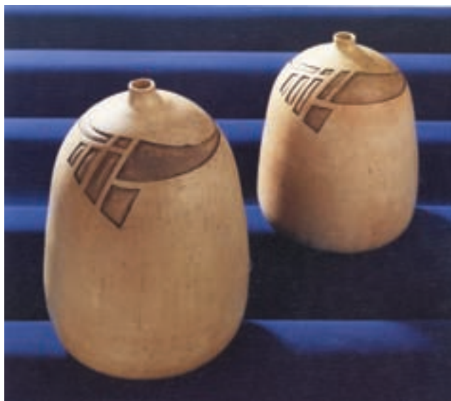
شکل ۴-۲ ج - ظروف سفالی