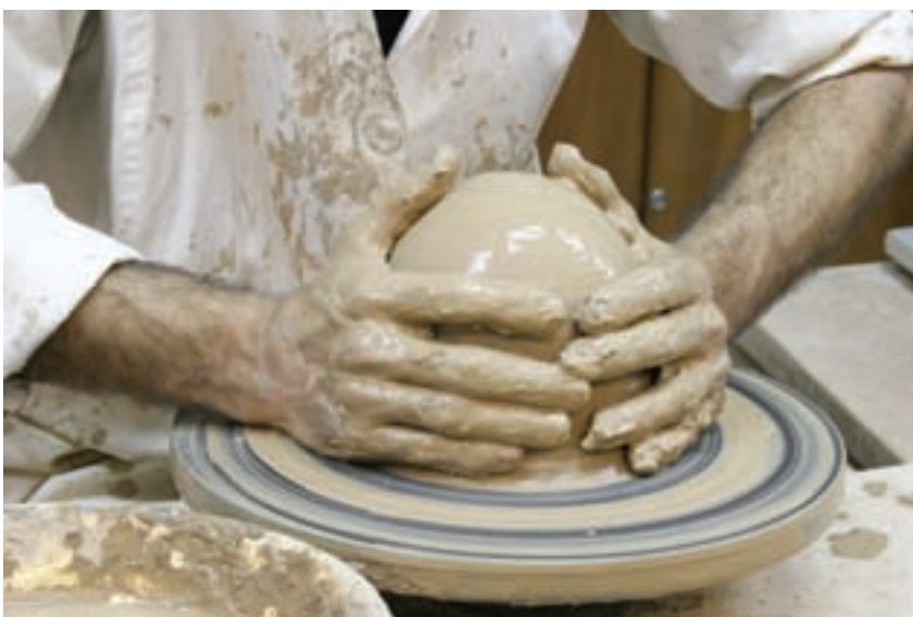
شکل ۸-۴-ج - هم مرکز کردن چانه با صفحه‌ی چرخ