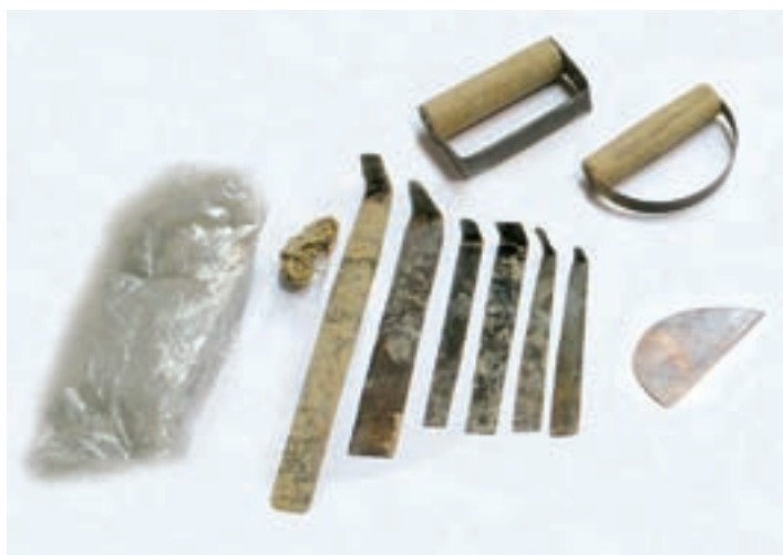
شکل ۴-۵ - ابزار و وسایل شکل دهی بدنه ی گلی

۲- ابزار و وسایل شکل دهی بدنه: چرخ سفالگری (پایی یا برقی)، میز کار، ورقه های فلزی شکل دهنده، تراش دهنده و سایر ابزار جانبی مانند کاردک، اسفنج، سوزن (یا درفش)، مفتول سیمی، وردنه و ورقه یا کیسه ی نایلون از جمله ابزار و وسایل شکل دهی بدنه سفال می باشند (شکل ۴-۵).