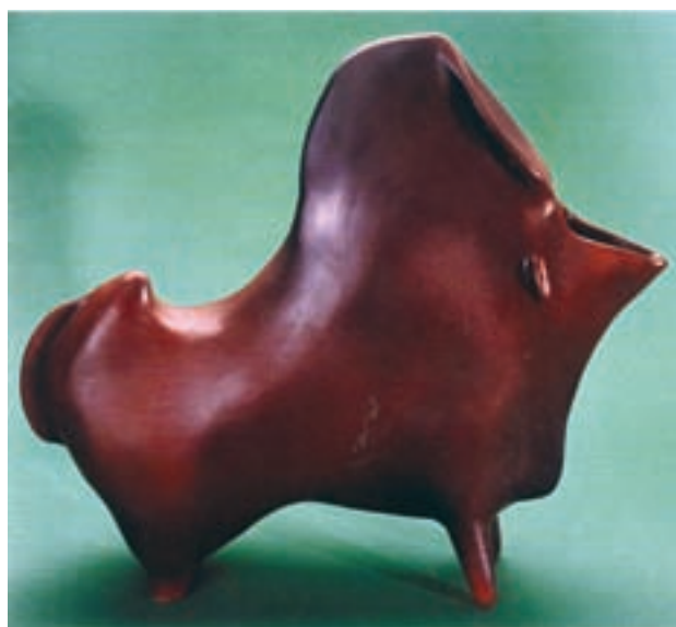
شکل ۴-۲ ب - پیکره سفالی