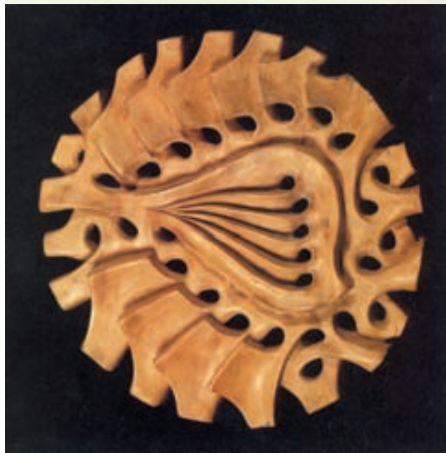
شکل ۳-۴- ب - اشیای سفالی دست‌ساز