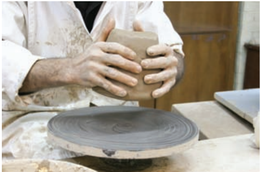
شکل ۸-۴- الف- قرار دادن چانه بر مرکز صفحه‌ی چرخ

۲-۹- شیء را به تدریج خشک می‌کنند و سپس در کوره می‌پزند (شکل ۸-۴).