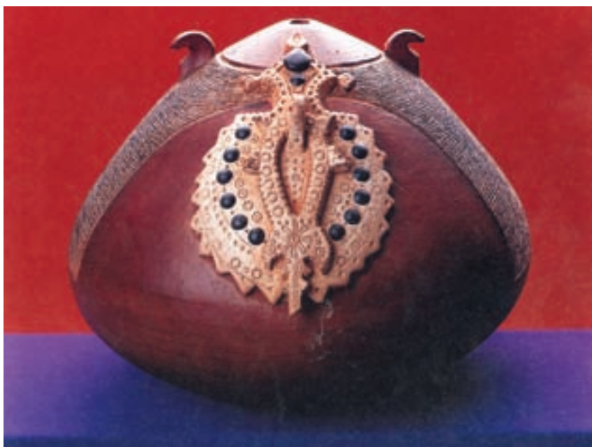
شکل ۳-۴-ج- شیء سفالی با نقوش برجسته