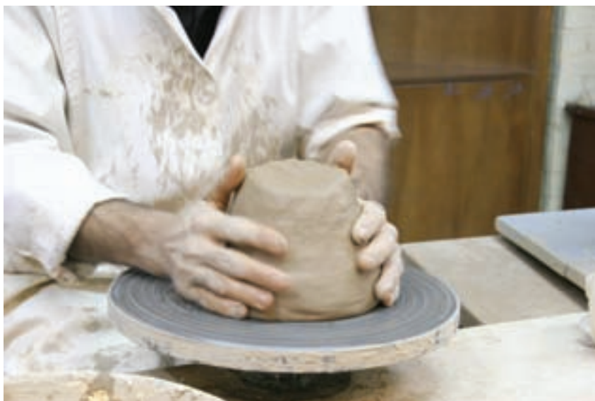
شکل ۸-۴- ب- محکم کردن چانه بر مرکز صفحه