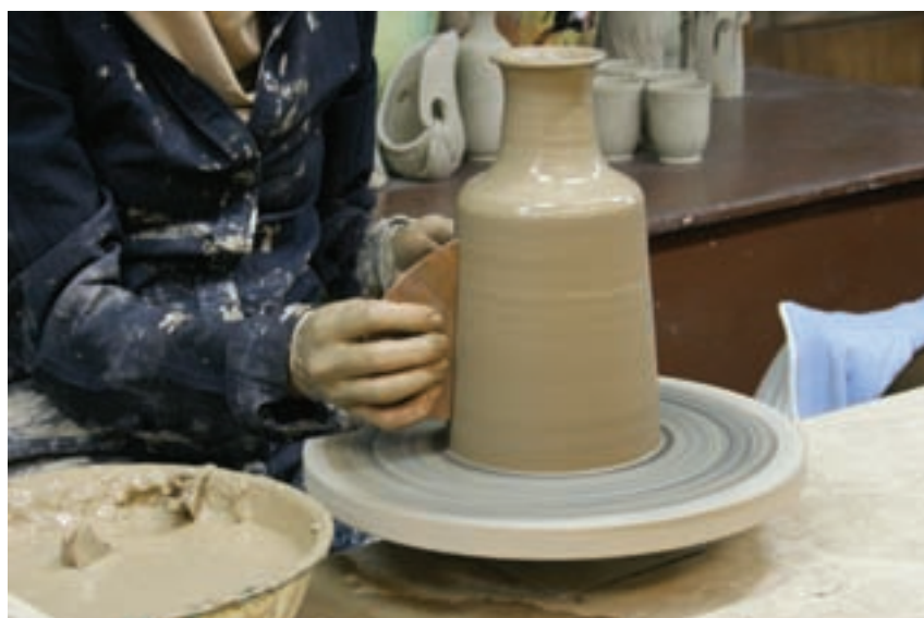
شکل ۸-۴ ح - پرداخت و شکل دادن با ابزار