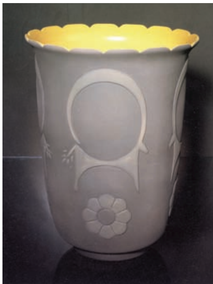
شکل ۱۱-۴-ب - تزئین به روش یک رنگ