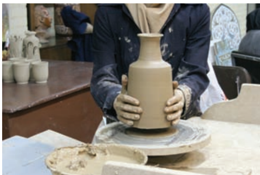
شکل ۸-۴-ی — برداشتن شیء گلی ساخته شده از روی چرخ