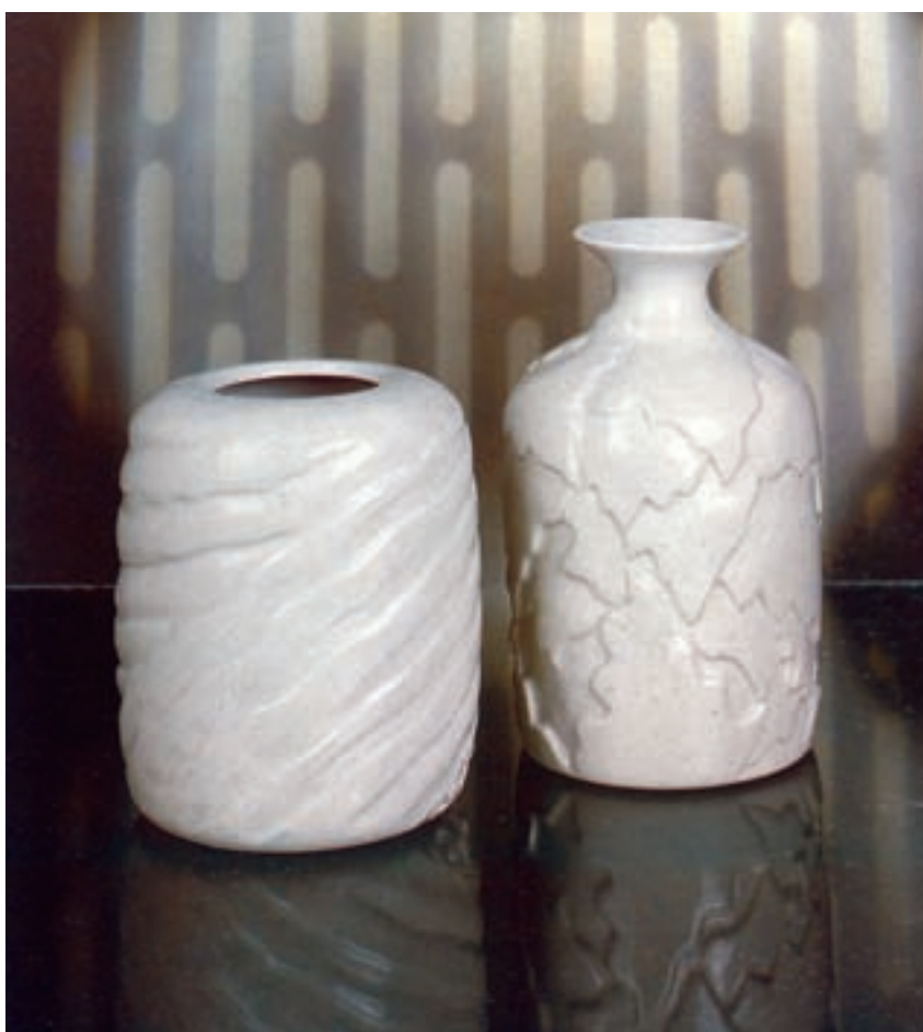
شکل ۳-۴-د- ظروف با نقش کنده و لعاب یکرنگ