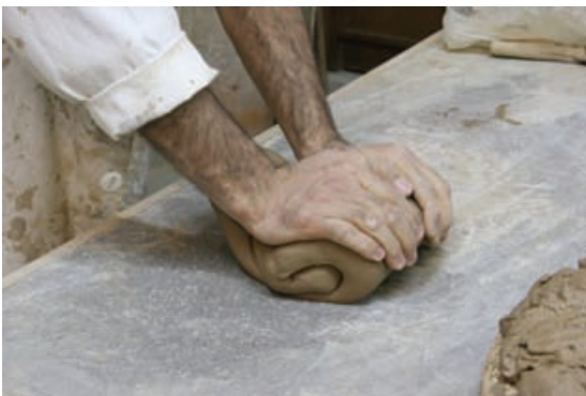
شکل ۷-۴-الف - ورز دادن گل