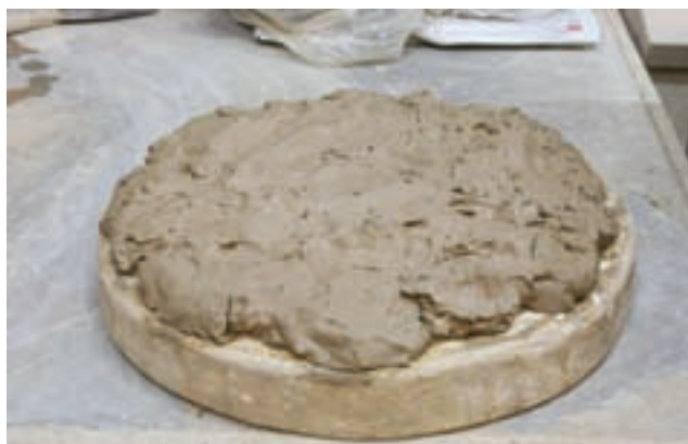
شکل ۴-۴ - صفحه ی چوبی و کاربرد آن در آماده سازی گل

آماده سازی خاک و گل نیاز به ابزار و وسایلی مانند: سطل، بیلچه، کاردک، گونی، پتک، صفحه ی چوبی، میز کار، لیسه، ظروف پلاستیکی، الک و ورقه نایلونی است (شکل ۴-۴).