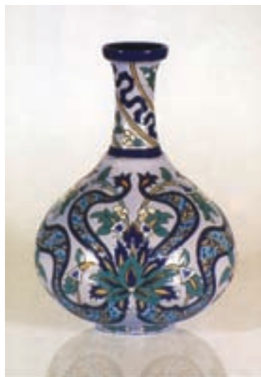
شکل ۱۲-۴- تزیین به روش هفت رنگ

– اگر اطراف طرح و نقش‌ها را بر روی بدنه‌ی سفال با رنگ سیاه قلم‌گیری کنند و سپس با لعاب‌های متفاوت داخل آن‌ها را رنگ آمیزی کرده و در کوره بپزند به این روش تزیین «هفت‌رنگی» می‌گویند (شکل ۱۲-۴).