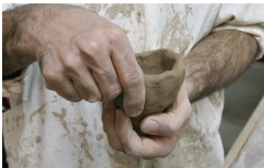
شکل ۷-۴-ب - شکل دادن گل با کمک دست به روش فشاری