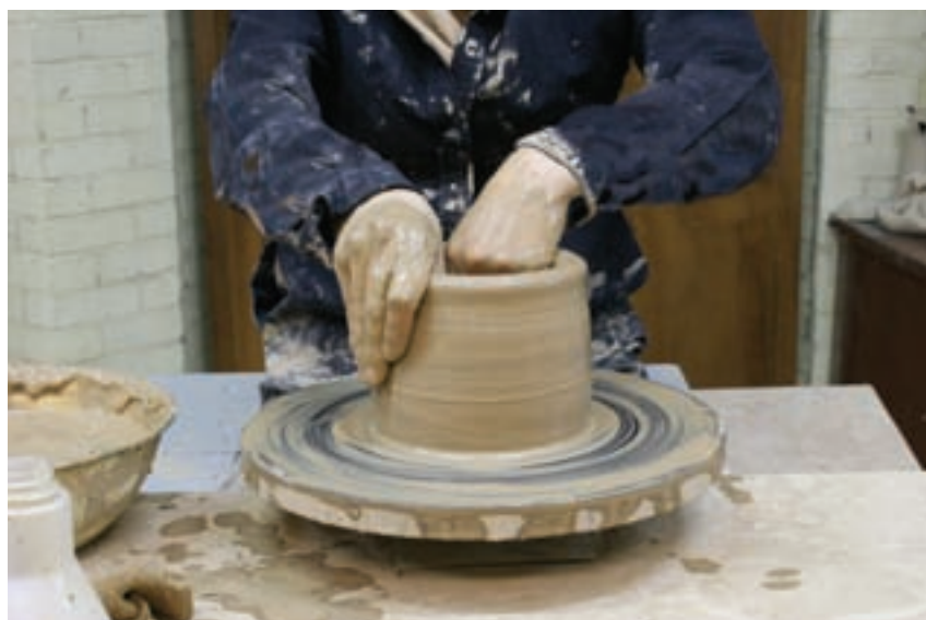
شکل ۸-۴ و - شکل دادن دیواره