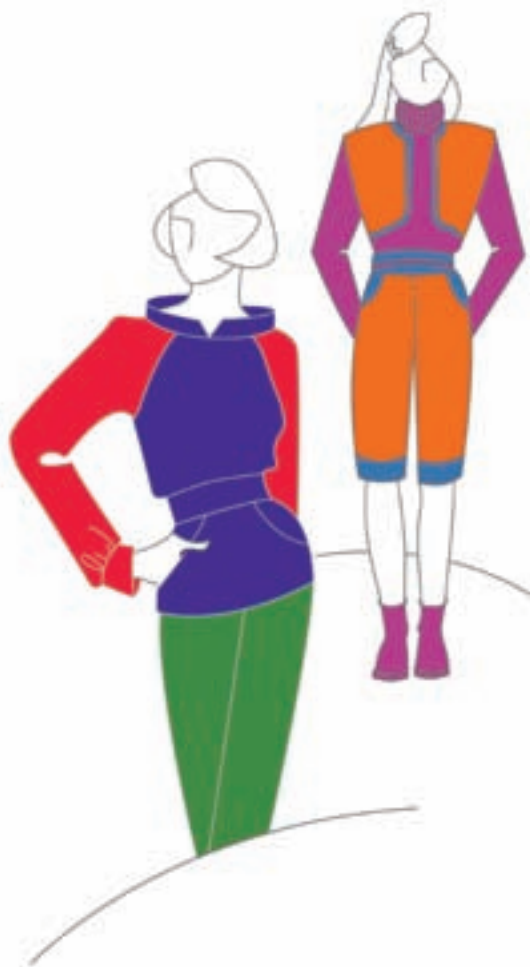
تصویر ۲-۳ - رنگ‌بندی مناسب لباس دخترانه

● رنگ‌های مناسب لباس دخترانه (نوجوان و جوان): رنگ‌بندی این‌گونه لباس‌ها فضایی گرم، پرشور و متنوع را طلب می‌کند مانند انواع زرد، قرمز، نارنجی و بنفش که بیشتر در مجاورت مکمل رنگی‌شان به کار برده می‌شوند (تصویر ۲-۳). برای مثال: همجواری قرمز بنفش در مجاورت سبز زرد