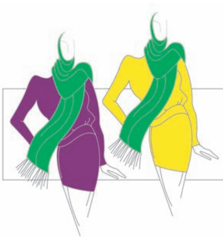
تصویر ۱-۴۷ - تغییر درجه‌ی تاریکی و روشنی و تأثیر متقابل رنگ‌ها