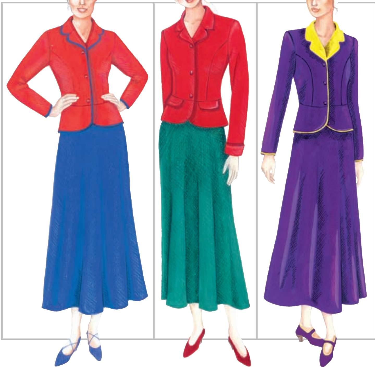
تصویر ۱-۴۰ - تناسبات و تضاد وسعت رنگ‌های مکمل