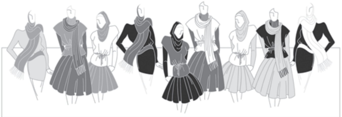
تصویر ۱-۵۲ - ترکیب بندی بر اساس رنگ های بی فام