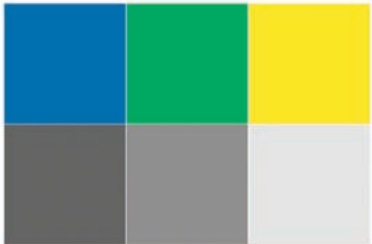
تصویر ۱-۴۲ - استفاده از درجه‌ی تیرگی میانی در ساخت رنگ میانی