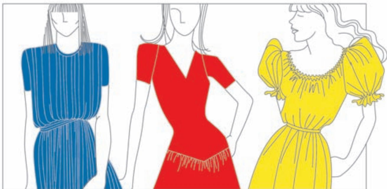
تصویر ۱-۵۰ - عدم تطابق شکل و رنگ

توضیح: تأثیر متقابل رنگ و شکل: اضافه شدن هر رنگ به هر شکل (به جز مطابقت رنگ و شکل)، باعث می شود که خصوصیات رنگ ها و شکل ها با یکدیگر ترکیب شود. در نتیجه، رنگ و شکل با هم می توانند مجموعه ای جدید از لحاظ خصوصیات ایجاد کنند. به طور مثال، اگر رنگ قرمز را به دایره اضافه کنیم که شکلی معلق، سبک و سرد است، به آن خصوصیات سنگینی، استحکام و گرمی می بخشیم (تصویر ۱-۵۰).