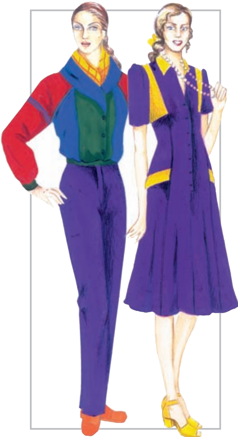
تصویر ۱-۳۸ — همجواری رنگ‌های مکمل بدون توجه به قانون مندی وسعت تضاد وسعت رنگ‌های مکمل

در همجواری رنگ‌ها با وسعت‌های گوناگون، باید به این نکته توجه داشت که تعداد رنگ‌ها هرچند که باشد به این منظور است که بتواند با تناسبات وسعت رنگ، چشم را به یک تعادل زیبا و کامل برساند. البته این عمل از سوی طراح انجام می‌پذیرد (تصاویر ۱-۳۷ و ۱-۳۸).