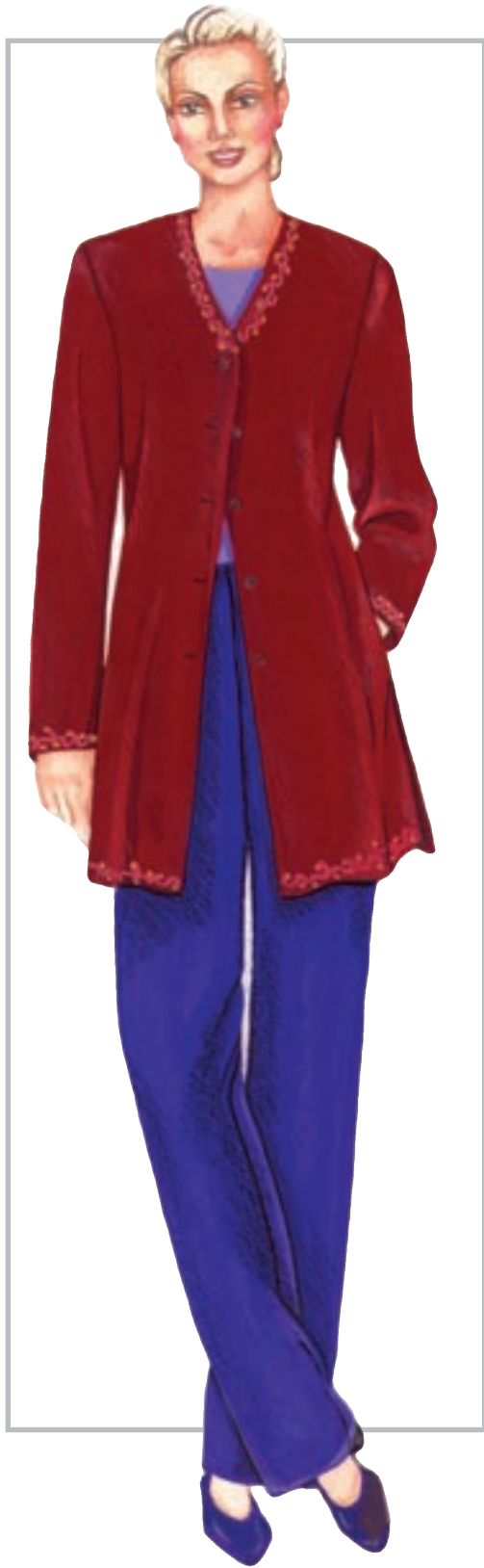
تصویر ۱-۶۱ ترکیب بندی بر اساس رنگ های سرد و گرم

ترکیب بندی بر اساس رنگ های سرد و گرم این رنگ ها شامل تنوع ترکیب بندی های زیر می گردند : * ترکیب بندی رنگ های صرفاً گرم (تصویر ۱-۶۰ الف).