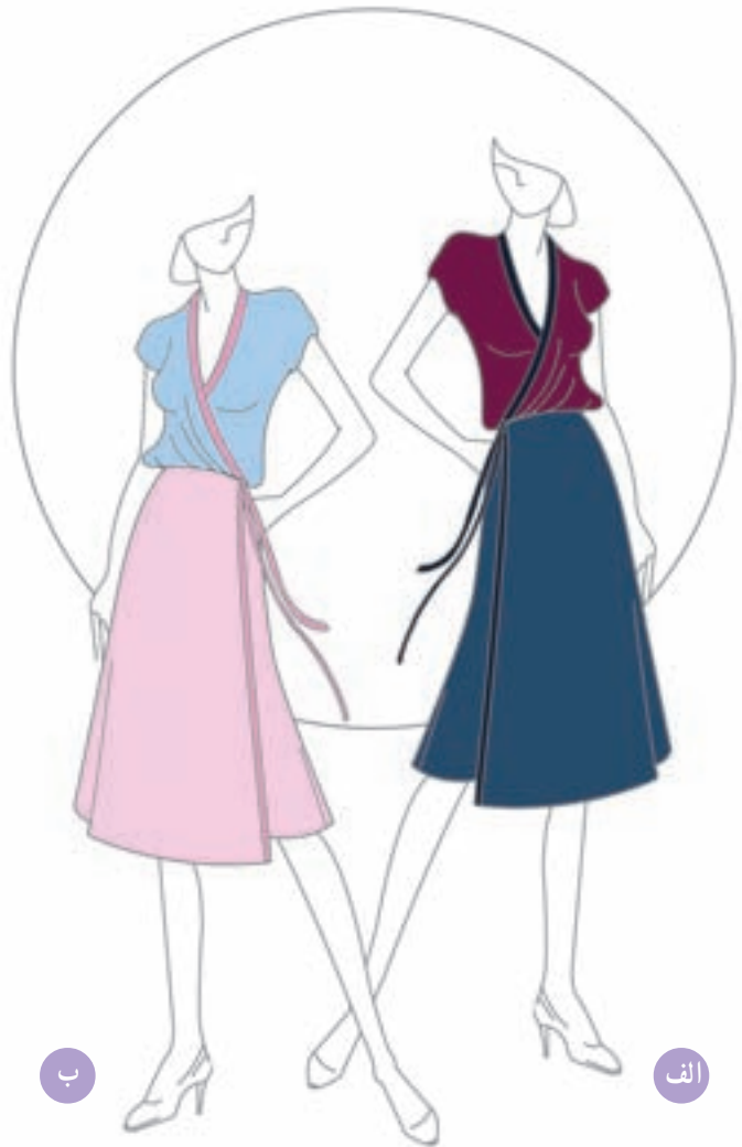
تصویر ۱-۵۹ - ترکیب بندی بر اساس رنگ های تیره و روشن