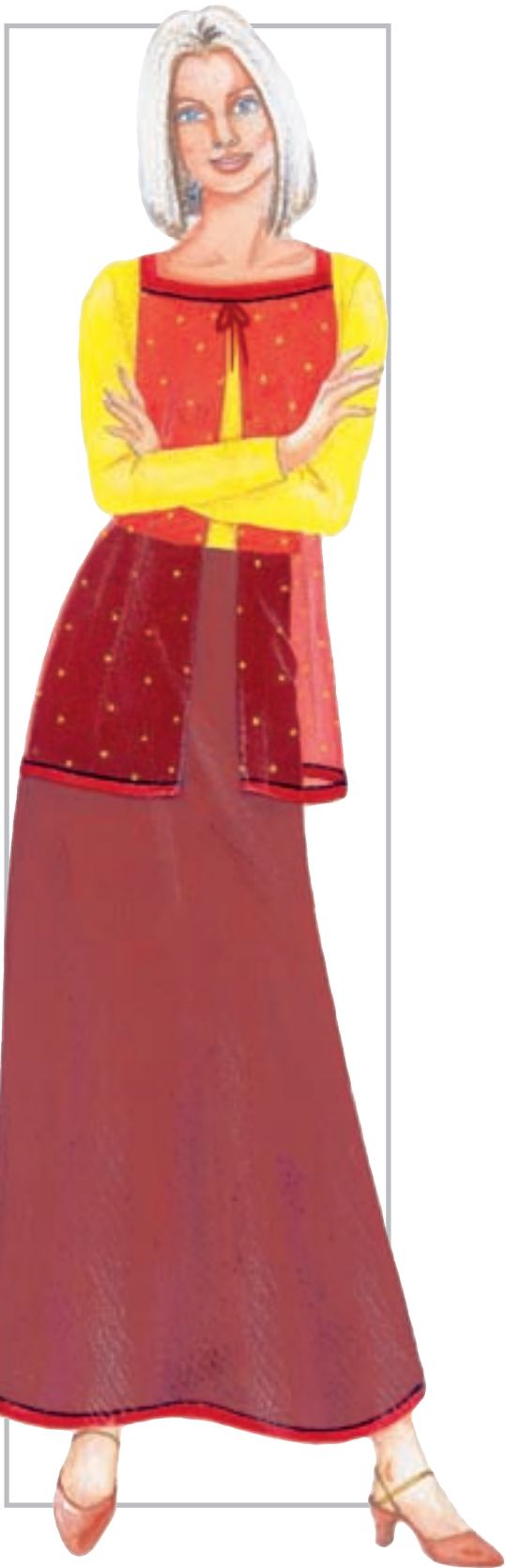
تصویر ۱-۵۱ - رعایت و تلفیق چند قانون مختلف رنگی