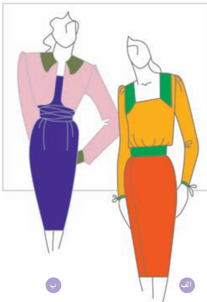
تصویر ۱-۵۶ - الف - ترکیب بندی براساس رنگ های اشباع ب - ترکیب بندی براساس رنگ های غیر اشباع

* ترکیب بندی رنگ های اشباع و غیر اشباع (تصویر ۱-۵۷).