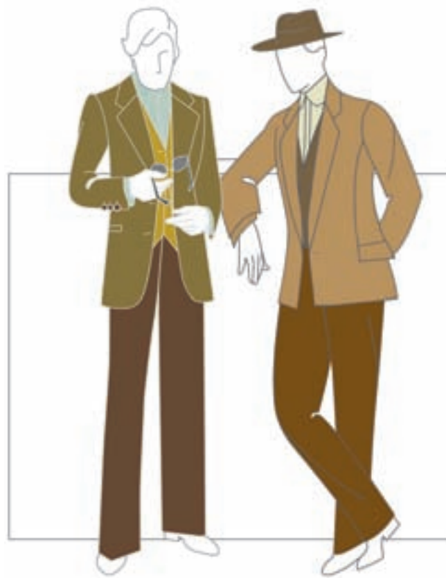
تصویر ۲-۶ - رنگ بندی مناسب لباس مردانه

● رنگ های مناسب لباس مردانه: رنگ بندی این گونه