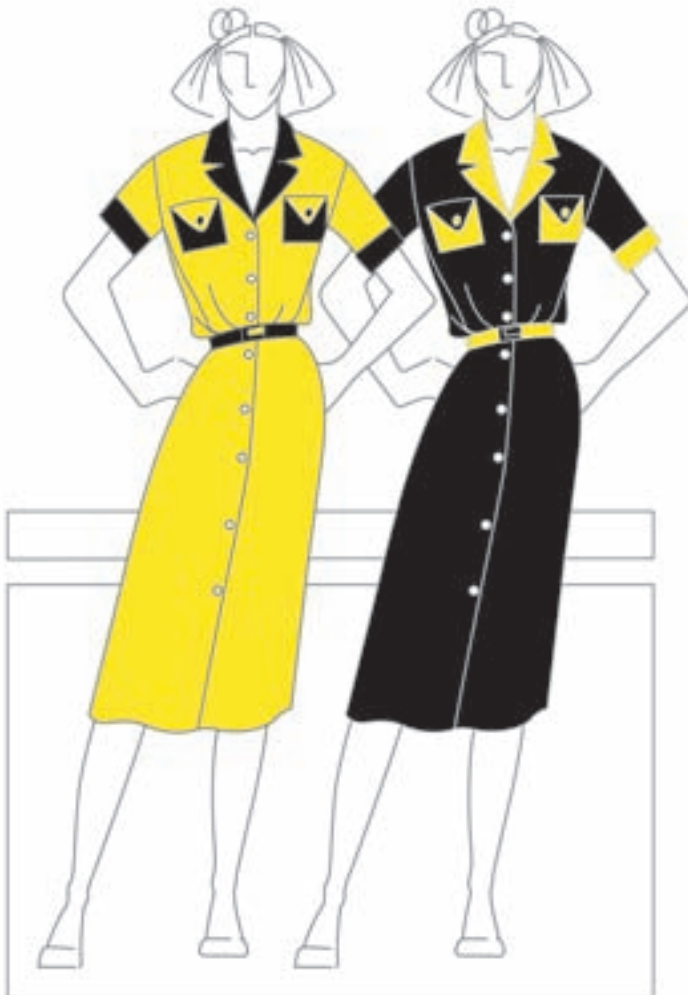
تصویر ۴۵-۱-الف - تغییر وسعت مجازی رنگ‌ها

تأثیر متقابل رنگ‌ها می‌تواند با تکیه بر بیان و مفاهیم رنگی