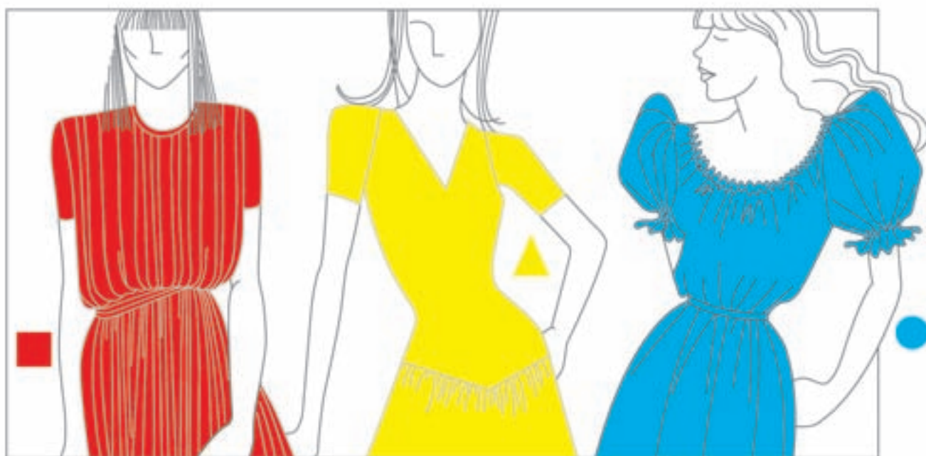
تصویر ۱-۴۹ - کاربرد رنگ‌های اصلی در سه شکل اصلی

ایتن معتقد است در مقابل سه رنگ اصلی، سه شکل اصلی نیز وجود دارد. بدین صورت که رنگ قرمز با مربع، رنگ آبی با دایره و رنگ زرد با مثلث مطابقت دارد و رنگ‌های ترکیبی چرخه‌ی رنگ، با شکل‌های ترکیبی مطابقت می‌نمایند (تصویر ۱-۴۹).