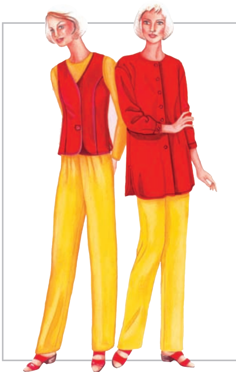
تصویر ۱-۳۶ - تضاد وسعت رنگی هم‌خانواده (گرم)

هرگاه مابین اندازه‌ی سطوح رنگ‌ها (مساحت رنگ‌ها) اختلافی به‌وجود آید تضادّ وسعت رنگی پدیدار می‌شود. تضاد وسعت رنگی، ممکن است مابین رنگ‌های هم‌خانواده (تصویر ۱-۳۶) و نیز، رنگ‌های غیرهم‌خانواده و مکمل، وجود داشته باشد. گفتنی‌ست که درجه‌ی تضاد وسعت رنگی تغییرپذیر باشد.