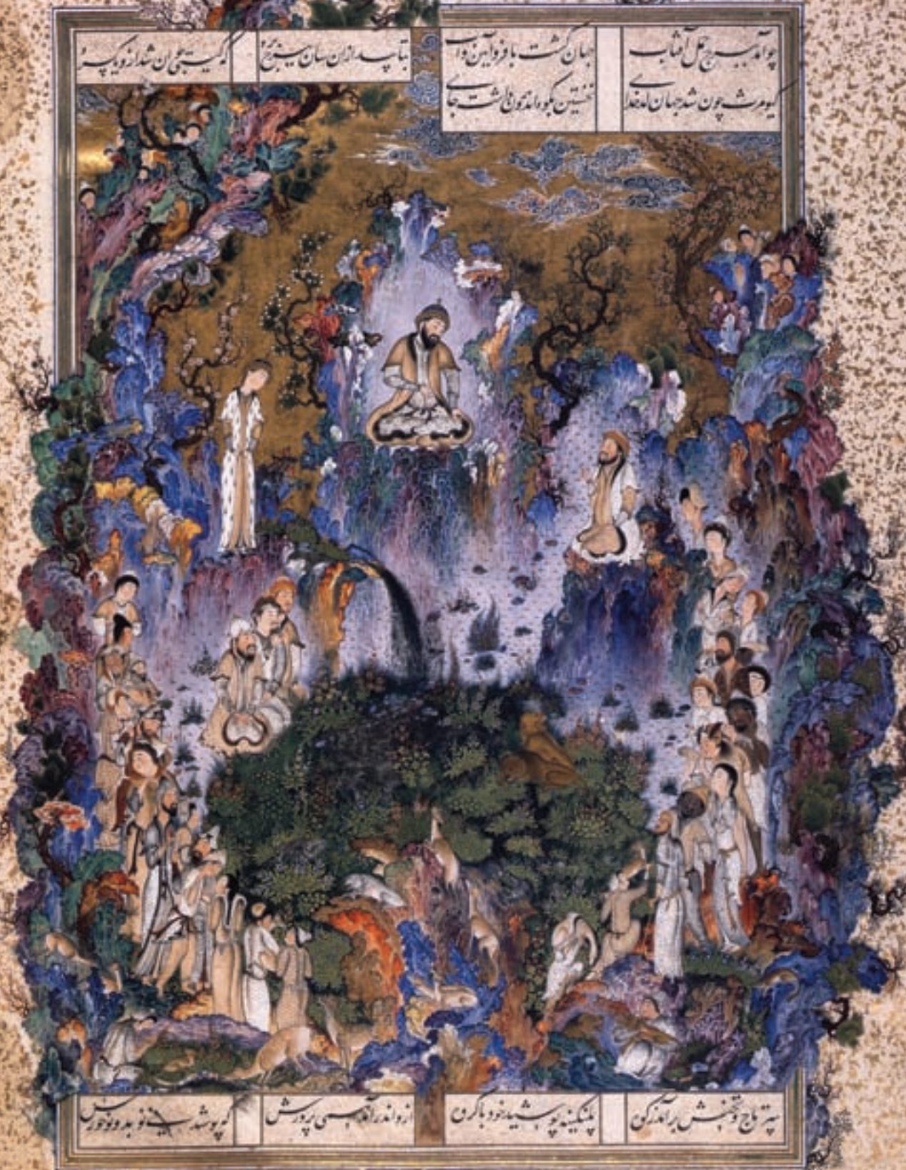
تصویر ۵- بارگاه کیومرث اولین شاه، شاهنامه شاه طهماسب، اثر سلطان محمد، مکتب تبریز در دوره دوم، قرن دهم هجری، مجموعه خصوص، زنو