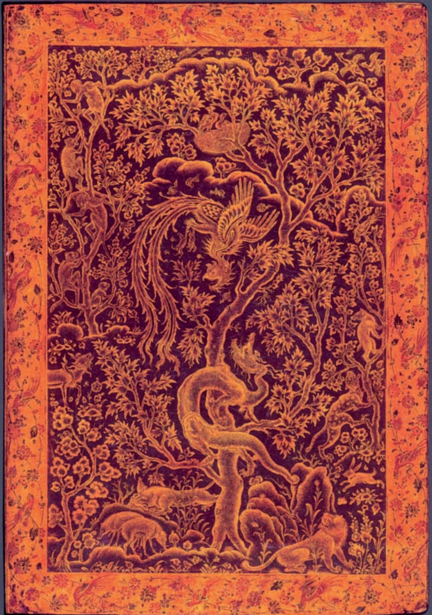
تصویر ۸- گرفت و گیر سیمرخ و ازدها، جلد روغنی (اندرونی)، احسن الکبار، سال ۸۳۷ هجری قمری، کاخ گلستان