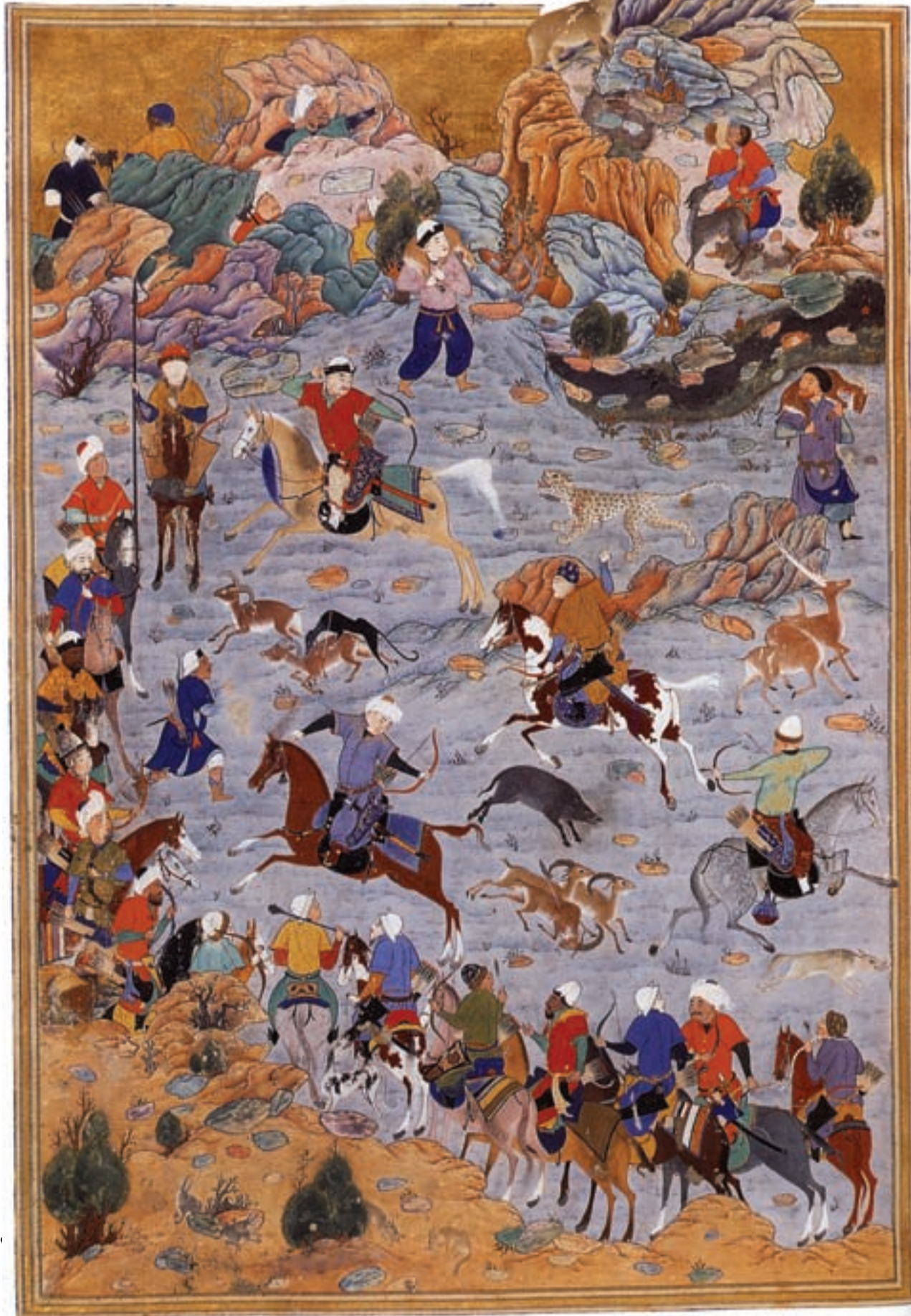
تصویر ۲ - هشت بهشت، شیوا بهزاد، مکتب هرات، قرن نهم هجری، موزه توپ کاپی