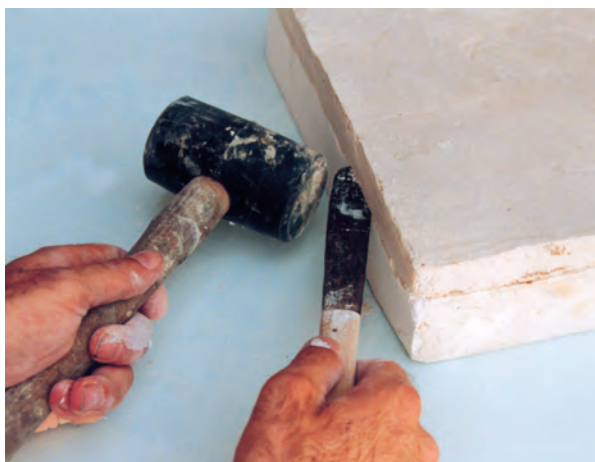
تصویر ۳-ب- جدا کردن نمونه و قالب با کاردک و چکش پلاستیکی