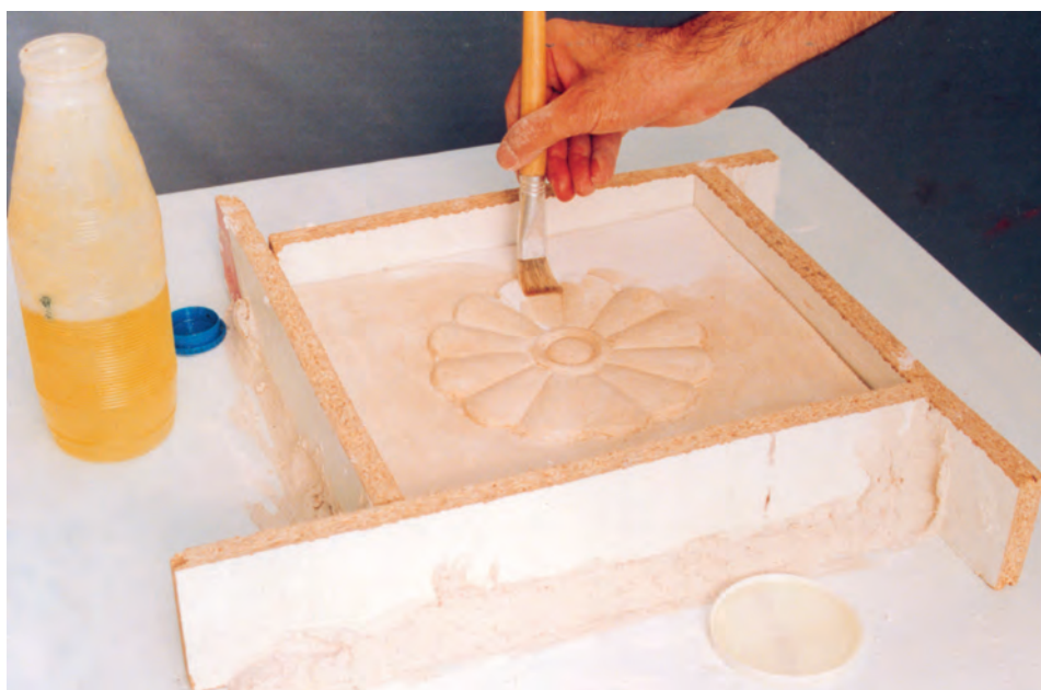
تصویر ۲- ب - آغشته نمودن سطوح داخلی دیواره و نمونه با مواد جداکننده