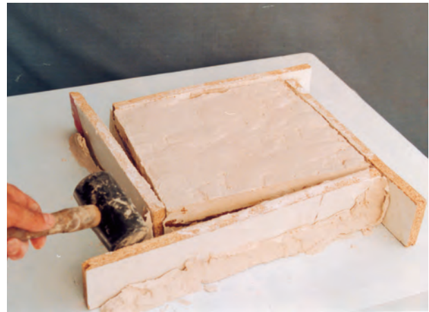
تصویر ۲- ه- جدا کردن دیواره‌ها

کنیم. باید توجه داشت که ضربه باعث پریدن لبه‌های دو قطعه نشود. سپس سطوح بیرونی قالب را پرداخت کرده با آب و قطعه‌ای ابر شستشو می‌دهیم تا کاملاً تمیز شود. به این ترتیب قالب برای تکثیر، آماده می‌شود (تصویر ۳- الف تا د).