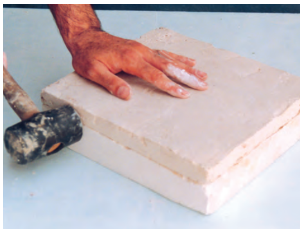
تصویر ۳-الف- جدا کردن نمونه و قالب با ضربه‌های ملایم چکش پلاستیکی