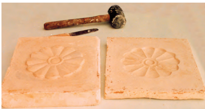
تصویر ۳-د- قالب آماده شده