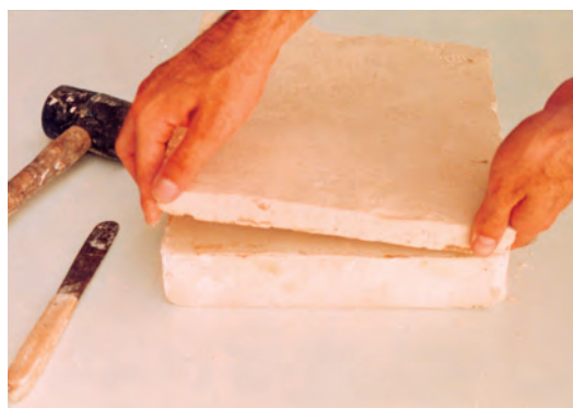
تصویر ۳-ج- برداشتن قالب از روی نمونه

به راحتی از آن جدا می‌شود. تعداد تقسیمها می‌تواند از دو تا چند قسمت باشد. ساخت قالب چندتکه به تجربه و دقت زیاد نیاز دارد.