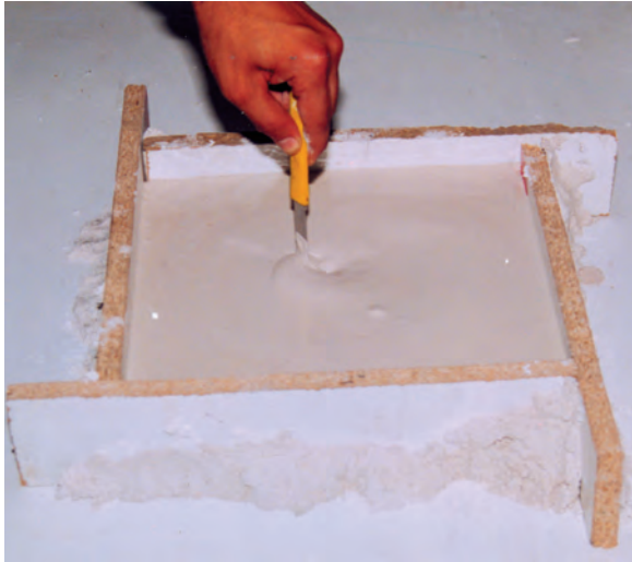
تصویر ۲- د- خارج کردن هوا از دوغاب گچی