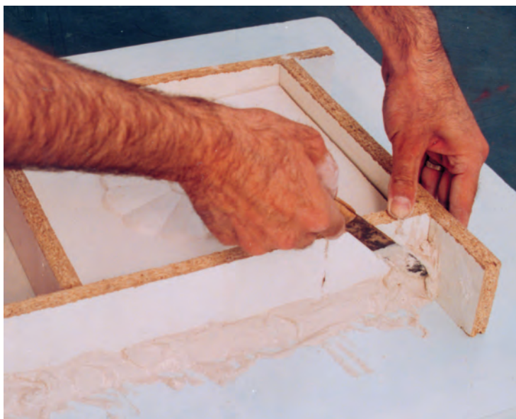
تصویر ۲- الف - ساختن دیواره در اطراف نمونه

مواد جدا کننده، آغشته می‌کنیم تا پس از قالبگیری به راحتی از هم جدا شوند. سپس در فضای خالی روی نمونه دوغاب گچی ۱ می‌ریزیم. صبر می‌کنیم تا دوغاب شروع به گیرش کند. در این مرحله مقداری حرارت ایجاد می‌شود که نشانه گیرش است. وقتی دوغاب گچی کاملاً سفت شد و حرارت خود را