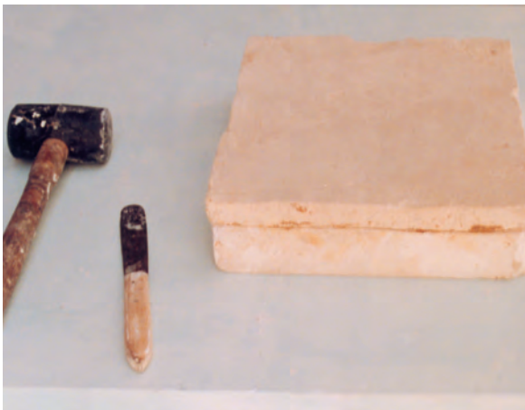
تصویر ۲- و- خشک کردن نمونه و قالب با هم