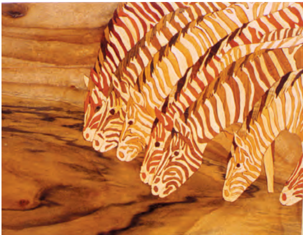
تصویر ۲-۲-۴- معرق زمینه چوب یک تکه - تابلو

از نظر ظاهری این شیوه و شیوه جایگزینی گاهی شبیه هم هستند ولی از نظر شیوه اجرا متفاوتند زیرا در شیوه جایگزینی زمینه خود زیرساخت است در حالی که در این شیوه قطعات زمینه و متن هر دو به روی زیرساخت چسبانیده می‌شوند.