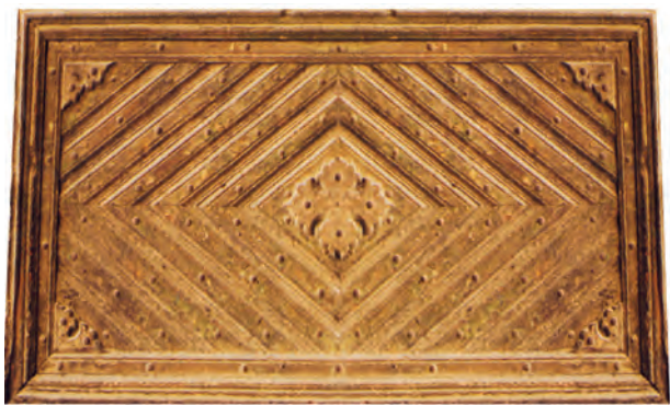
تصویر ۱-۲-۲- معرّق رویه‌کوبی قسمتی از در بازار قیصریه - اصفهان

اکثر طرح‌های مورد نظر برای این شیوه، هندسی هستند. نمونه بارز این شیوه در سقف مسجد جامع شیراز (رجوع شود به فصل ۱- تاریخچه) و در بازار قیصریه اصفهان (تصویر ۱-۲-۲) مشهود است.