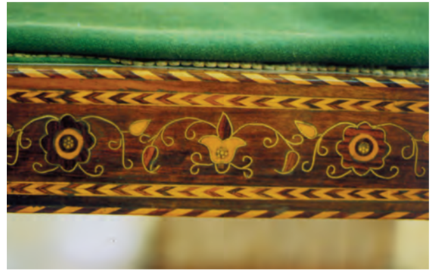
تصویر ۲-۲-۲- معرق جایگزینی، قسمتی از کناره یک میل که هم اکنون در موزه وانگ نگهداری می‌شود.

گاهی در این روش در شیار بین قطعات یک نوار فلزی کوبیده می‌شود، نوار فلزی مذکور از جنس مس، برنج، طلا یا نقره و به عرض ۳ میلیمتر و ضخامت ۱ میلیمتر است و در جهت باریک خود در شیارها کوبیده می‌شود (تصویر ۲-۲-۲).