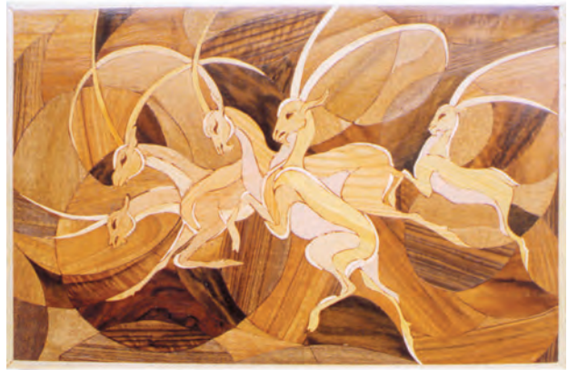
تصویر ۵-۲-۲- معرق زمینه چوب چند تکه - تابلو