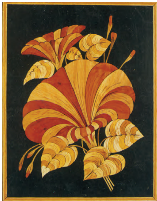
تصویر ۸-۲-۲- معرق رزین دار - تابلو

لازم به ذکر است که رزینها همیشه به صورت مایع در معرق به کار نمی‌روند بلکه در برخی مواقع می‌توان آنها را به صورت ورقه‌های جامد با ضخامت ۳ میلیمتر و با رنگ و نقش مورد نظر ساخت و سپس آن را مانند سایر مصالح معرق بر اساس الگو دوربری نمود.