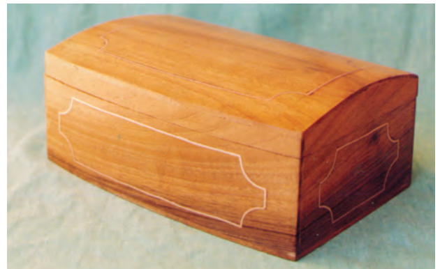
تصویر ۲-۲-۳- نوعی معرق جایگزینی که فقط با فلز کوبی انجام می‌شود.

یکی از زیرمجموعه‌های این شیوه روشی است که در آن روی سطح یک زمینه چوبی براساس طرح شیارهایی ایجاد می‌نمایند و در آن شیارها نوار فلزی می‌کوبند. بنابراین در آن، به غیر از نوار فلزی چیز دیگری الحاق نمی‌شود (تصویر ۲-۲-۳).