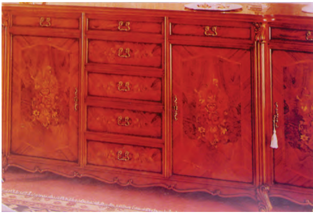
تصویر ۶-۲-۲- الف- معرق روکشی اجرا شده روی درهای یک کابینت