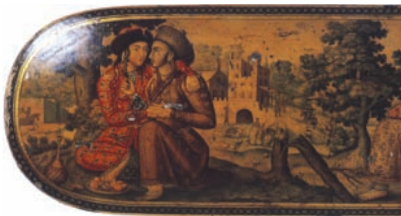
تصویر ۱-۴۲- قلمدان، نقاشی لاک‌روغنی، مکتب اصفهان، قرن یازدهم، مجموعه خصوصی، لندن

اصفهان» خوانده‌اند. این هنرمندان عبارتند از: شفیع عباسی، محمدزمان، علی‌قلی بیک جبه‌دار، ... (تصویر ۱-۴۳).