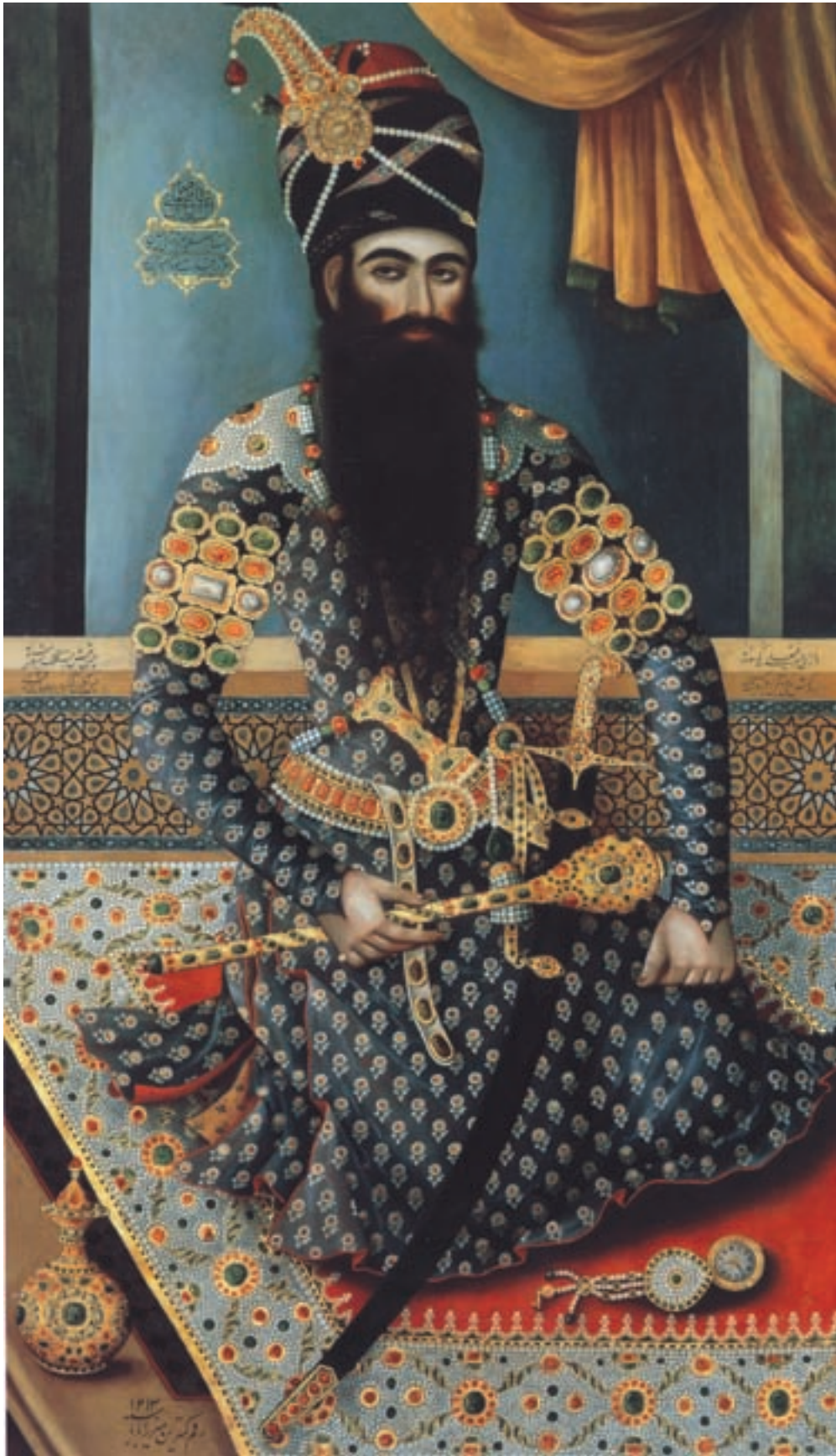
تصویر ۵۱-۱- فتحعلی شاه، اثر میرزا بابا، رنگ و روغن روی بوم، مکتب تهران، اواخر قرن دوازدهم هجری، لندن