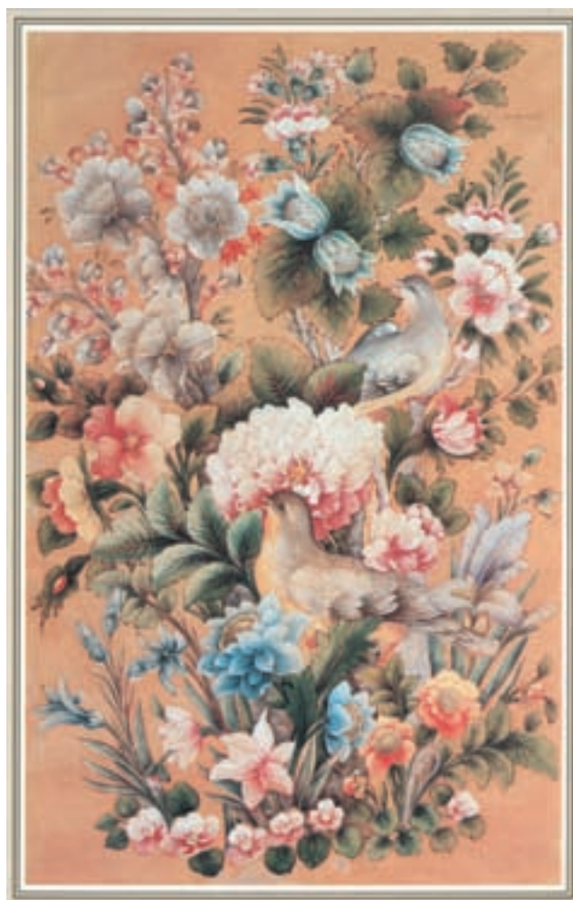
تصویر ۱-۵۷- گل و مرغ، شیوه پرداز، اثر حاج میرزا آقا امامی، مکتب تهران، قرن چهاردهم، موزه هنرهای ملی تهران