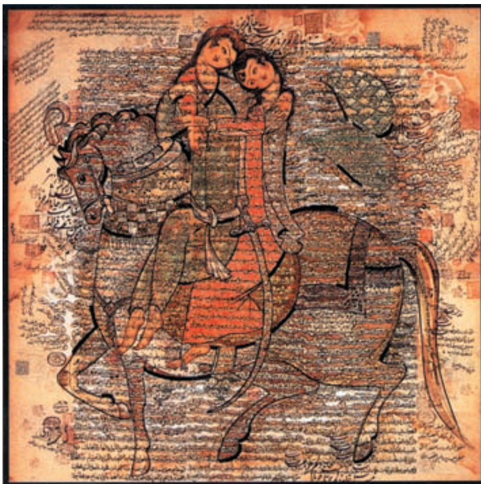
تصویر ۱-۵۶- زوج، صادق تبریزی، آبرنگ روی کاغذ، دوره معاصر، مجموعه خصوصی

تهران کار می کردند. کسانی مانند حاج میرزا آقا امامی، حاج مصور الملکی، حسین بهزاد، هادی تجویدی و ... از این گروه اند (تصاویر ۱-۵۷ و ۱-۵۸ و ۱-۵۹).