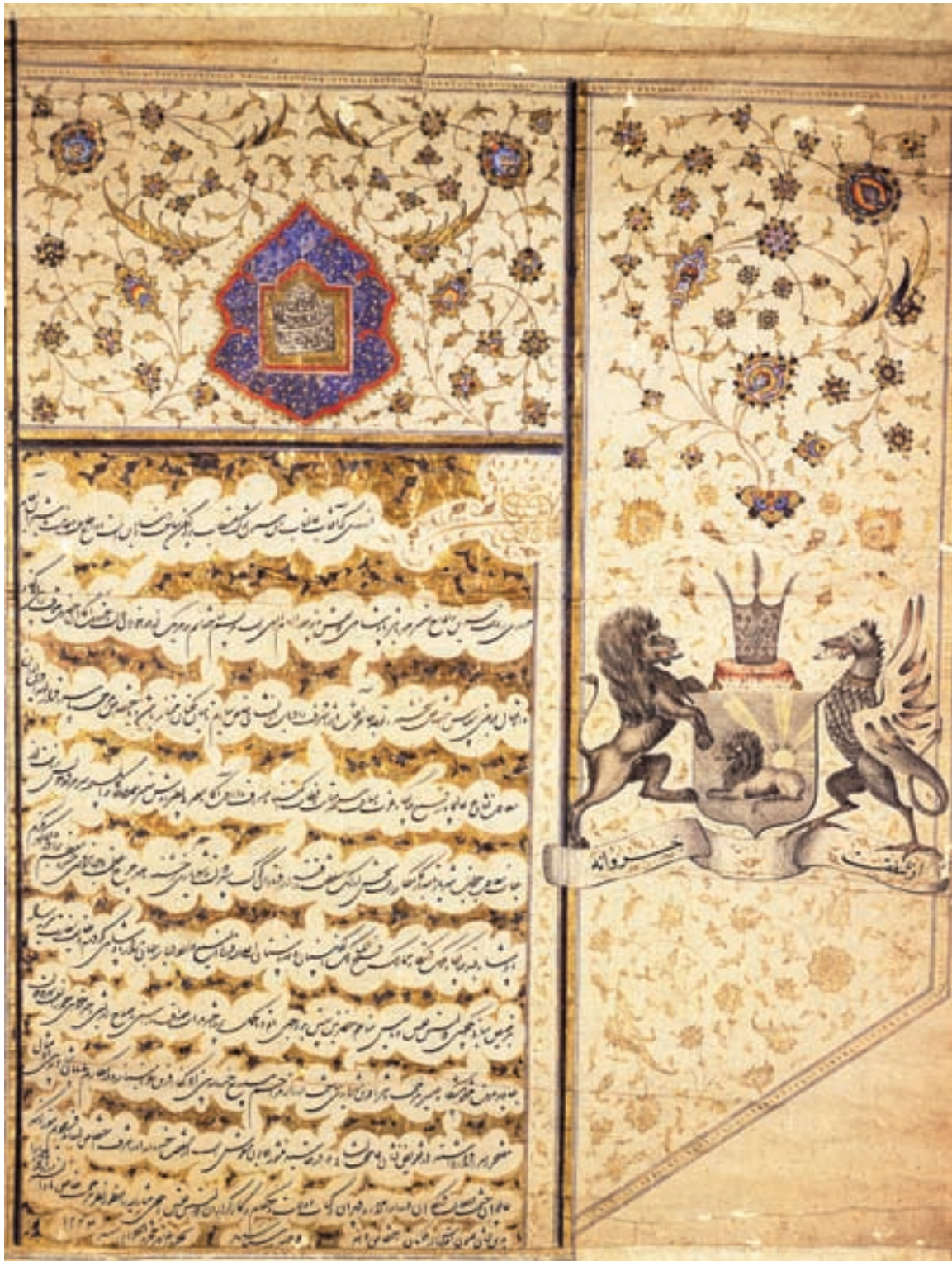
تصویر ۴۹-۱- نامه فتحعلی شاه به سفیر انگلستان، رنگ و مرکب و طلا روی کاغذ، مکتب تهران، قرن سیزدهم هجری، لندن