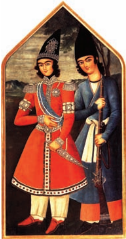
تصویر ۴۷-۱- شاهزاده قاجار و محافظ، رنگ روغن روی بوم، مکتب تهران، قرن سیزدهم هجری