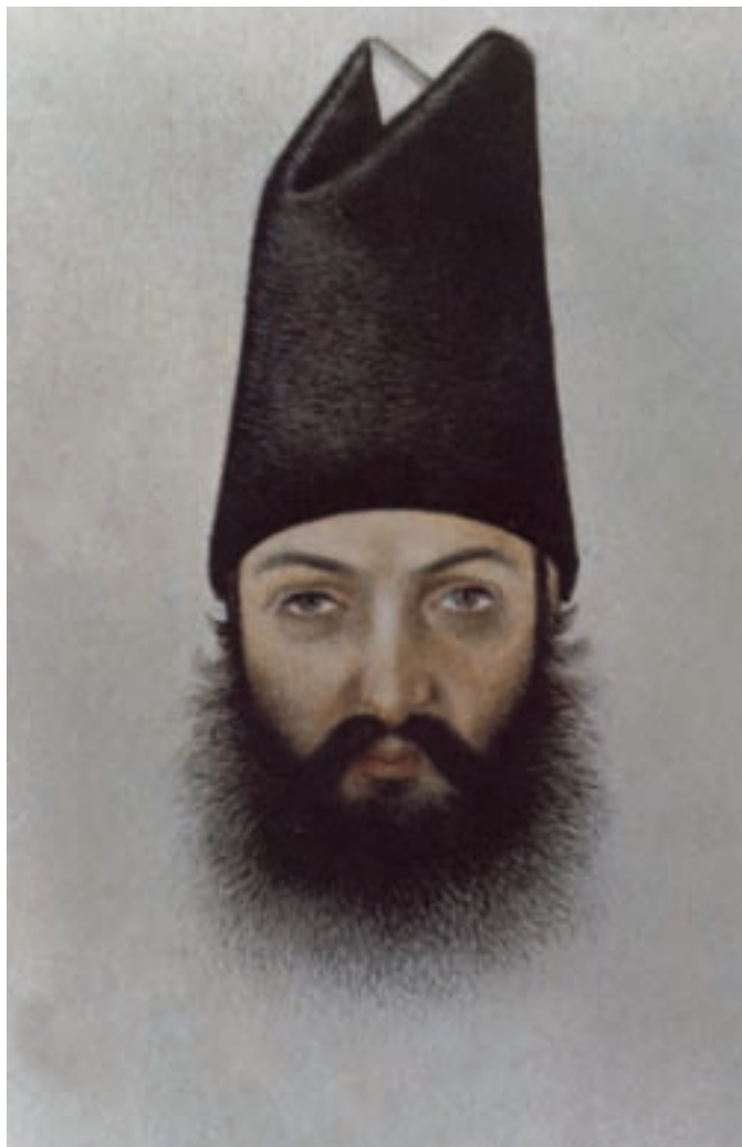
تصویر ۴۸-۱- خسروخان کرمانی، شیوه پرداز، اثر ابوالحسن غفاری (صنیع الملک) مکتب تهران، قرن سیزدهم هجری، کتابخانه بریتانیا

علاوه بر نقاشی دیواری و نقاشی روی بوم در این دوره نوعی نقاشی آبرنگ بر روی کاغذ نیز رواج پیدا کرد که بیش تر