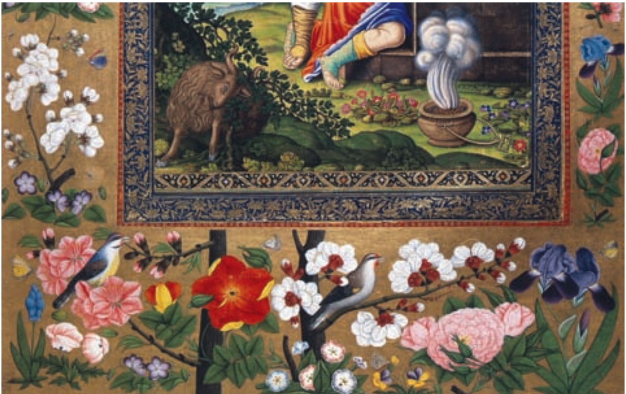
تصویر ۱-۵۰- پرندگان و گل‌ها، بخشی از اثر، گواش و آبرنگ، مکتب اصفهان و تهران، اواخر قرن دوازدهم هجری، موزه سن پترزبورگ