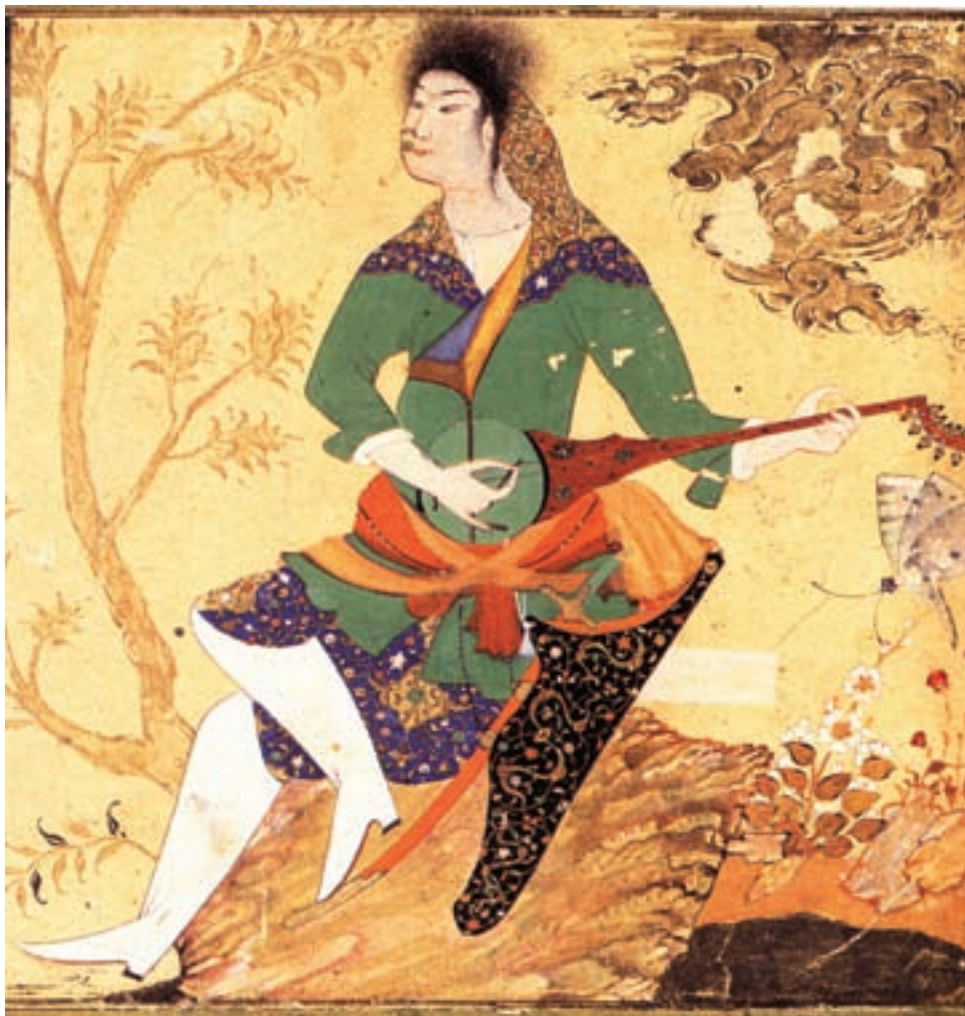
تصویر ۳۴-۱- نوازنده‌ی رباب، اثر محمدجعفر، مکتب قزوین، قرن دهم هجری، کتابخانه‌ی بریتانیا

این شیوه توسط هنرمندان مکتب قزوین دنبال شده و در دوران صفوی نیز ادامه یافت (تصویر ۳۴-۱).