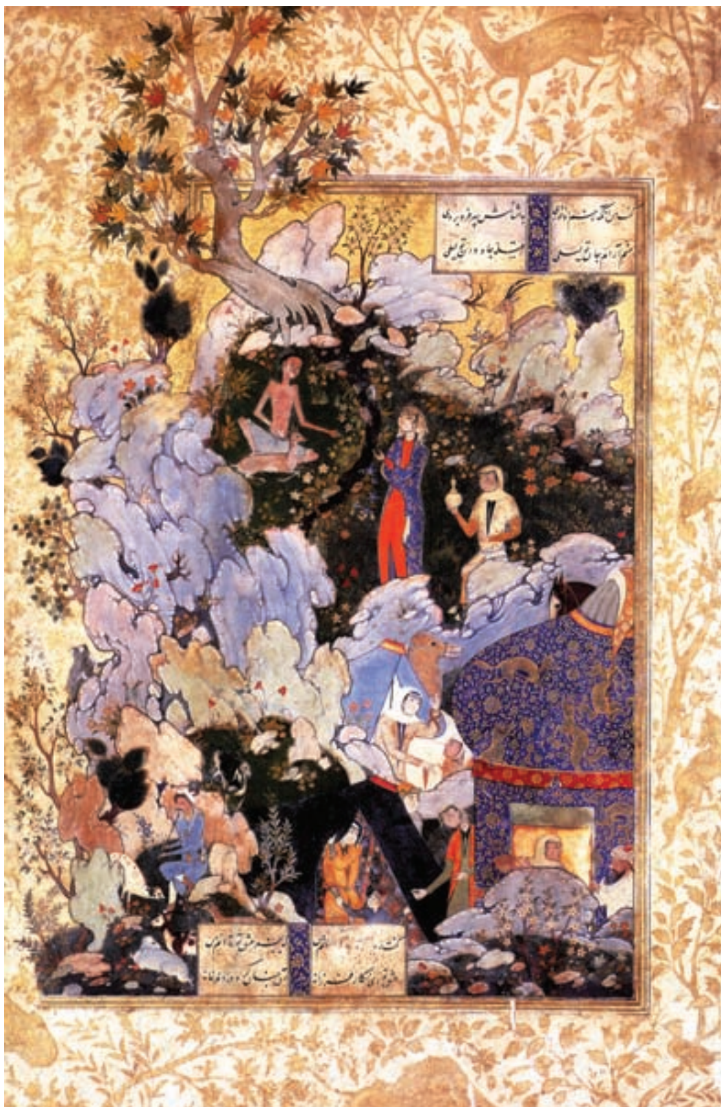
تصویر ۳۹-۱- عشق مجنون، کتاب سلسله الذهب، اثر محمدی، قرن دهم هجری

۲- گرایش دوم: مناظر طبیعی روستایی، مناظری از زندگی شبان‌ها و زنان روستایی در حین کار، نوازندگان نی، ریسندگان و