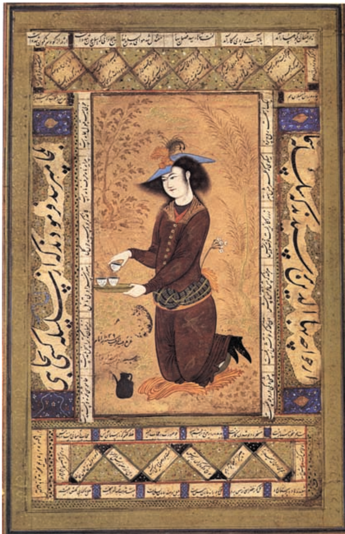
تصویر ۳۷-۱- ساقی، اثر رضا عباسی، مکتب اصفهان، قرن یازدهم هجری، موزه رضاعباسی، تهران