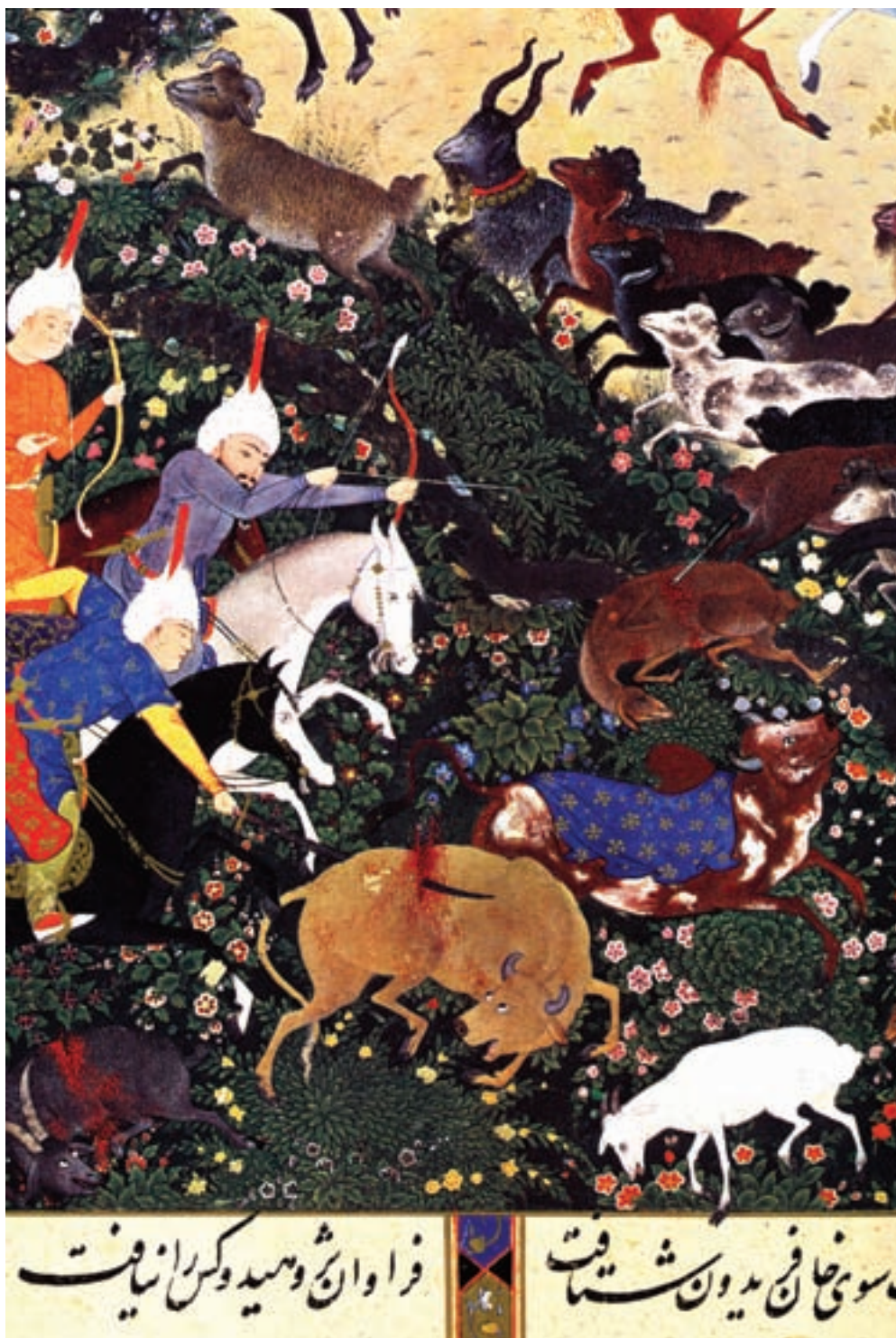
تصویر ۲۹-۱- کشتار حیوانات اهلی به دست ضحاک (بخشی از اثر)، شاهنامه شاه طهماسب، اثر سلطان محمد، قرن دهم هجری موزه هنرهای معاصر تهران

یکی از آثار معروف این دوره شاهنامه‌ای بود که به شاهنامه‌ی شاه طهماسب معروف گردید. این اثر، دارای دویست و پنجاه و هشت تصویر به شیوه‌ی مکتب تبریز از آثار سلطان محمد، میرک نقاش، میرسیدعلی و... است که در دوران ریاست بهزاد و پس از آن در تبریز اجرا شده است. این شاهنامه که بعدها به دست دلالان