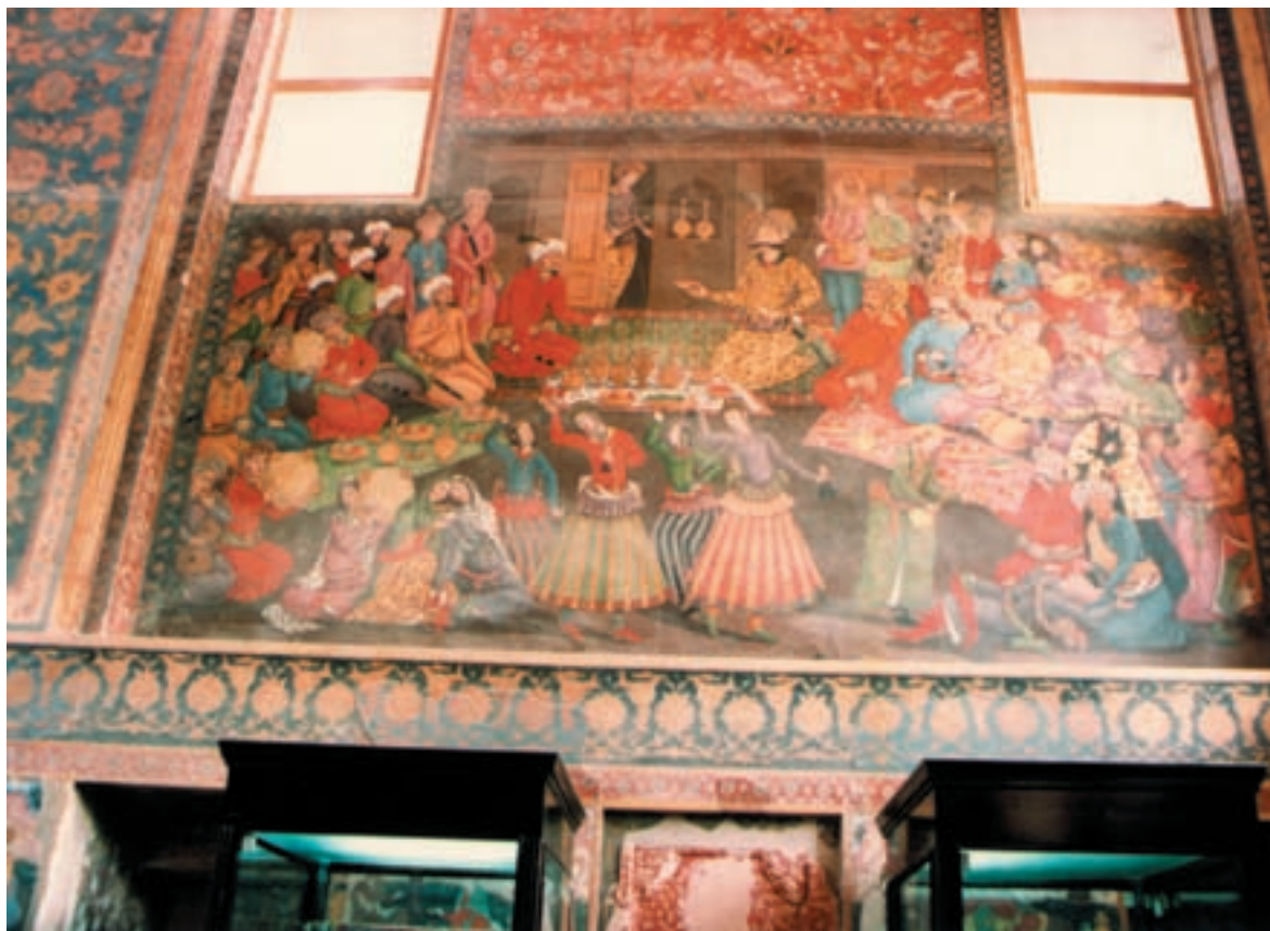
تصویر ۱-۴۱- محمدخان در دربار شاه‌عباس، نقاشی دیواری، مکتب اصفهان، قرن یازدهم هجری، کاخ چهلستون اصفهان

۴- گرایش چهارم: توجه به نقاشی در بناهای مجلل، نقاشی روی قاب آینه، قلمدان و جعبه‌ها رواج پیدا کرد. از