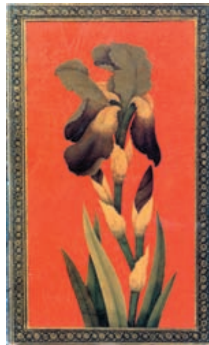
تصویر ۴۶-۱- تصویر جلد لاک‌ی با طرح گل زنبق مکتب شیراز