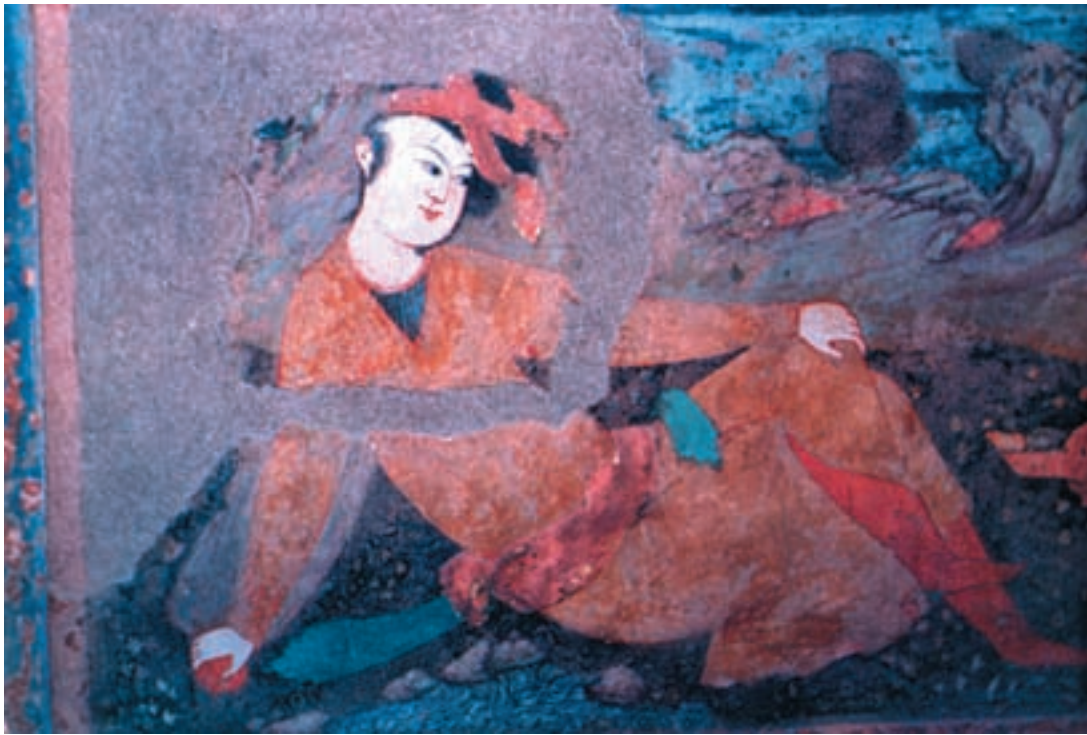
تصویر ۳۶-۱- جوان نشسته، نقاشی دیواری، مکتب اصفهان، قرن یازدهم هجری، عمارت عالی‌قاپو در اصفهان

در این دوره، هنرمندان کم‌کم از زیر حمایت دربار بیرون آمدند و مستقلاً به کار مشغول شدند. صورت‌نگاری و تک‌چهره‌سازی که با خوی فردگرایی شاه‌عباس و سایر درباریان مناسبت داشت، گسترش بیش‌تری یافت. شاه‌عباس به‌منظور آشنا