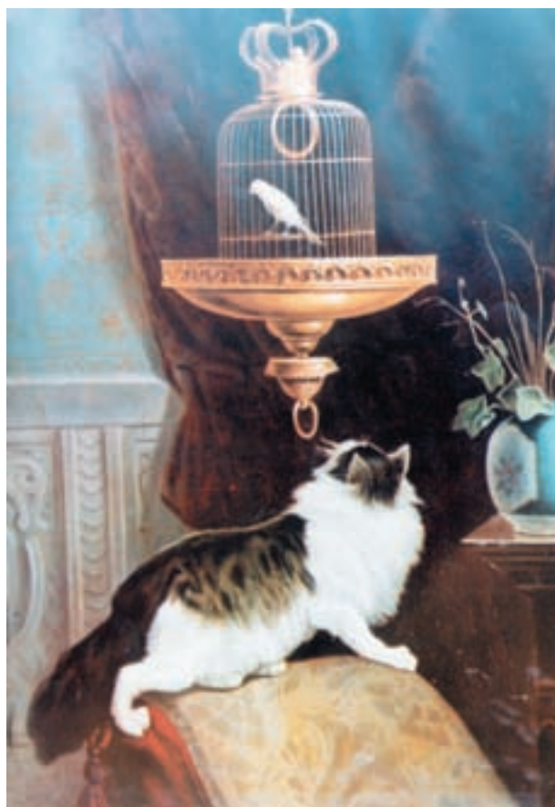
تصویر ۱-۵۲- قفس قناری و گربه - اثر کمال‌الملک، رنگ روغن روی بوم، مکتب تهران، قرن سیزدهم هجری

پس از آن نخستین نمایشگاه نقاشی ایران به دستور ناصرالدین شاه با تعدادی تابلو و مقداری عکس چاپ شده از آثار نقاشان اروپایی برپا گردید. در این زمان محمد غفاری که در مدرسه‌ی دارالفنون تحصیل می‌کرد به دربار شاه راه یافت و بعدها لقب کمال‌الملک گرفت. وی شدیداً تحت تأثیر نقاشان اروپایی بود. در این زمان، با کنار گذاشتن عناصر نقاشی ایرانی، ویژگی‌های نقاشی کلاسیک اروپایی عیناً به جای نقاشی ایرانی نشست (تصویر ۱-۵۲).