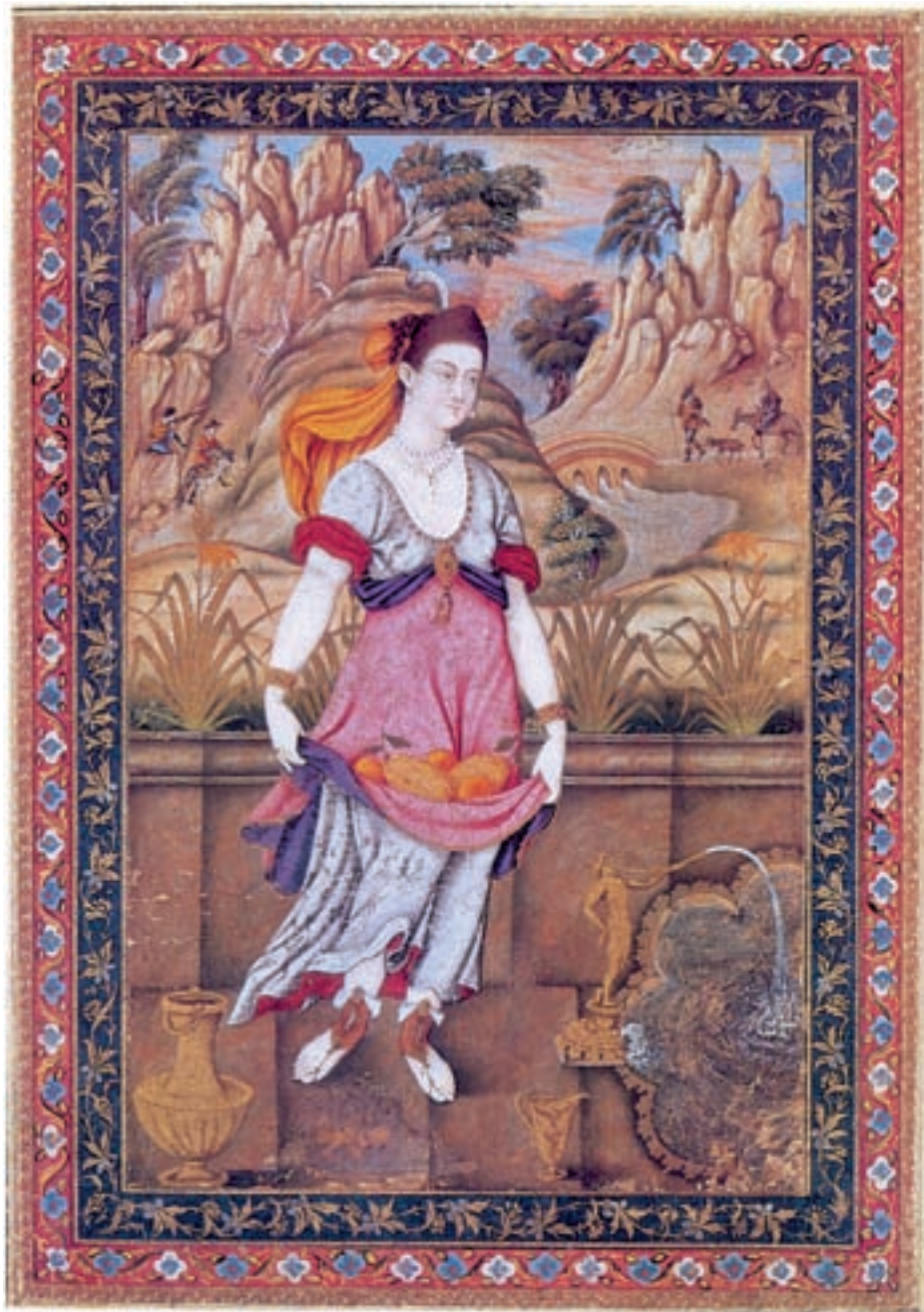
تصویر ۴۳-۱- زن ایستاده در کنار فواره، اثر علی قلی بیگ جبّدار، مکتب ایتالیا اصفهان، اواخر قرن یازدهم هجری، مجموعه خصوصی