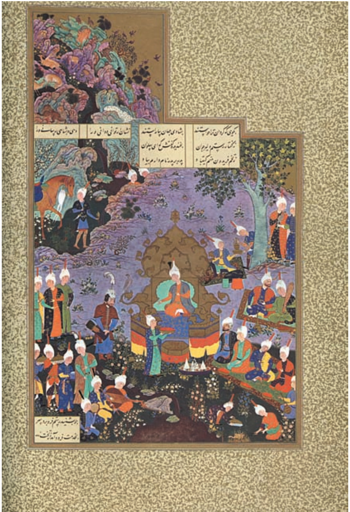
تصویر ۲۸-۱- رستم در دربار کیقباد، اثر آقامیرک، خمسه نظامی، قرن دهم هجری، موزه بریتانیا