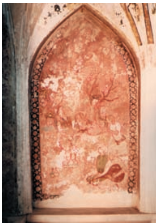
تصویر ۱-۳۲- بزم، نقاشی دیواری، مکتب قزوین، قرن دهم هجری، کاخ چهلستون قزوین