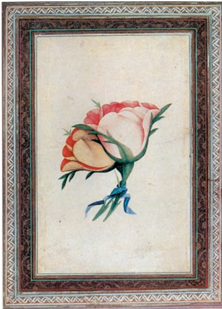
تصویر ۱-۴۴- دو گل با نوار آبی، مکتب شیراز، قرن دوازدهم و سیزدهم هجری

کردند که مکتب شیراز دوران زندیه را به‌وجود آوردند. در این دوره، عده‌ای از هنرمندان به تصویرسازی گل‌ها و گیاهان که با الهام از شیوه اروپایی نقاشی می‌شد، علاقه نشان دادند. آغازگر این شیوه، شفیع عباسی پسر رضاعباسی بود. شیوه‌ی گل و