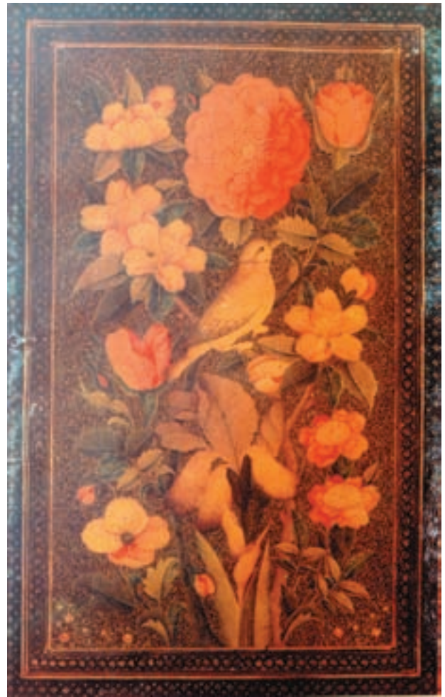
تصویر ۴۵-۱- جلد قرآن، لاک، گل و مرغ، مکتب شیراز

پس از سلطنت کریم خان زند، اختلاف زیادی بین جانشینان او و آقا محمدخان که از قبایل ترک قاجار بود روی داد. در نهایت آقا محمدخان با غلبه بر جانشینان کریم خان، توانست سلسله‌ی جدیدی تشکیل دهد و تهران را به پایتختی برگزیند. اما پس از چندی آقا محمدخان به قتل رسید و برادرزاده‌ی او باباخان پسر حسینعلی خان جهانسوز که در شیراز به سر می‌برد به سرعت خود را به تهران رسانید و با نام فتحعلی شاه به تخت نشست. فتحعلی شاه به هنرمندان نقاش توجه خاصی داشت و تصویرگران در دربار او به‌طور مستمر مشغول کشیدن تصاویر شاه در حالت‌های مختلف بودند. این تصاویر، اغلب با رنگ روغن و به اندازه‌ی طبیعی کشیده می‌شد. دیوارکاخ‌ها و سراها انباشته از مجالس نقاشی دیواری بود که اغلب، تصاویر سلطان و رقاصه‌ها و بانوان حرم سرا و مجالس عیش و عشرت شاه را ارائه می‌کرد (تصویر ۴۷-۱).