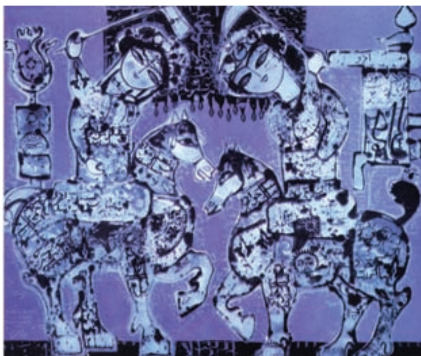
تصویر ۱-۵۵- چوگان، اثر ناصر اویسی، رنگ و روغن روی بوم، دوره معاصر، تهران

۲- گروه دوم: شامل کسانی‌ست که تحت تأثیر هنرهای سنتی ایران و پیروی از تکنیک و اصول نقاشی کلاسیک و یا مدرن غرب، دست به تلفیق و نوآوری زده‌اند مانند جلیل