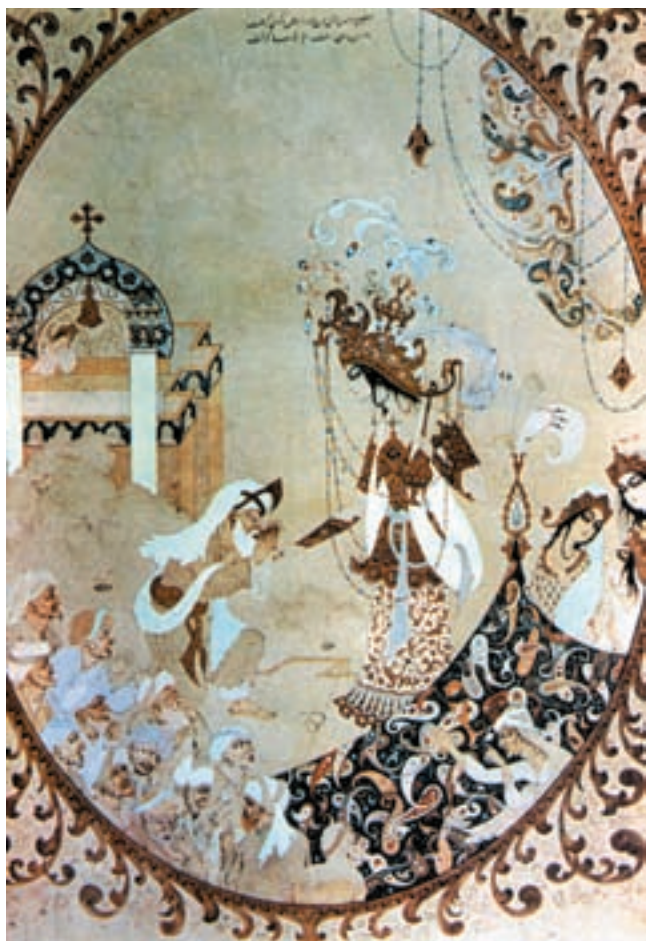
تصویر ۱-۵۸- شیخ صنعان و دختر ترسا، آبرنگ و گواش، حاج مصورالملکی، مکتب تهران، قرن چهاردهم، موزه هنرهای ملی تهران