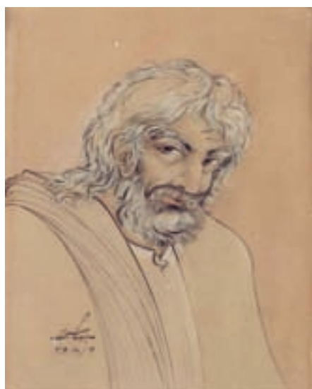
تصویر ۱-۵۹- حافظ، اثر حسین بهزاد، آبرنگ، آبان ماه ۱۳۳۶، تهران