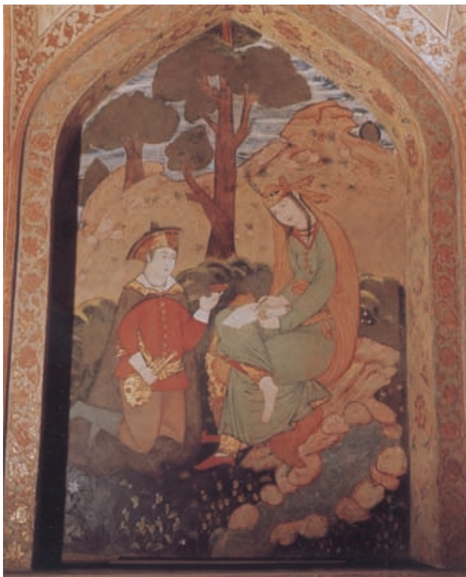
تصویر ۱-۳۵- در باغ، نقاشی دیواری، مکتب اصفهان، قرن یازدهم هجری، کاخ چهلستون اصفهان

باختگی اینان در مقابل غرب، در تمام کشور و بین تمام اقشار جامعه رخنه کرد. از همین جا غربی شدن تدریجی تکنیک نقاشی ایرانی و تأثیرپذیری آن از موضوعات نقاشی اروپایی آغاز گردید. در این دوره به علت علاقه‌ی شخصی شاه عباس به بناسازی به تقلید از شاه جهان در هند، نقاشی دیواری بیش از کتاب آرایه مورد توجه قرار گرفت. به همین دلیل هنر کتاب آرایه تا حدود بسیار زیادی محدود گردید و هنرهای وابسته به آن کم از یاد رفت و برعکس، هنرهای وابسته به معماری افزایش یافت. نمونه نقاشی‌های دیواری این دوره را در عمارت‌های مجلل اصفهان مانند کاخ عالی قاپو، کاخ چهلستون، سردر بازار قیصریه، کاخ هشت بهشت، و... می‌توان دید (تصاویر ۱-۳۵ و ۱-۳۶).