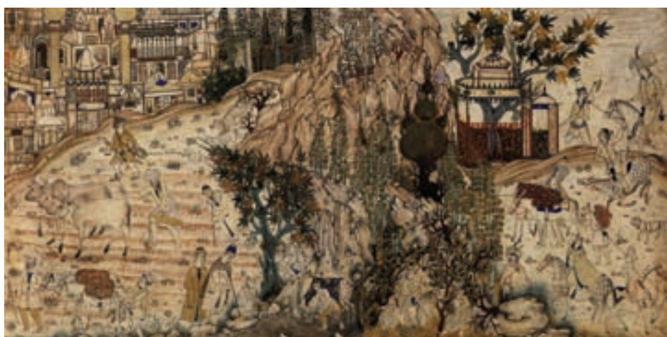
تصویر ۱-۳۱- کار در مزرعه با دورنمای شهر، اثر محمدی، مکتب قزوین، قرن دهم و یازدهم هجری، موزه توپکاپی استانبول

حرکات، طبیعی‌تر گشت و کم‌کم نوعی طبیعت‌گرایی که در مکاتب بعدی با شدت بیش‌تری بروز کرد، در این دوره دیده شد، در آثار نقاشی مکتب قزوین توجه به موضوعات درباری و جنگ و جدال کم‌تر شد و هنرمندان به موضوع‌های عمومی و زندگانی روستایی پرداختند. در این تصاویر، از عمامه‌های دوازده ترکی با میله‌ی قرمز اثری نیست، اغلب تصاویر در کتب به صورت جفتی اجرا شده و معمولاً دو تصویر با یک کادر به تصویر درآمده است. در این دوره مجدداً نقاشی دیواری آغاز گردید و ما شاهد آثار بسیار زیبایی در کاخ قزوین هستیم (تصاویر ۱-۳۱ و ۱-۳۲).