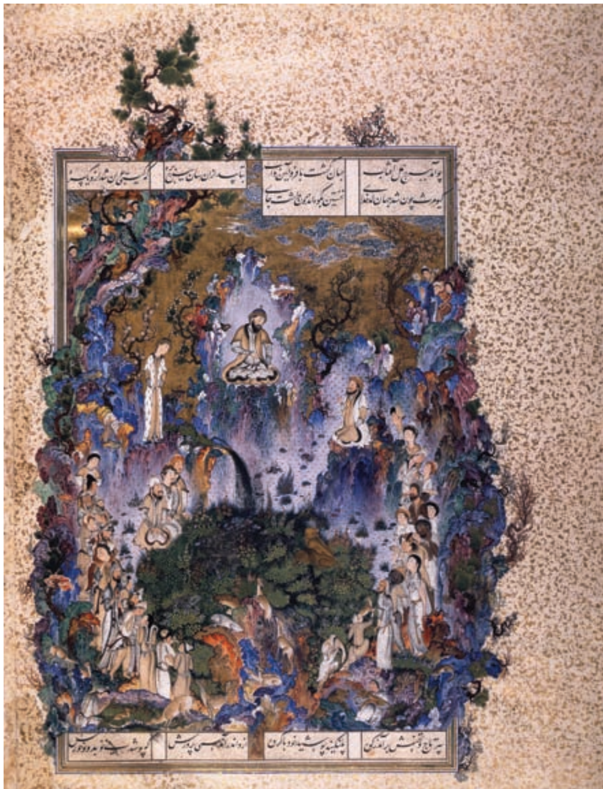
تصویر ۳۸-۱- بارگاه کیومرث اولین شاه، شاهنامه شاه طهماسب، اثر سلطان محمد، مکتب تبریز در دوره دوم، قرن دهم هجری، مجموعه خصوصی، ژنو

نگارگری عهد صفوی شامل سه مکتب (تبریز در دوره دوم، قزوین و اصفهان) و پنج گرایش می‌باشد که عبارتند از: ۱- گرایش اول: نقاشی عهد صفوی شامل مناظر درباری