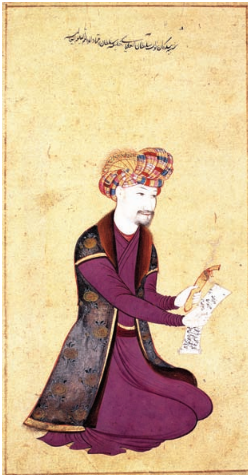
تصویر ۴۰-۱- وزیر خلیفه سلطان، اثر معین مصور (شاگرد رضا عباسی)، مکتب اصفهان، قرن یازدهم هجری

۳- گرایش سوم: توجه به چهره‌نگاری است که اغلب از سوی شاهزادگان، بزرگان، و درباریان به هنرمندان سفارش داده