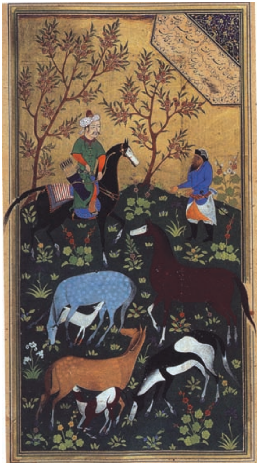
تصویر ۲۱-۱- شاه دارا و مهتر، اثر کمال‌الدین بهزاد، بوستان سعدی، قرن نهم هجری، کتابخانه عمومی مصر

رنگ‌سبز چمن بسیار پخته‌ای که گل و برگ‌های کم‌رنگ‌تر بدان تموج لطیفی بخشیده‌اند و درختان خوش طرح و رعنا و باطراوت، آسمان نیلگون که از لابه‌لای ابرها خودنمایی می‌کند، خورشید زرینی که پرتوهای درخشانش را به اطراف می‌پراکند با