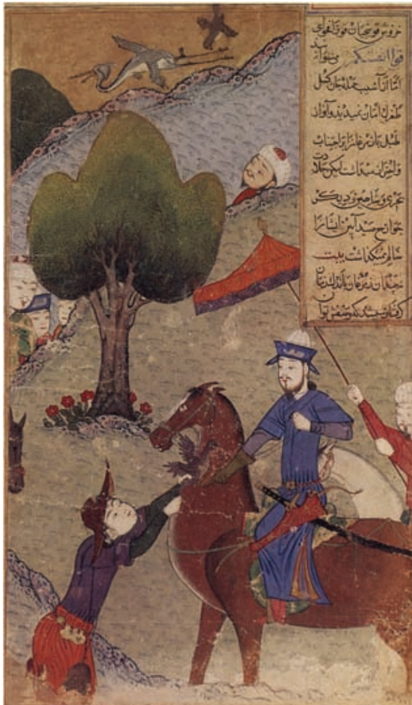
تصویر ۱۶-۱- شکار تیمور، ظفرنامه یزدی، آبرنگ و مرکب و طلا روی کاغذ، نقاش یعقوب بن حسن، مکتب شیراز قرن نهم هجری مجموعه خصوصی

در نقاشی‌های مکتب شیراز، موضوع اصلی انسان است و عناصر دیگر، تابع آن نقش و تنها به‌عنوان تزیین و پر کردن فضاهای خالی تصویر به‌کار گرفته شده‌اند. علاوه بر آن عناصر دیگری مانند به‌کار گرفتن جداول و نوعی رنگ‌آمیزی موزون و