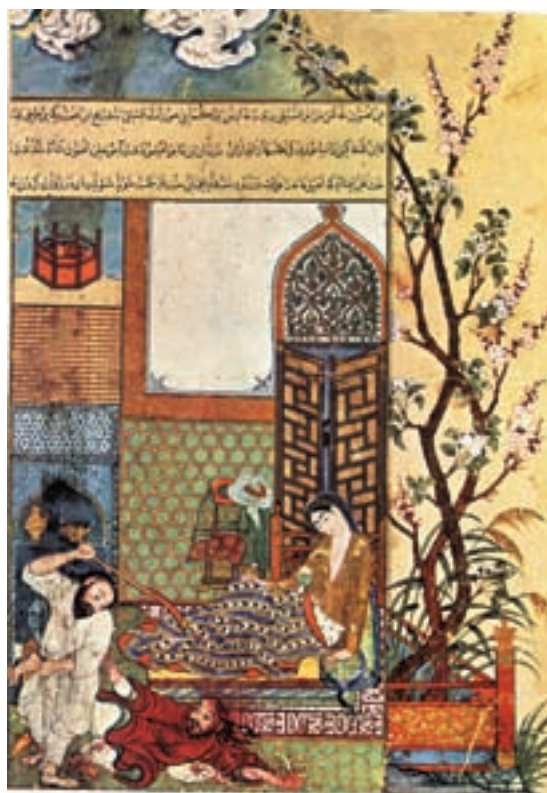
تصویر ۱۴-۱ غافلگیر شدن دزد، کلبله و دمنه، مکتب تبریز، قرن هشتم هجری، استانبول

دسته‌ی دوم آثاری است که با به کارگیری پاره‌ای عناصر نقاشی چینی و عناصر نقاشی ایرانی درهم آمیخته و آثاری به وجود