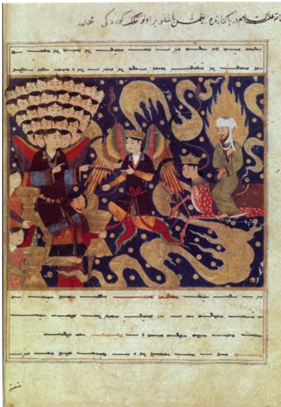
تصویر ۱۹-۱- معراج حضرت رسول، اثر میرحیدر، کتاب معراج‌نامه، مکتب هرات یا سمرقند، اوایل قرن نهم هجری، کتابخانه‌ی ملی پاریس

پس از تیمور پسرش شاهرخ که در زمان حیات پدر، در خراسان حکمرانی می‌کرد با تشویق صنعتگران و دانشمندان در مقرر حکومتی خود مرکز فرهنگی مهمی به‌وجود آورد. به‌طوری که شهر مشهد در آن روزگار یکی از مراکز معتبر هنری به‌شمار می‌رفت. شاهرخ هرات را به پایتختی برگزید و هنرمندان را از گوشه و کنار کشور به هرات دعوت کرد. پس از انتقال پایتخت شاهرخ به هرات، این شهر مرکز بزرگی در زمینه‌ی هنرهای گوناگون