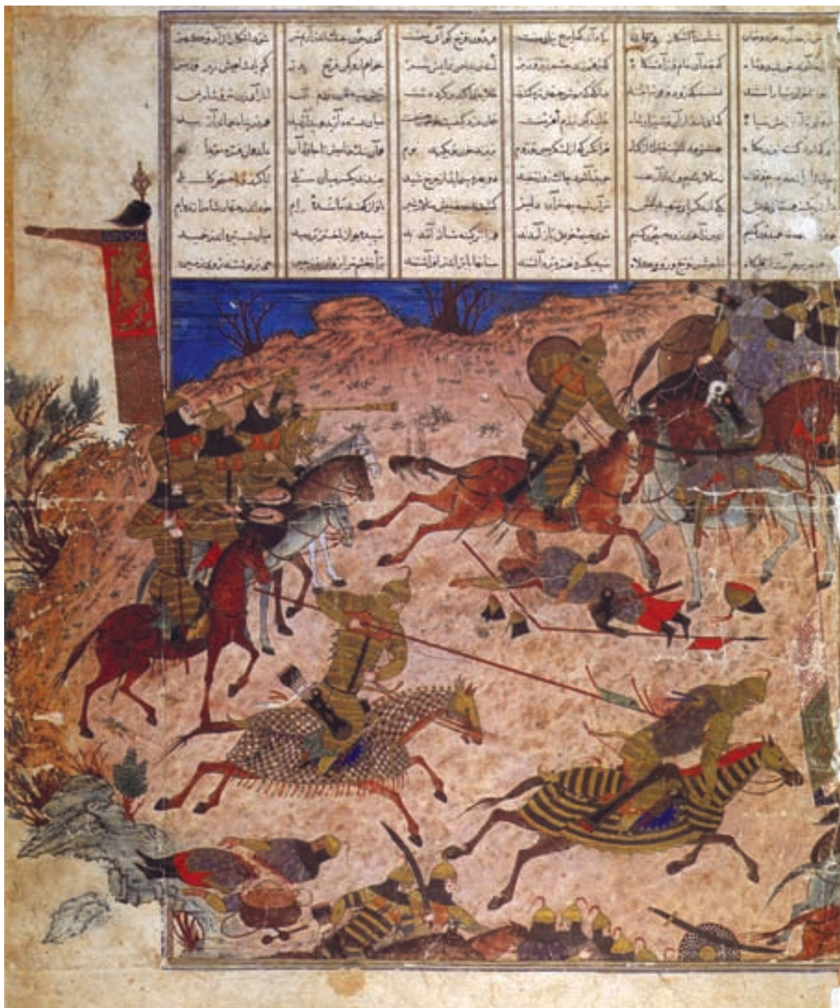
تصویر ۱۱-۱- نبرد شاه منوچهر با تورانیان، شاهنامه، مکتب تبریز، قرن هفتم هجری، موزه توپکاپی استانبول

وجه تمایز آن با نقاشی‌های مکتب تبریز عهد مغول، کوچک شدن تصاویر انسان است که تابع نقش منظره، طبیعت و مناظر نقاشی شده در اثر می‌باشد. تزئینات معماری که در دوره‌ی مغول آغاز گشته بود در این دوره ادامه یافت و ما شاهد تزئینات ظریف کاشی کاری و گره چینی در ساختمان‌های این دوره هستیم (تصویر