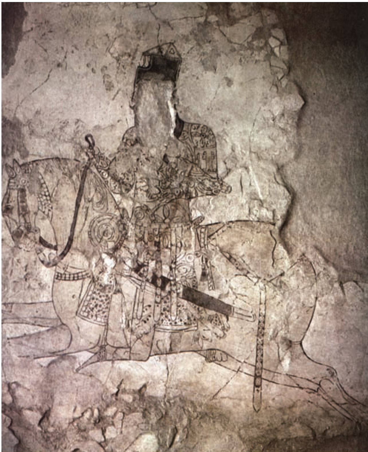
تصویر ۱-۳- شکارچی سوار بر اسب، نقاشی دیواری، کاخ سبزه‌پوشان نزدیک نیشابور، قرن دوم و سوم هجری، گنجینه هنرهای ملی

همان رنگ استفاده شود. کم کم نازکی و ضخامت در قلم گیری به وجود آمد و خطوط یکنواخت مشکی جای خود را به خطوط رنگی نازک و ضخیم داد. بدین شکل که خطوط اصلی و محل های