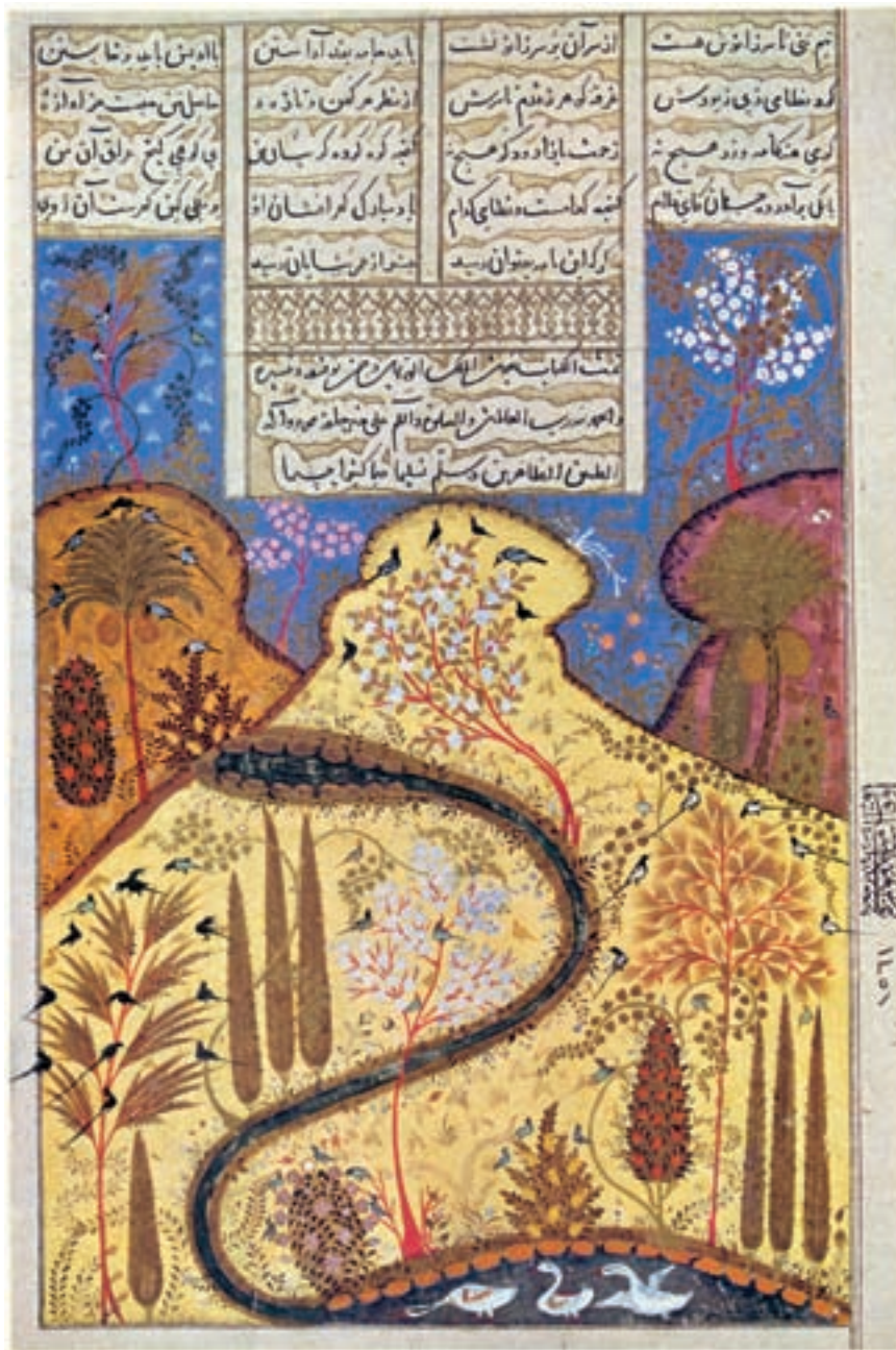
تصویر ۱۷-۱- جویبار، بهبهان، از کتاب گلچین اشعار، قرن هشتم هجری، موزه اسلامی استانبول

در دوره تیموری هنر نقاشی در شهرهای دیگر نیز رواج یافته ولی چون این رواج اندک بود، تنها به ذکر مراکز عمده اکتفا می‌شود. شهرهایی مثل یزد، مشهد، کرمان، سمرقند، نیشابور و... که هرکدام شیوه‌ای از نقاشی را در طول تاریخ به نام خود ثبت کرده و تا حدودی تحت نفوذ دگرگونی‌های حاصله از مرکز به وجود آوردند. از این شهرها می‌توان به بهبهان اشاره کرد که شیوه‌ای خاص را به خود اختصاص داده، در این شیوه، هنرمند سعی کرده است که تنها از مناظر طبیعی مانند کوه، درخت، آسمان، گل