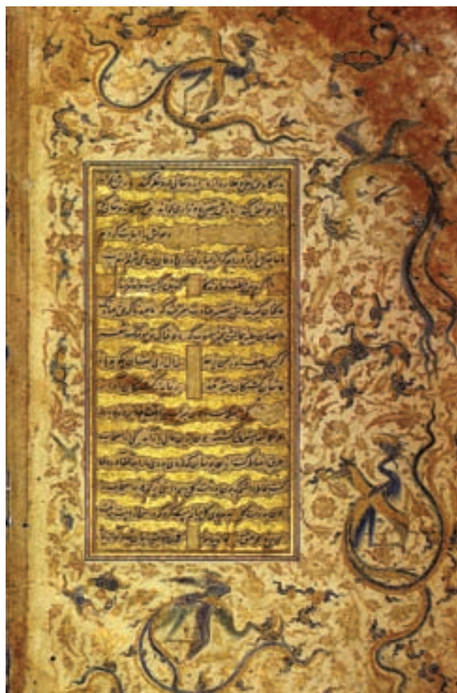
تصویر ۲۷-۱- تشعیر، اثر آقا میرک، خمسه نظامی، قرن دهم هجری، موزه بریتانیا