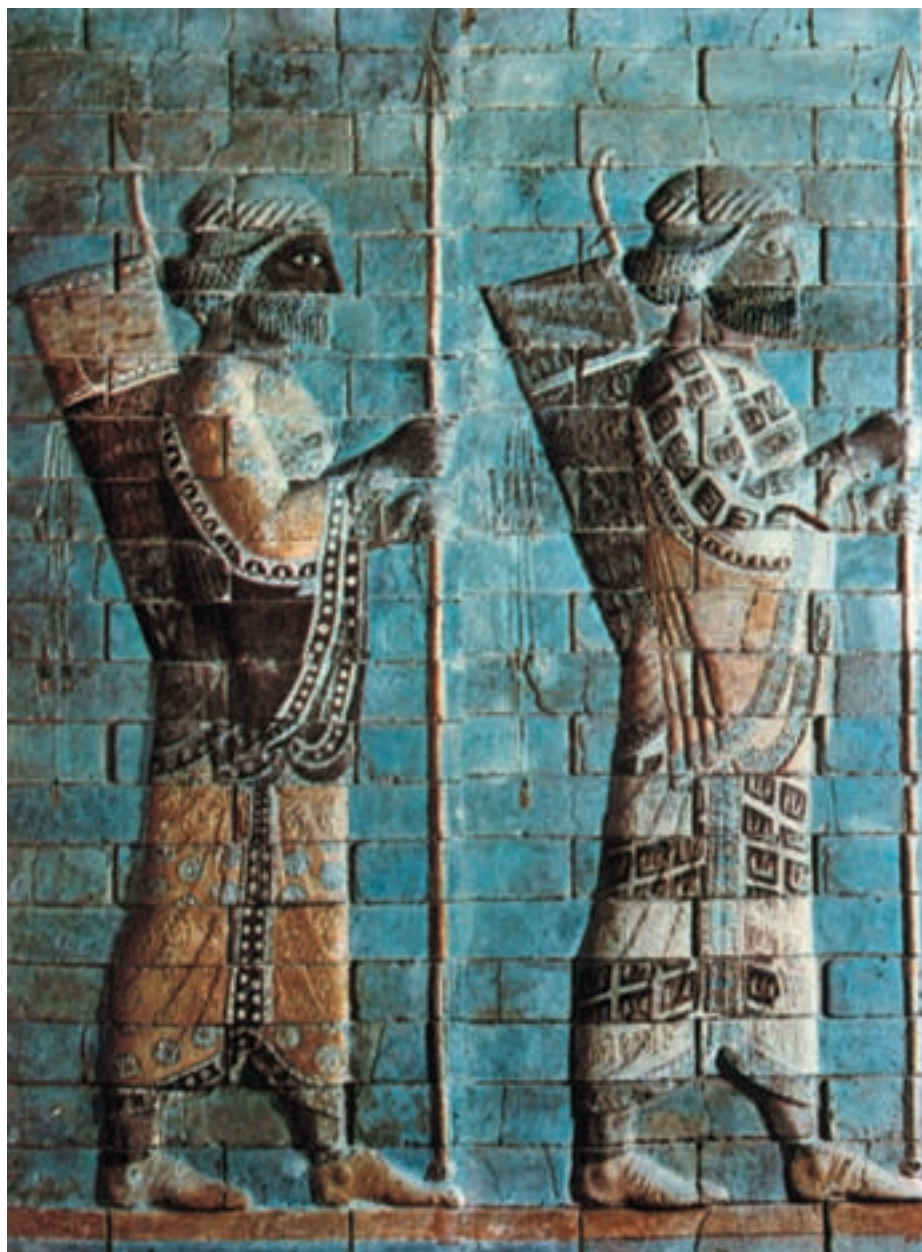
تصویر ۱-۱- سربازان جاویدان هخامنشی، کاشی لعابدار، آپادانای شوش، قرن چهارم و پنجم قبل از میلاد، موزه‌ی لوور

که با رنگ‌های اُخرایی، گل ماشی و سیاه منقوش شده بود. کشف جام‌ها، سفال‌ها، مفرغ‌ها و آثار کهن هنر ایران در گوشه و کنار کشور، تداوم هنر نگارگری ایرانی را به خوبی نشان می‌دهد. آثار دیگری که در تپه‌ی سیلک، چشمه علی، زیویه، مارلیک و دیگر نقاط به دست آمده نمایشگر ترقی فوق‌العاده هنرهای تصویری ایران باستان است. دوره‌های مختلف هنری ایران، مسیر خود را طی کرد تا اندک‌اندک زمینه‌ی پیدایش هنر نقاشی عصر هخامنشیان فراهم گردید. در عصر هخامنشیان کاخ‌ها و پرستش‌گاه‌ها به وسیله‌ی نقوش تزئینی و نقاشی روی گچ، تزئین می‌گردید، همچنین