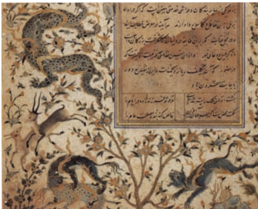
تصویر ۲۶-۱- تشعیر، اثر آقا میرک، خمسه نظامی، قرن دهم هجری، موزه بریتانیا