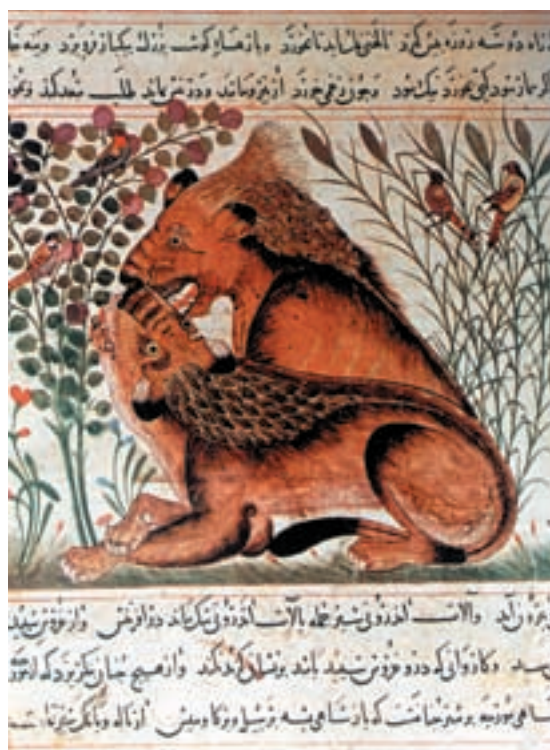
تصویر ۱۳-۱ دو شیر، منافع الحيوان نوشته ابن بختيشوع، محل تولید اثر مراغه، قرن هفتم هجری، کتابخانه مورگان نیویورک

آورده اند که با حفظ سنت نقاشی ایرانی، نفوذ عناصر نقاشی چینی در آن مشخص است (تصویر ۱۴-۱).