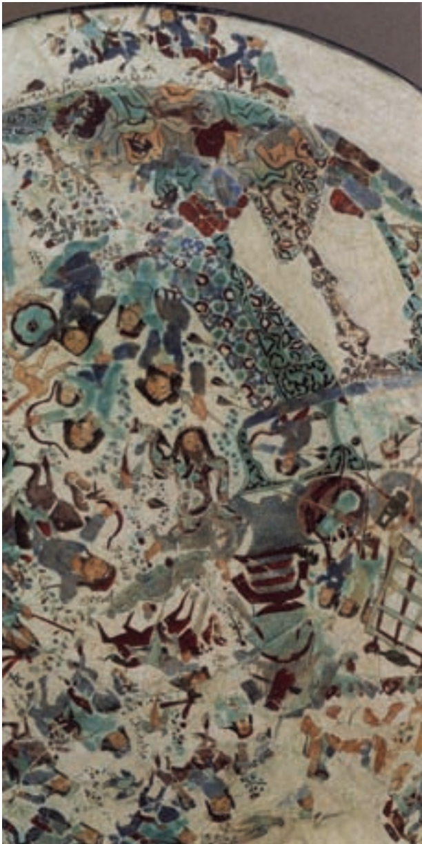
تصویر ۵-۱- صحنه جنگ، بخشی از یک بشقاب سرامیک مینایی، دوره سلجوقی، قرن ششم هجری، واشنگتن

کاشی‌ها نقاشی کنند. این سفال‌ها به علت قلم‌گیری‌های ظریف و لعاب‌کاری عالی آن به سفال‌های مینایی شهرت پیدا کرده است (تصویر ۵-۱).