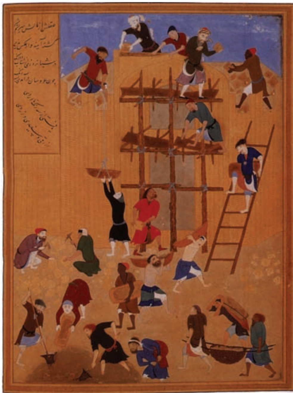
تصویر ۱۲۰- ساخت کاخ خورتق، اثر کمال‌الدین بهزاد از مجموعه آثار خمسه نظامی، قرن نهم، کتابخانه ملی انگلیس

ایرانی‌ست. در این دوره هنرمندان که از تجسم واقعی احجام چشم پوشیده بودند با به کار گرفتن شکل‌های زیبا و دلنواز و هماهنگ و با استفاده از فضاهای روحانی در آثار خود، به دستاوردهای ویرای تصاویر نقاشی شده دست یافتند. این تصاویر با ویژگی‌هایی چون نداشتن سایه و روشن و عمق نمایی در تابلو و استفاده از جزییات بی‌شمار، نظر هر بیننده‌ای را به خود جلب می‌نماید. رنگ‌آمیزی در نقاشی‌های مکتب هرات، معرف تکامل فوق‌العاده‌ی این فن در هنر این دوره است. در این دوره، هنرمندی