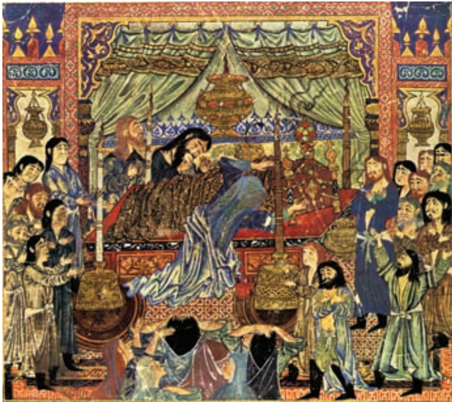
تصویر ۹-۱- مرگ اسکندر، شاهنامه فردوسی، مکتب تبریز، قرن هفتم، واشنگتن

از همین جا، پایه ی مکتب تبریز در نقاشی ایران پی ریزی شد. ارتباط ایلخانان مغول با اقوام خود در کشورهای دیگر از جمله چین، باعث نفوذ برخی از عناصر نقاشی چین در نقاشی ایرانی شد. این عوامل عبارت اند از ابرهای مواج کنگره دار و داخل هم، تنه گره دار بسیار پیچیده درختان، صخره های بلند و قله های نوک تیز و دشت های بریده و مقطع و به طور کلی نوعی منظره سازی ناهمگن با تلفیق نقاشی ایران، خصوصیات نقاشی عصر مغول را به وجود آورده است. در این دوره ارتباط پاره ای از امیران مغول با دیانت مسیح و حضور تعدادی افراد مسیحی در دربار، راه را برای نفوذ عناصر نقاشی بیزانس باز کرد. حضور این عناصر را می توانیم در نمایش چین و شکن لباس ها و به کارگیری سایه روشن در آن مشاهده کنیم (تصویر ۹-۱).