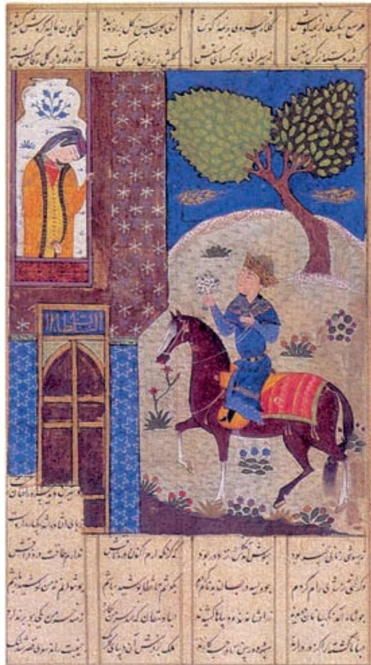
تصویر ۱۸-۱- خسرو با دسته گلی در کنار قصر شیرین، خمسه‌ی نظامی، اوایل قرن نهم هجری، دوره‌ی تیموری، مجموعه خصوصی

خود با نقاشی دیواری تعدادی از هنرمندان را به کار گرفته بود. اما به علت علاقه‌ی فراوان تیمور به هنر کتاب‌آرایی (نقاشی، تذهیب، تشعیر، جلدسازی، صحافی، خوشنویسی و...) و حمایت از این گونه هنرها مخصوصاً در پایتخت، هنر نقاشی دیواری رواج چندانی نیافت. آثاری که از نقاشی سمرقند باقی مانده تقلیدی از نقاشی چینی است حتی تعدادی از تصاویر، با مرکب چینی و با تکنیک نقاشی چینی اجرا شده است (تصویر ۱۸-۱).