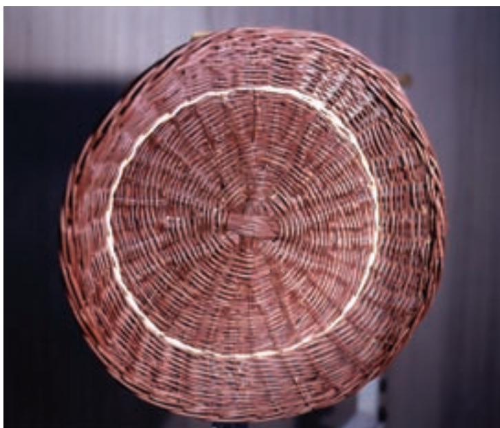
تصویر ۱-۱- نمونه‌ای از سبديبافی

شاخه و ریشه‌ی گیاهان و درهم تنیدن آن‌ها آغاز کرده است (سبديبافی، تصویر ۱).