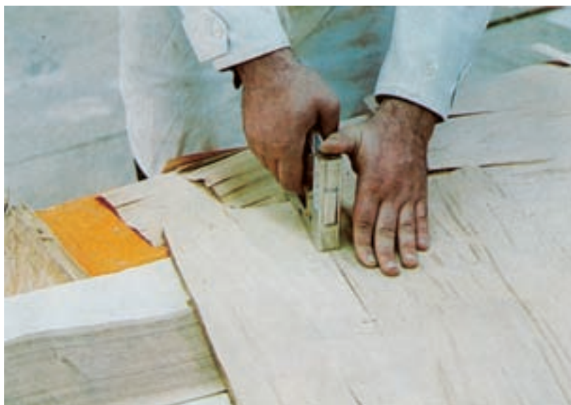
شکل ۱۲-۵- نحوه‌ی استفاده از دستگاه دوخت دستی در به هم دوختن روکش‌های درز شده

۲-۳-۵- دوخت روکش به وسیله دستگاه دوخت دستی: روکش‌های جور شده را به وسیله دستگاه دوخت نیز می‌توانید مهار کنید و لبه آن‌ها را به هم بدوزید؛ البته این عمل را روی روکش‌های نامرغوب که برای پشت صفحات کارتان جور کرده اید انجام دهید، زیرا بعد از پرس کاری باید سوزن‌های دوخت