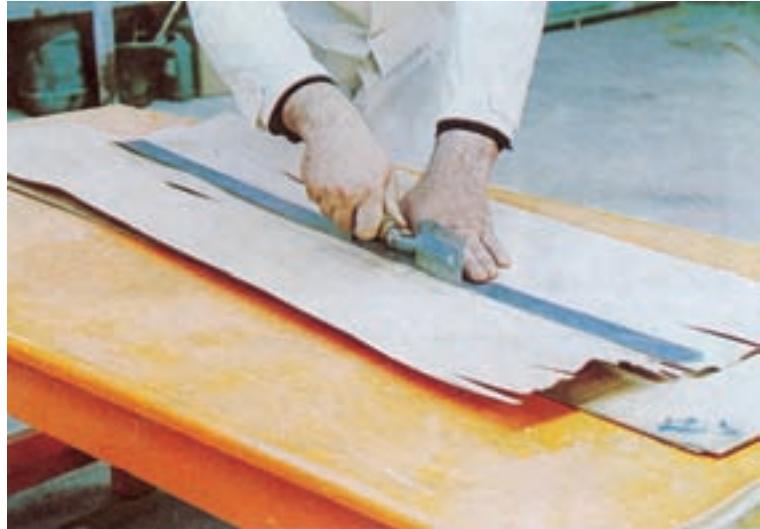
شکل ۵-۶- نحوه‌ی اندازه‌بری طولی روکش‌ها با کمک ستاره و اره روکش‌بری

علامت‌گذاری، با کمک خط‌کش بلند چوبی یا فلزی (ستاره) و اره روکش‌بری یا کاتر (چاقوی برش‌دهنده) مانند شکل ۵-۶ برش دهید.