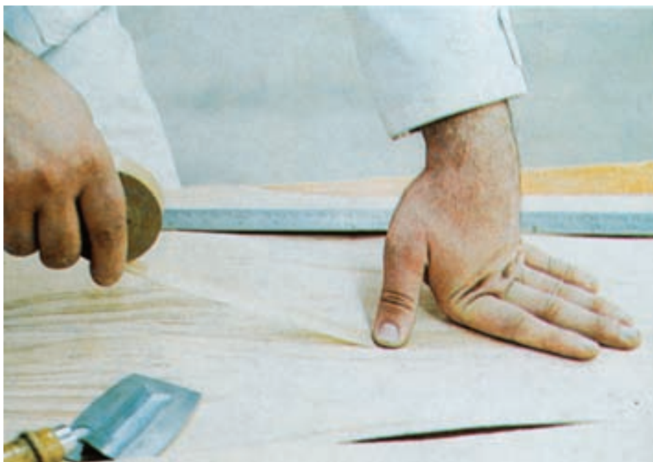
شکل ۹-۵- نحوه‌ی چسباندن نوار چسب کاغذی روی درز طولی روکش‌ها

عمل چسباندن درز طولی روکش‌ها را می‌توانید با استفاده از تکه‌های مرطوب نوار چسب کاغذی نیز انجام دهید. برای این کار نوار چسب را تکه‌تکه به طول حدود ۶ تا ۸ سانتیمتر قطع کنید و تکه‌ها را به طریق گفته شده مرطوب نمایید و با زاویه 30^\circ تا 90^\circ درجه روی درز روکش جور شده بچسبانید (شکل ۱۰-۵).