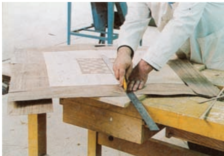
شکل ۵-۷- دانشجوی رشته صنایع چوب در حال قطع کردن عرض روکش با کاتر

ب) اندازه‌بری عرضی روکش را نیز مانند شکل ۵-۷ انجام دهید. برای این کار از ستاره و اره روکش‌بری استفاده کنید.