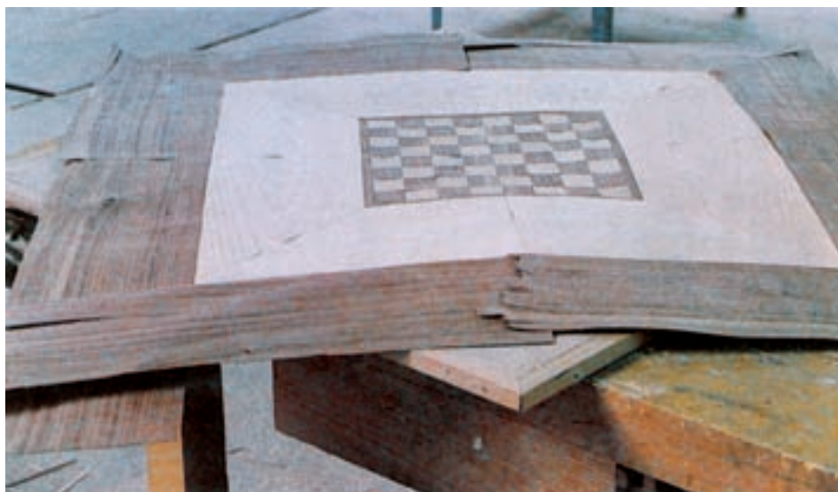
شکل ۵-۵- روکش‌های جور شده برای صفحه شطرنجی

برای جور کردن روکش‌ها، مخصوصاً روکش‌های مرغوب، برای روی کار باید به نوع و طرح کارتان توجه کافی کنید؛ مثلاً اگر بخواهید یک صفحه شطرنجی مانند شکل ۵-۵