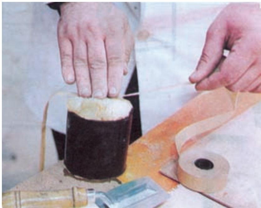
شکل ۸-۵- نحوه مرطوب کردن نوار چسب کاغذی برای درز روکش

درز کردن روکش‌ها در کارخانجات تولید انبوه کالای صفحه‌ای چوبی با استفاده از ماشین درزکن روکش انجام می‌شود که ممکن است با استفاده از تیغه اره مجموعه‌ای و یا تویی فرز باشد و تعداد زیادی روکش را به صورت دسته‌ای زیر دو صفحه بالا و پایین ماشین در جهت طول روکش قرار می‌دهید