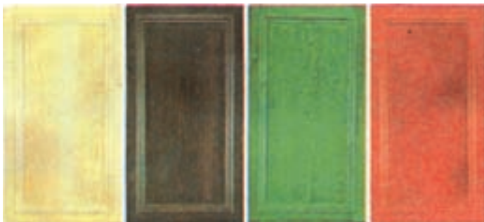
شکل ۲-۵ - درهای قفسه روکش شده با رنگ‌های مختلف