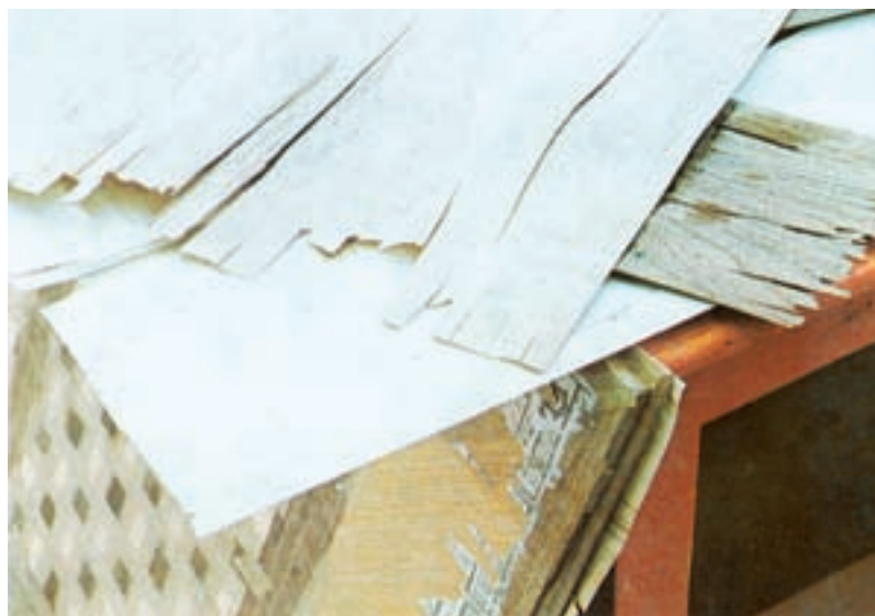
شکل ۴-۵- روکش‌های ترک دار مناسب برای پشت کار