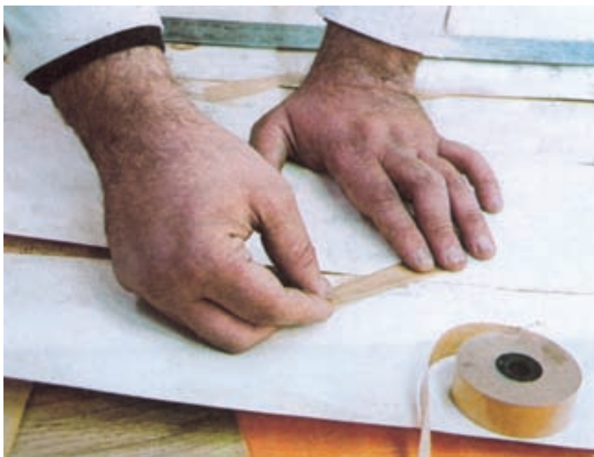
شکل ۱۰-۵- نحوه‌ی چسباندن تکه‌های نوار چسب کاغذی روی درز روکش‌ها

عمل چسباندن درز طولی روکش‌ها را می‌توانید با استفاده از تکه‌های مرطوب نوار چسب کاغذی نیز انجام دهید. برای این کار نوار چسب را تکه‌تکه به طول حدود ۶ تا ۸ سانتیمتر قطع کنید و تکه‌ها را به طریق گفته شده مرطوب نمایید و با زاویه 30^\circ تا 90^\circ درجه روی درز روکش جور شده بچسبانید (شکل ۱۰-۵).