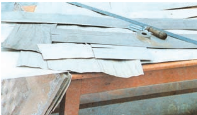
شکل ۳-۵- روکش‌های مناسب برای جور کردن روی کار

حرارت دستگاه خشک‌کن خود را بالا برده، روکش‌ها سریعتر از حد استاندارد خشک شده باشند دچار تردی شده، ترک‌های طولی زیادی خواهند داشت؛ از این رو در موقع جور کردن، انتهای آن‌ها را که زیاد ترک خورده‌اند، مانند روکشی که در قسمت سمت راست شکل ۴-۵ وجود دارد ببرید و کنار بگذارید و روکش‌هایی نظیر روکش رویی آن را نیز به صورت طولی و عرضی چسب نواری کاغذی بچسبانید و حتی المقدور برای روکش پشت صفحات تخته خرده چوب کارتان استفاده کنید و همچنین سایر روکش‌های نامرغوب و بدرنگ را نیز برای پشت کار مورد استفاده قرار دهید.