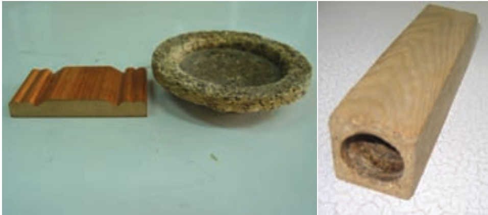
شکل ۷۹-۱- نمونه‌هایی از فرآورده‌های قالبی چوب