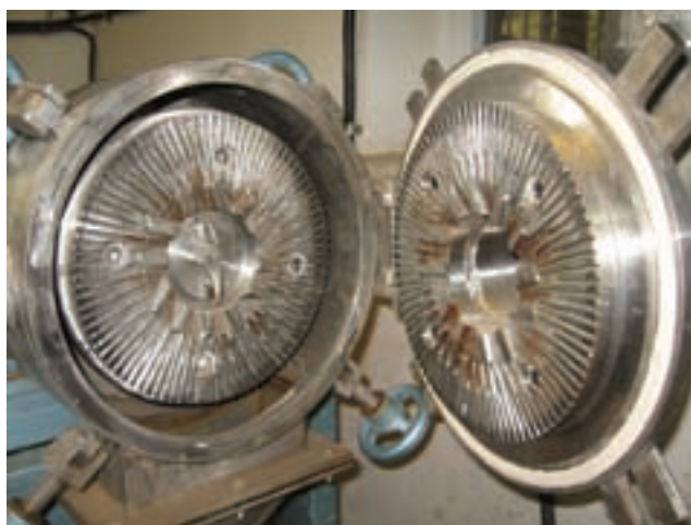
شکل ۸۰-۱- الف - صفحه‌ی پالاینده