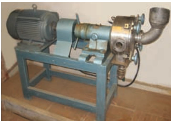
ب- یک دستگاه پالایندهی آزمایشگاهی