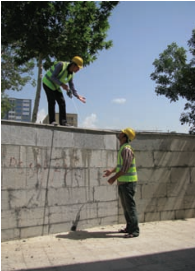
شکل ۹-۲. اختلاف ارتفاع چه قدر است؟

منظور از ارتفاع، اختلاف ارتفاع بالا تا پایین عارضه است. مثلاً بالا تا پایین پله