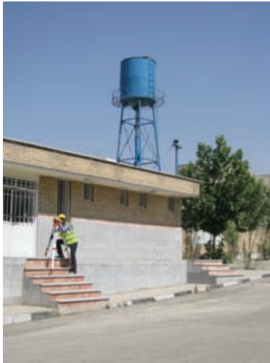
شکل ۹ - ۱ . اختلاف ارتفاع چه قدر است؟