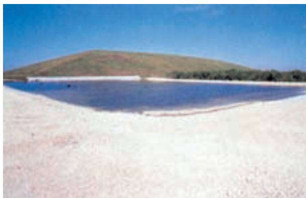
شکل ۱-۵- کوهی از مواد زاید جامد

متأسفانه در گذشته، به حفاظت محیط زیست کارخانه‌های تعمیراتی توجهی نمی‌شد، اما امروزه در برخی نقاط دنیا، مقررات سختی شامل آن‌ها شده است. قبلاً این کارخانه‌ها از تولیدکننده‌های عمده‌ی مواد زاید بودند و سهم زیادی در دفن ضایعات داشتند. در شکل ۱-۵ تصویر یک کوه مصنوعی که از انباشته شدن مواد زاید جامد به وجود آمده است نشان داده شده است. در برخی نقاط که سطح آب‌های زیرزمینی بالاست مواد زاید جامد به ناچار روی سطح زمین انباشته می‌شوند.