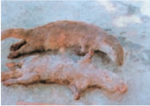
ب - دو سمور آبی (شنگ) که بر اثر جریان الکتریسیته، در حاشیه‌ی سفیدرود کشته شده‌اند.