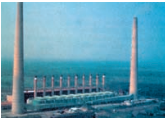
شکل ۱۶-۱- دودکش های قبلی این نیروگاه زغال سنگی با دودکش های جدید و بلند سی صد متری تعویض شده اند تا به انتشار آلودگی در جو کمک شود و از تراکم و تجمع آلودگی محلی بکاهد. این عمل ممکن است مشکلات محلی و حساسیت اهالی و ساکنین اطراف را تا حدی کاهش دهد ولی آلودگی را در سطح وسیع تری پخش می کند.