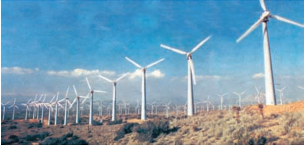
شکل ۱-۱- این توربین‌های بادی بدون ایجاد آلودگی، الکتریسیته تولید می‌کنند و زمین‌های اطراف می‌تواند چراگاه دام باشد.