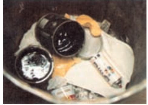
شکل ۱۷-۱- دورریزی نامناسب رنگ. این زائده‌ی خطرناک خانگی می‌تواند موجب آلودگی آب‌های سطحی و زیرزمینی شود.