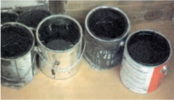
شکل ۱۸-۱- برای جلوگیری از نشت رنگ، باقی مانده‌ی آن در ظروف باید خشک شود و سپس به طریق صحیح دفع گردد.