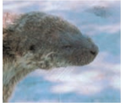
الف - سرسمور آبی (شنگ اروپایی) که در حاشیه‌ی سفیدرود کشته شده است.

شکل ۱۱-۱- نمونه‌هایی از سمورهای آبی (شنگ) در حاشیه‌ی سفیدرود که معمولاً توسط جریان الکتریسیته، تنگ، تله‌گذاری و دام‌گذاری کشته می‌شوند. اهالی به بهانه‌ی ماهی‌خوار بودن و همچنین ارزش اقتصادی پوست این حیوان، آن را بی‌رحمانه شکار می‌کنند اما معمولاً جسد خشک شده‌ی این موجود در هر کوی و برزنی در استان‌های شمالی کشور برای فروش دیده می‌شود. اگرچه این حیوان از ماهی و آبزیان مورد نیاز انسان تغذیه می‌کند ولی بررسی‌ها و مطالعات گسترده در اروپا بیانگر این نکته است که شنگ‌ها در بسیاری موارد به نفع ماهی ایفای نقش می‌کنند. بدین ترتیب که از جانوران صیاد آبی یا رقیب غذایی ماهیان تغذیه کرده و جمعیت بسیاری از آن‌ها را در حالت تعادل اکولوژیک قرار می‌دهند.