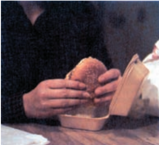
شکل ۱۵-۱- بسته بندی غذاهای فوری با ظروف پلی استیرن مشکلی برای محیط زیست شده است.