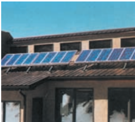
شکل ۱-۲- این خانه به یک دانشمند صاحب‌نظر در توسعه‌ی پایدار تعلق دارد. الکتریسیته‌ی مورد نیاز این خانه از نور خورشید گرفته می‌شود.

امروز موضوع حفاظت محیط زیست از هسته‌های کوچک محلی به یک راهبرد جهانی رسیده است و به صورت یک همکاری گسترده بین ملت‌ها و کشورها درآمده است.