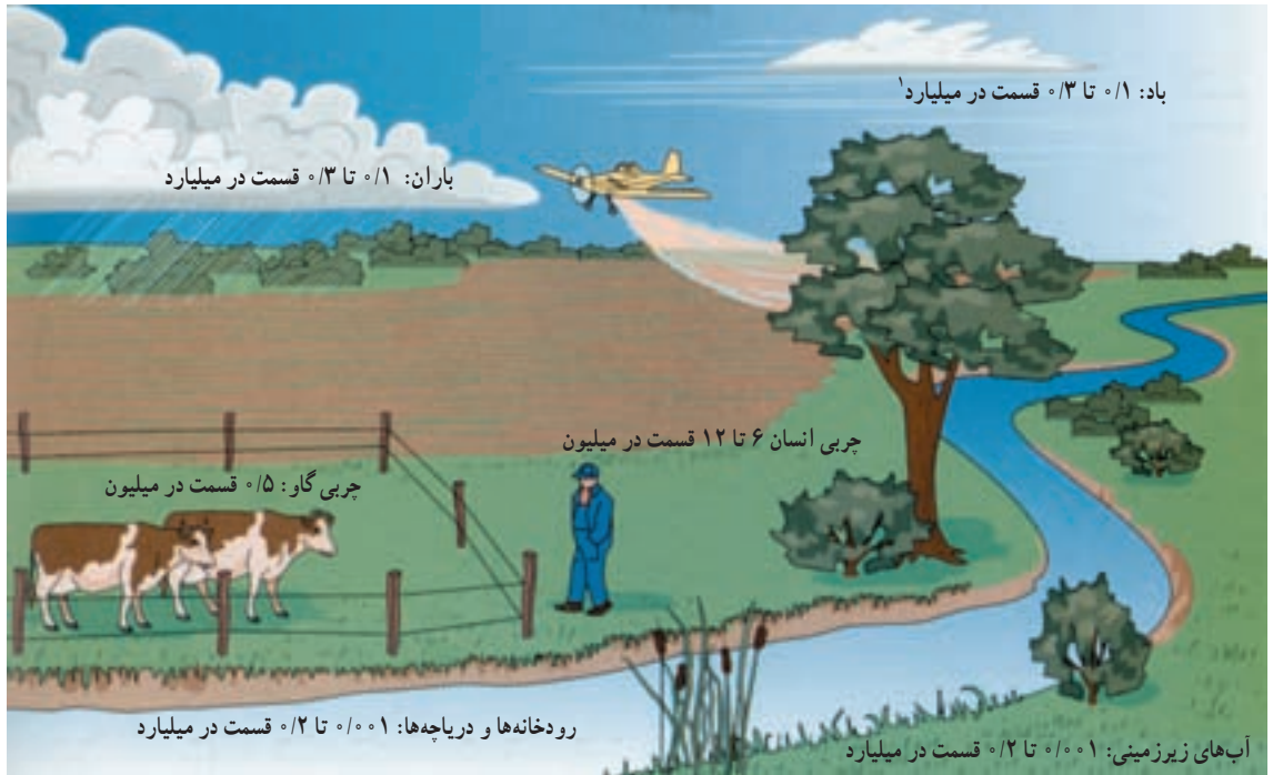
شکل ۱۹-۱- پراکنده شدن آفت‌کش‌ها - آفت‌کش‌های پخش شده توسط هواپیمای سمپاش محیط زیست را آلوده می‌سازد زیرا مقدار زیادی از سموم پراکنده می‌شوند. در این شکل روش‌های مختلف پراکندگی آفت‌کش‌ها دیده می‌شود. میانگین مقدار تجمع د.د.ت بر حسب قسمت در میلیون و میلیارد نشان داده شده است. د.د.ت در چربی بدن حل شده و در قسمت‌هایی که دارای چربی است تجمع پیدا می‌کند.

۱- Trade Winds بادی است که در نیم‌کره‌ی شمالی از شمال شرق و در نیم‌کره‌ی جنوبی از جنوب شرق می‌وزد. به علت خنکی و لطافت آن در ایران به باد صبا معروف است.