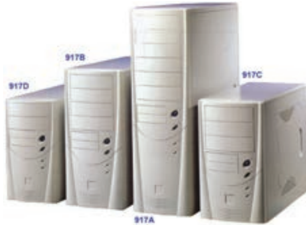
شکل ۷-۲ کیس‌های برجی در اندازه‌های مختلف

- برج کوچک ۱ : برای برد اصلی با فاکتور شکل MicroATX.