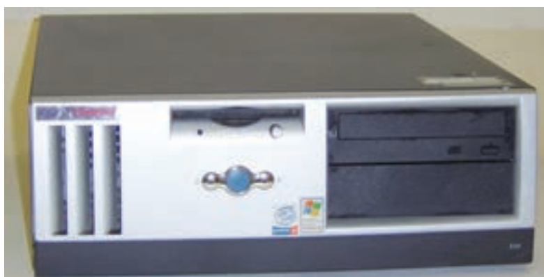
شکل ۷-۱ کیس رومیزی

این نوع کیس به صورت افقی است (شکل ۷-۱) و بر روی میز قرار می‌گیرد و به طور معمول صفحه‌نمایش را روی آن قرار می‌دهند. امروزه از این نوع کیس‌ها خیلی کم استفاده می‌شود.