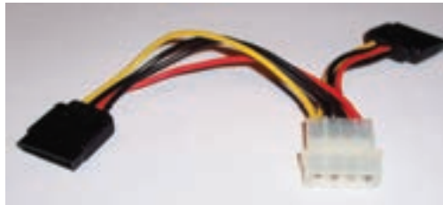
شکل ۴-۷ کابل های منبع تغذیه

منبع تغذیه سطح ولتاژهای متفاوت ۳/۳، ۵ و ۱۲ ولت را تولید می کند که سطح ولتاژ ۳/۳ و ۵ ولت، جهت استفاده ی مدارهای منطقی و سطح ولتاژ ۱۲ ولت برای راه اندازی موتورهای دیسک گردان ها و یا پروانه های خنک کننده استفاده می شود. با بالا رفتن مصرف برق پردازنده های چند هسته ای و کارت های گرافیک، نیاز سیستم های امروزی به خروجی ۱۲ ولتی بیشتر شده است. به همین دلیل در هنگام تهیه ی منبع تغذیه باید توجه داشت که خروجی ۱۲ ولت آن بیشترین توان را داشته باشد. استفاده ی زیاد از خروجی های ۵ و ۳/۳ ولتی در سیستم های مدرن که دارای پردازنده های چند هسته ای و چند کارت گرافیک هستند باعث کاهش توانایی منبع تغذیه در تأمین برق مورد نیاز اجزای اصلی می شود که عموماً از خروجی های ۱۲ ولتی