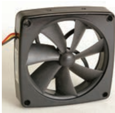
شکل ۷-۷ پروانه‌ی خنک کننده

برای خنک کردن منبع تغذیه‌ی ATX، پروانه‌ی خنک کننده‌ی آن، هوای داخل کیس را به داخل منبع تغذیه کشیده و سپس به خارج از کیس می دمد. این عمل پروانه علاوه بر خنک کردن منبع تغذیه باعث گردش هوای داخل کیس و خنک شدن سایر قطعات سیستم نیز می شود. برای اطمینان از کنترل مناسب دمای قطعات داخل کیس افزون بر پروانه‌ی منبع تغذیه، پروانه‌های خنک کننده‌ی دیگری را می توان در سطوح بالایی یا جانبی کیس نصب کرد. تعداد پروانه‌های خنک کننده‌ی اضافی و ضرورت آن بستگی به محل نصب و پیکربندی رایانه از نظر نوع پردازنده و اجزای جانبی مانند دیسک گردان‌ها دارد. نمونه‌ای از پروانه‌ی خنک کننده در شکل ۷-۷ مشاهده می شود.