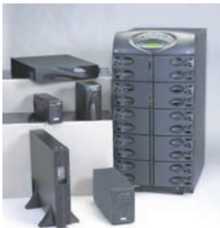
شکل ۶-۷ دستگاه‌های مختلف برای تأمین برق بی‌وقفه