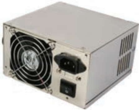
شکل ۷-۳ منبع تغذیه

باید متناسب با کیس و برد اصلی رایانه باشد و با آن‌ها سازگاری داشته باشد. در واقع باید دقت کرد که این سه قطعه از یک ساختار پیروی کنند.