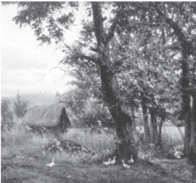
نقاشی آبرنگ اثر: رحیم نوده‌سی