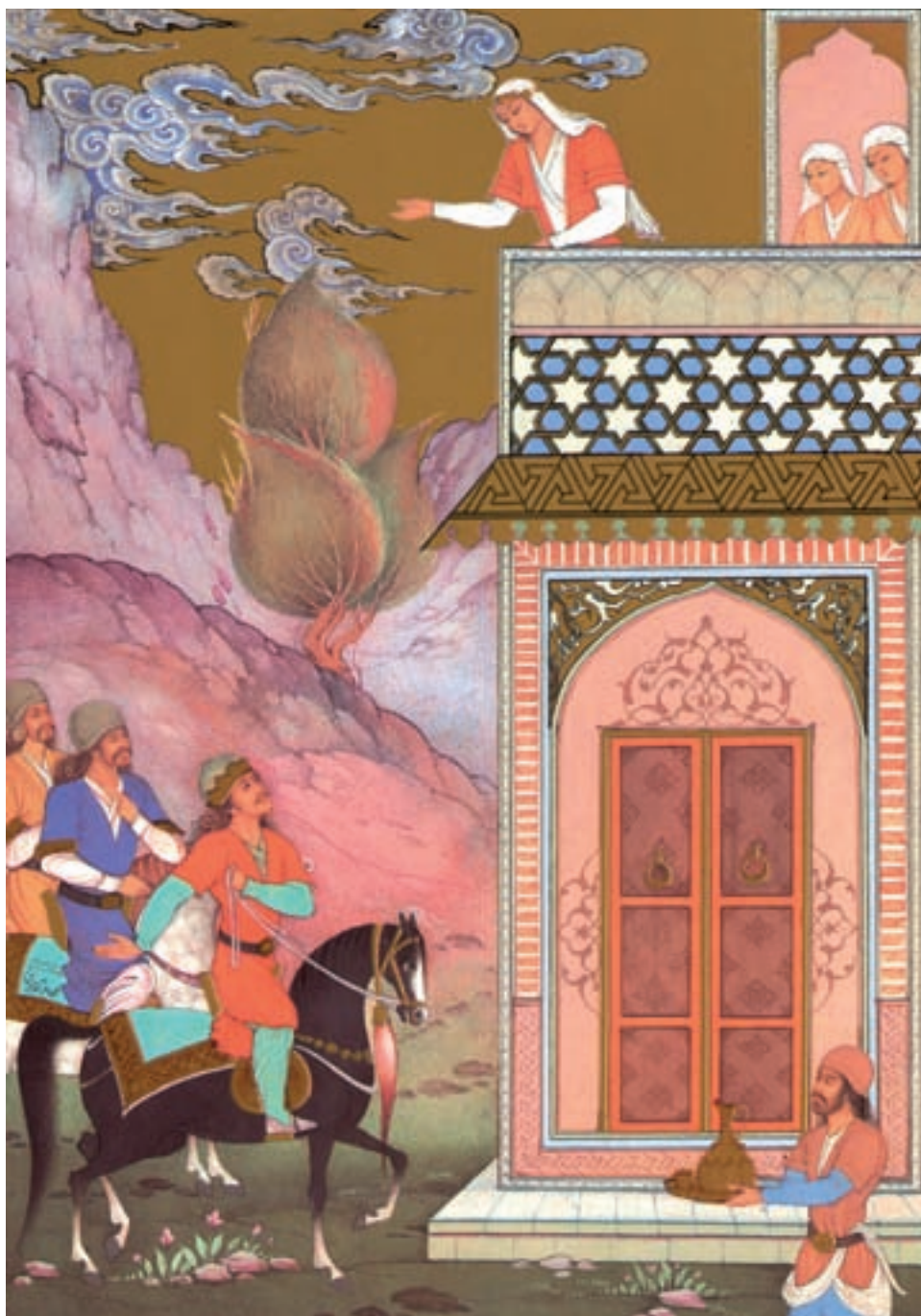
اثر محمدباقر آقامیری