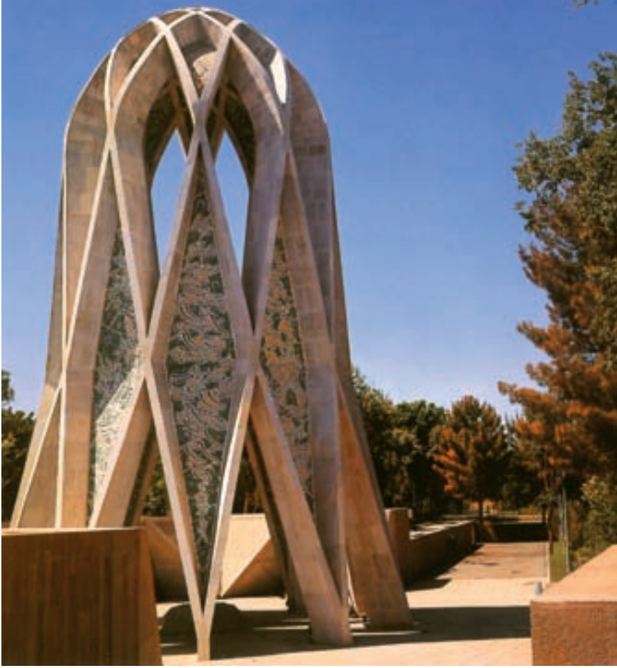
نیشابور، آرامگاه خیتام