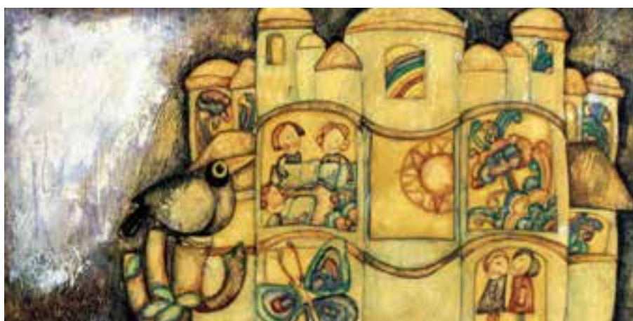
تصویر ۵- تصویرسازی با استفاده از شیوه چسب چوب، کتاب توکا، اثر زنده یاد بهرام خانف