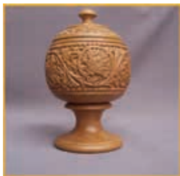
منبت شیراز بوآنات آباد

۱- هنرهای چوبی: معرق کاری، منبت کاری، خاتم کاری و ساخت سازه‌های سنتی تصاویر زیر مربوط به برخی هنرهای دستی شیراز، شهرها و روستاهای استان فارس می‌باشد.