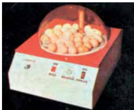
دستگاه جوجه کشی

هر ماشین جوجه کشی که بتواند این چهار عامل را بهتر تأمین کند، بازدهی بیشتری خواهد داشت. میزان نیاز جنین به چهار عامل یاد شده را در جدول زیر آورده ایم.