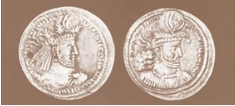
نمونه‌هایی از سکه‌های دوره‌ی ساسانیان

بودند؛ مثلاً فقط آن‌ها می‌توانستند درس بخوانند. اشراف یا بزرگان سه دسته بودند: