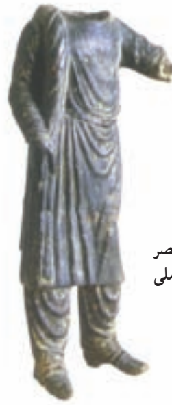
مجسمه‌ی برنزی عصر اشکانی موزه‌ی ملی ایران، تهران