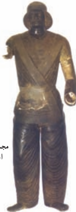
مجسمه‌ی یکی از بزرگان اشکانی موزه‌ی ملی ایران، تهران

همان‌طور که خواندید اشکانیان برای بیرون کردن سلوکیان از ایران، به کمک خاندان‌های ایرانی نیاز داشتند؛ به همین دلیل، برای اداره‌ی امور کشور به آن‌ها قدرت بسیاری دادند. قدرت و نفوذ این خاندان‌ها به حدّی بود که اشکانیان بدون مشورت آن‌ها کاری انجام نمی‌دادند. اشکانیان برای مشورت با این خاندان‌ها و حکومت‌ها مجلسی تشکیل داده بودند که مجلس بزرگان نامیده می‌شد. شاه و خانواده‌ی اشکانی نیز برای مشورت مجلسی داشتند که مجلس شاهی نام داشت. در مواقع مهم اعضای دو مجلس بزرگان و شاهی، با هم جمع می‌شدند و مجلسی به نام مجلس مهستان را تشکیل می‌دادند.