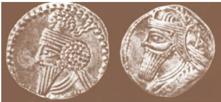
نمونه‌هایی از سکه‌های دوره‌ی اشکانیان

شاهان اشکانی به مسائل دینی کشور توجه زیادی نداشتند و برای آن‌ها اهمیتی نداشت که مردم پیرو چه دینی باشند. بدین ترتیب دین واحدی در کشور وجود نداشت و این موضوع، بیش از همه موجب نارضایتی روحانیان زردشتی بود.