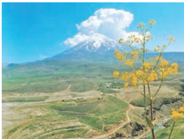
شکل ۴۷ - قله‌ی دماوند - رشته کوه البرز

در قسمت شمال غربی زاگرس، برف و باران فراوانی می‌بارد؛ به همین علت، به این بخش زاگرس مرطوب می‌گویند که از قله‌های مهم آن می‌توان اُشتران‌کوه و زردکوه را نام برد. رودهای پرآب کرخه، دز و کارون از زاگرس مرطوب سرچشمه می‌گیرند. قسمت جنوب شرقی زاگرس را زاگرس خشک می‌نامند. در زاگرس خشک از میزان ریزش برف و باران کاسته می‌شود. رود کُز از رودهای مهم این بخش، و قله‌ی دنا از قله‌های مهم زاگرس خشک، است.