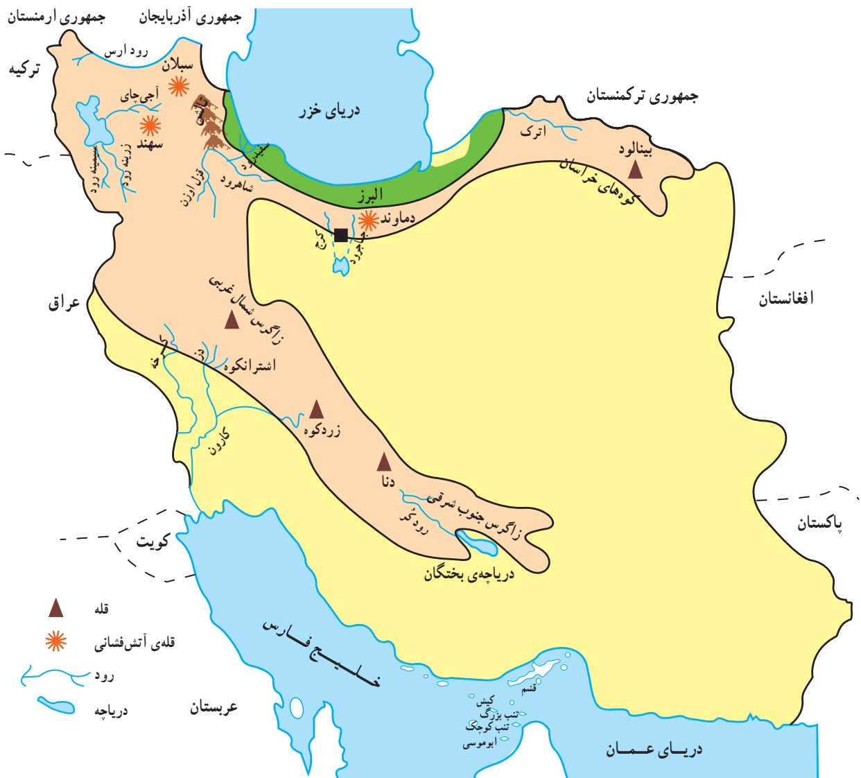
شکل ۴۶ - ناهمواری های ناحیه ی کوهستانی

(آذربایجان) به یکدیگر متصل شده اند. در برخی کوه های بلند آذربایجان، آثار آتش فشانی گذشته به خوبی دیده می شود. سهند و سبلان بلندترین قله های آتش فشانی این ارتفاعات اند. در زمستان برف فراوانی در ارتفاعات انباشته می شود که منبع تأمین آب رودها و چشمه هاست. رود مرزی ارس بین ایران و جمهوری آذربایجان و جمهوری ارمنستان در شمال این ناحیه جریان دارد. پست ترین نقطه ی آذربایجان، دریاچه ی ارومیه است. با توجه به شکل ۴۶ بگویید که کدام رودها به دریاچه ی ارومیه می ریزد؟