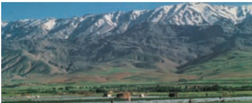
شکل ۴۸ - چشم‌اندازی از ناحیه‌ی کوهستانی، کوه گرو از رشته کوه زاگرس