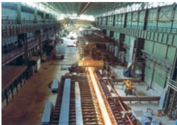
شکل ۴۱- مجتمع فولاد مبارکه - استان اصفهان

✱ معادن: در ناحیه‌ی بیابانی و نیمه‌بیابانی معادن زیادی وجود دارد. نفت و گاز چاه‌های خوزستان و کناره‌های خلیج فارس به وسیله‌ی لوله به پالایشگاه‌ها و کارخانه‌های پتروشیمی کشور فرستاده شده و بخشی از آن نیز از راه بنادر به کشورهای خارجی صادر می‌شود. هم‌چنین در این ناحیه، زغال‌سنگ و فلزاتی مانند آهن و مس استخراج می‌شود. ✱ صنایع: در این ناحیه، صنایع بزرگی هم‌چون کارخانه‌ی