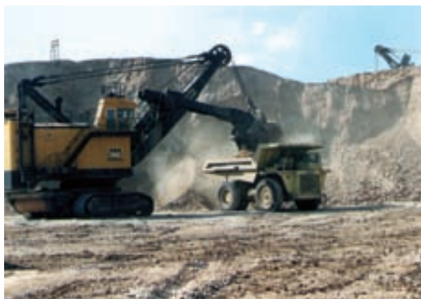
شکل ۴۰- معدن سنگ آهن گل‌گهر - کرمان