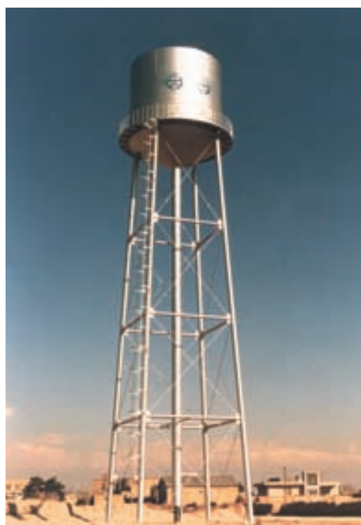
شکل ۳۳- حفر چاه و ایجاد منبع آب به وسیله وزارت جهاد کشاورزی