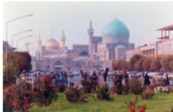
شکل ۳۵- ب - چشم‌انداز شهری - مشهد مقدس