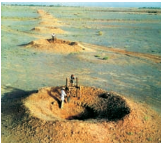
شکل ۳۲- حفر قنات برای تأمین آب در ناحیه‌ی بیابانی و نیمه‌بیابانی

روستائیان به علت وجود آب کافی، آب و هوای مساعد و خاک قابل کشت در روستاها زندگی می‌کنند. در ناحیه‌ی بیابانی و نیمه‌بیابانی، عوامل گفته شده در بالا، به اندازه‌ی کافی و مورد نیاز وجود ندارد. همان‌طور که در شکل ۲۴ (انواع خاک‌ها) دیدید، در این ناحیه، میزان خاک مساعد و حاصلخیز کم است؛ به‌علاوه، در مناطقی هم که خاک مناسب وجود دارد، آب کافی در اختیار نیست. یکی از مهم‌ترین مشکلات کشاورزی در این ناحیه، کمبود آب است.