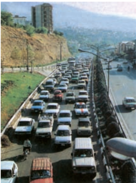
شکل ۳۷- ازدحام وسایل نقلیه در تهران

گسترش سریع جمعیت در تهران سبب آلودگی محیط‌زیست، کمبود منابع آب، کمبود مسکن، کمبود فضای سبز (پارک) شده و تصمیم‌گیری را برای مسئولان امور دشوار کرده است.