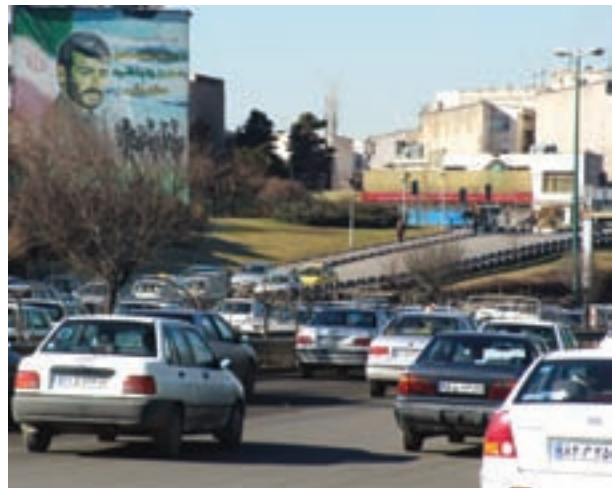
شکل ۳۵- الف - چشم‌انداز شهری تهران - بزرگراه شهید همت

در ناحیه‌ی بیابانی و نیمه‌بیابانی، به‌سبب کمبود آب و خاک مناسب برای کشاورزی، زندگی شهری نسبت به زندگی روستایی از رونق بیش‌تری برخوردار است. در این ناحیه، شهرهای پرجمعیت بیش‌تر در کوهپایه‌ها به‌وجود آمده‌اند. آیا می‌دانید چرا؟ سه شهر تهران، مشهد و اصفهان که در ناحیه‌ی کوهپایه‌ای قرار گرفته‌اند، به ترتیب، پرجمعیت‌ترین شهرهای کشورند. در بعضی نواحی پست این ناحیه نظیر جلگه‌ی خوزستان نیز شهرها به‌دلیل وجود معادن، توسعه یافته‌اند.