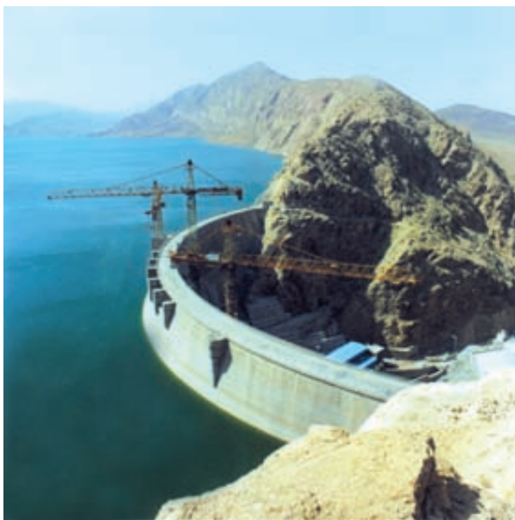
شکل ۳۴- سد ساوه در استان مرکزی برای تأمین مصارف کشاورزی و تولید برق