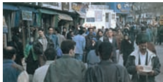
شکل ۳۶- ازدحام جمعیت در تهران