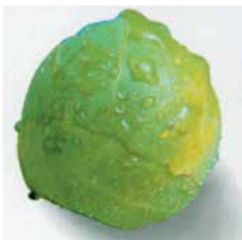
شکل ۸۷-۱- یک تکمه کلم را نشان می‌دهد.