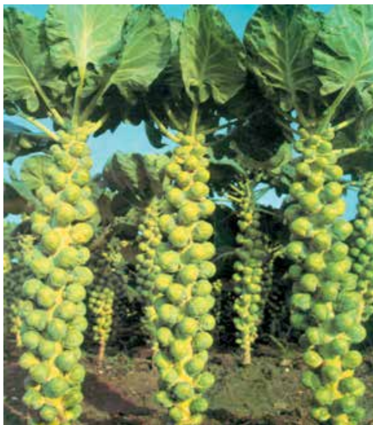
شکل ۸۶-۱- تکمه‌ها را روی گیاه کلم دکمه‌ای نشان می‌دهد.

- گیاهی از خانواده چلیپاییان ۱ و از جنس براسیکا ۲ و گونه براسیکا اولرسه ۳ آ و از واریته ژمنیفر ۴ است (شکلهای ۸۶-۱ و ۸۷-۱).