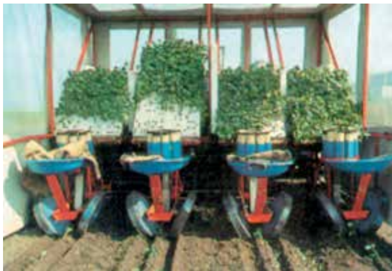
شکل ۹۴-۱- دستگاه نشاکار

– پس از نشاکاری، اطراف بوته‌ها را قدری سفت کنید. تذکر: نشاکاری را حتی المقدور در عصر و در صورت امکان در یک روز ابری انجام دهید (شکلهای ۹۴-۱ و ۹۵-۱ و ۹۶-۱).