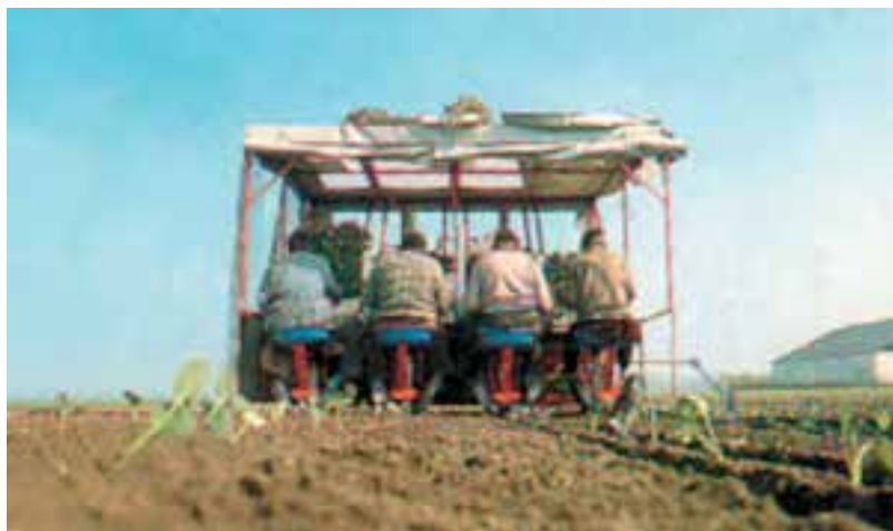
شکل ۹۵-۱- نشاکاری توسط ماشین را نشان می‌دهد.

واحد کار: تولید و پرورش کلم دکمه‌ای شماره شناسایی: ۱۱۳-۲۱۳۱۰۲۱۰