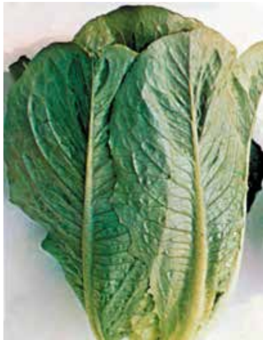
شکل ۶۱-۱- الف

برگها: بدون دمبرگ با قاعده نسبتاً پهن (رگبرگ و سطحی در قاعده بسیار پهن است) بر روی ساقه چسبیده و اغلب بر روی آن تا شده است و گویچه ای را به وجود می آورد. برگهای درونی کمرنگ تر، زرد، کرم یا زرد مایل به سبز می باشند. برگهای بیرونی به رنگ سبز تیره یا سبز مایل به خاکستری است. برگها، نرم، آبدار، شیرابه دار، خوشمزه و کمی شیرین می باشند که خوراکی هستند (شکل ۶۱-۱).