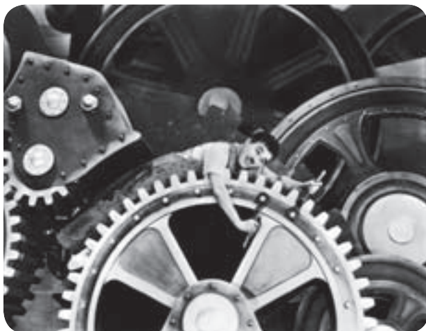
● صحنه‌ای از فیلم عصر جدید چارلی چاپلین

چهارم: غلبه‌ی کنش‌های عقلانی معطوف به هدف ؛ مراد از عقلانیت در این عبارت، عقلانیت ابزاری و منظور از هدف، امور قابل دسترس در این جهان است؛ یعنی در این جهان، آدمیان متوجه اهداف دنیوی‌اند و برای رسیدن به این هدف‌ها از علوم تجربی استفاده می‌کنند. پنجم: زوال عقلانیت ذاتی ؛ منظور از عقلانیت ذاتی، سطحی از عقلانیت است که درباره‌ی ارزش‌ها، آرمان‌ها و اهداف زندگی به تأمل بپردازد. در جهان متجدد، متافیزیک و علمی که داورهای ارزشی می‌کنند از بین می‌روند.