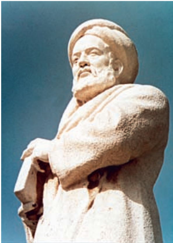
مجسمه‌ی ابوعلی سینا (همدان)

(ب) التّفهیم لاوایل صناعة التّنجیم: نام ابوریحان محمد بن احمد بیرونی (فوت: ۴۴۰ ه.ق.) دانشمند بزرگ و استاد ایرانی اهل خوارزم بر تارک علم و معرفت قرن‌های چهارم و پنجم هجری می‌درخشد. او بیش‌تر آثار گران‌قدر خویش را در زمینه‌های طب، جغرافی، ریاضی و فلسفه به زبان عربی تألیف کرده است اما کتاب التّفهیم را ابتدا به خواهش ریحانه، دختر حسین خوارزمی، یکی از رجال دانش‌دوست معاصر خود در سال ۴۲۰ ه.ق. به فارسی نوشته و بعداً آن را به عربی درآورده است. این کتاب اوّلین و مهم‌ترین کتابی است که خاصّ علم نجوم و هندسه و حساب به فارسی نوشته شده و از آن‌جا که نویسنده‌ی آن یکی از دانشمندان بنام در این رشته است، اهمّیت و اعتبار خاصّی یافته است.