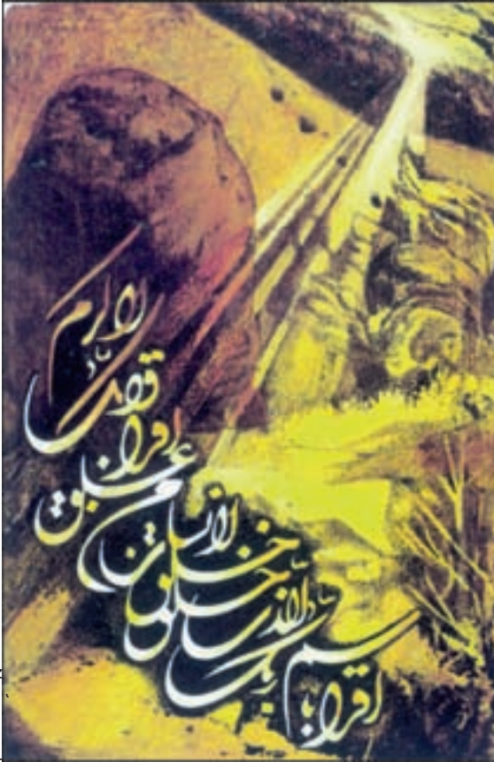
اثر پرویز مصباحی

آن جا به طور برجسته نمایان است. از آن جا مسجد الحرام و خانه های مکه پیداست. فضای اطراف مکه با کوه های کوتاه و بلند آن نمایان است. کوه های عبوس و زمخت و سخت که هیچ گونه علایم حیات در آن دیده نمی شود.