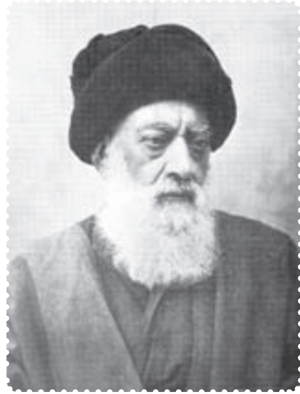
آیت الله طباطبایی

قیام شومند. در ادامه‌ی این جریان و همزمان با سفر سوم مظفرالدین‌شاه به اروپا، عده‌ای از بازرگانان در حرم حضرت عبدالعظیم (ع) تحصن کردند. ۱