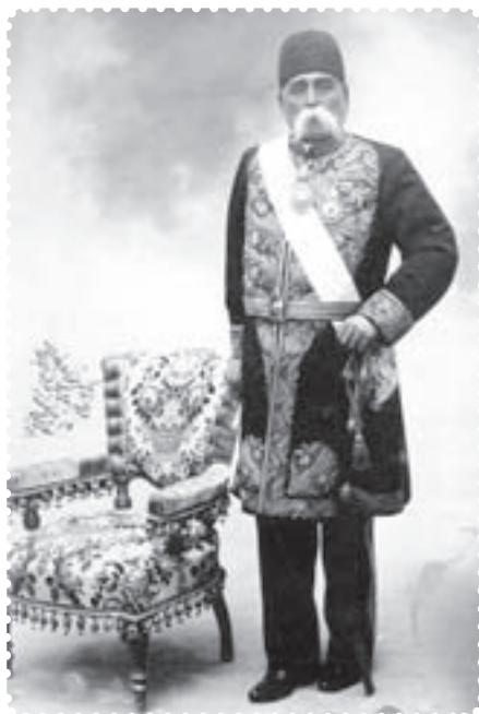
عبدالمجید میرزای عین الدوله

کشمکش بین طرفداران استبداد و عدالت خواهان، شدت گرفت. دولت به وحشت افتاد و با پا در میانی حاج میرزا ابوالقاسم امام جمعه، به طور موقت، قضیه فیصله یافت. حاج میرزا ابوالقاسم، داماد ناصرالدین شاه بود. او از جانب شاه به امامت جمعه‌ی تهران منصوب شده بود و از وی و دربار، پشتیبانی می‌کرد.