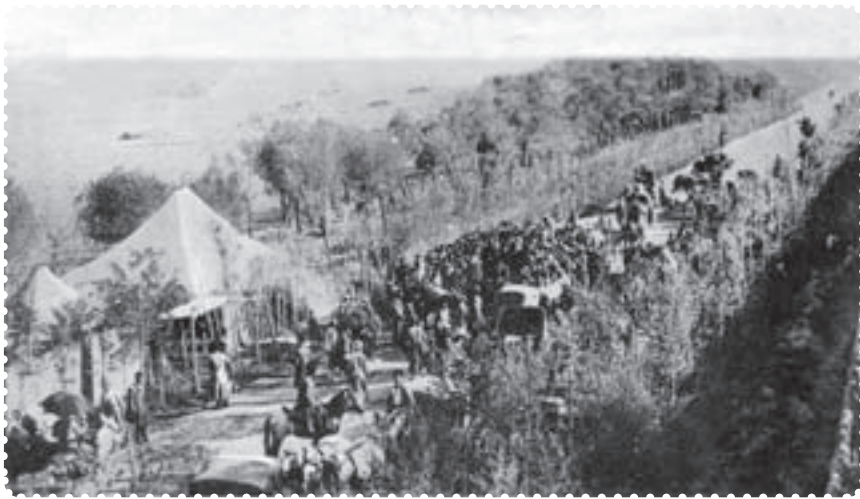
بازگشت علما از مهاجرت کبری

مظفرالدین شاه تسلیم خواسته‌های مردم شد. او عین‌الدوله را عزل کرد و فرمان تشکیل مجلس شورای ملی را در ۱۴ مرداد ۱۲۸۵ ش. صادر کرد. هفت روز بعد، علما، با استقبال پرشکوه مردم، از قم بازگشتند. شهر چراغانی و جشن شادی به پا شد و در ۲۸ مرداد، اولین دوره‌ی مجلس شورای ملی با حضور نمایندگان تهران تشکیل گردید. عده‌ای از سیاستمداران مشروطه‌خواه، به تدوین قانون اساسی پرداختند. ۱ آنان با عجله آن را نوشتند و به امضای مظفرالدین شاه رساندند. شاه، ده روز پس از امضای قانون اساسی، درگذشت. به این ترتیب، کشور استبداد زده‌ی ما، با بهره‌گیری از اندیشه‌های سیاسی عالمان بزرگ دینی، کوشش فرهیختگان جامعه و مجاهدت مردم، به حکومتی دست یافت که می‌بایست براساس قانون اداره می‌شد.