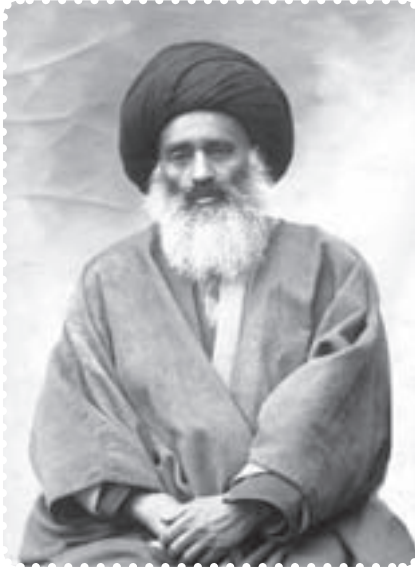
آیت الله بهبهانی