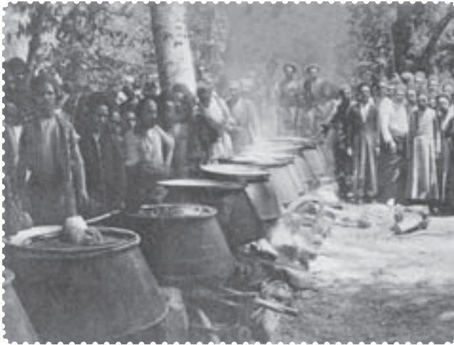
دیگ‌های غذا در سفارت انگلیس برای مشروطه خواهان

زیارتگاه‌ها و اماکنی صورت می‌گرفت که مورد احترام مردم قرار داشت و با باورهای دینی آن‌ها سازگار بود. مشروطه‌خواهان، بدون پناهندگی به سفارت انگلستان، می‌توانستند به خواسته‌های خود دست یابند. دولت انگلستان بر خلاف دولت روسیه که از دربار حمایت می‌کرد، به ظاهر